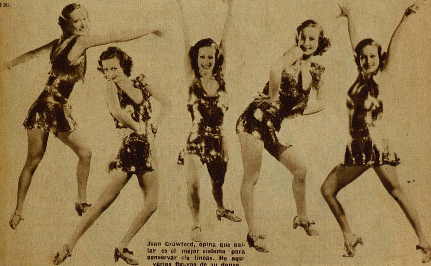
Joan Crawford, opina que bailar es el mejor sistema para conservar «la línea». He aquí varias figuras de su danza favorita.

Los cumpleaños de Ramón Novarro y Helen Chandler, se celebraron mientras filmaban juntos «Amanecer», y el «set» de la Metro se convirtió magníficamente en un espléndido comedor.