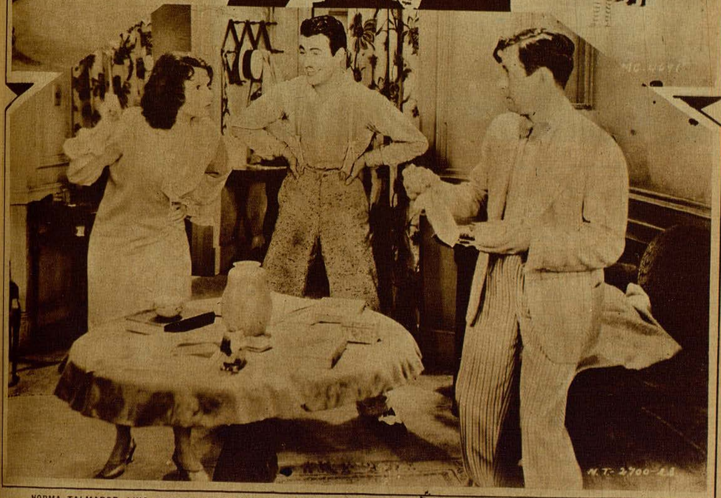
NORMA TALMADGE, LUIS ALONSO Y ROSCOE KEARN, PRINCIPALES INTERPRETES DE LA PELICULA SONORA «NOCHES DE NUEVA YORK» EN UNA GRACIOSA ESCENA DE LA MISMA