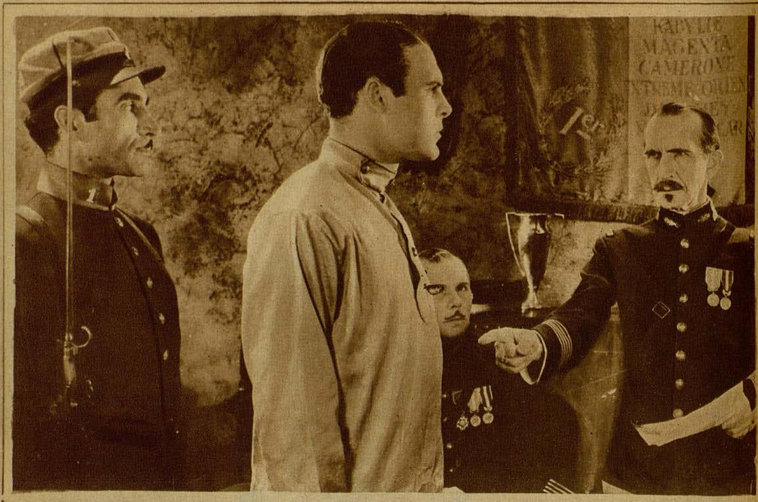
una escena de la película sonora «La isla del diablo»