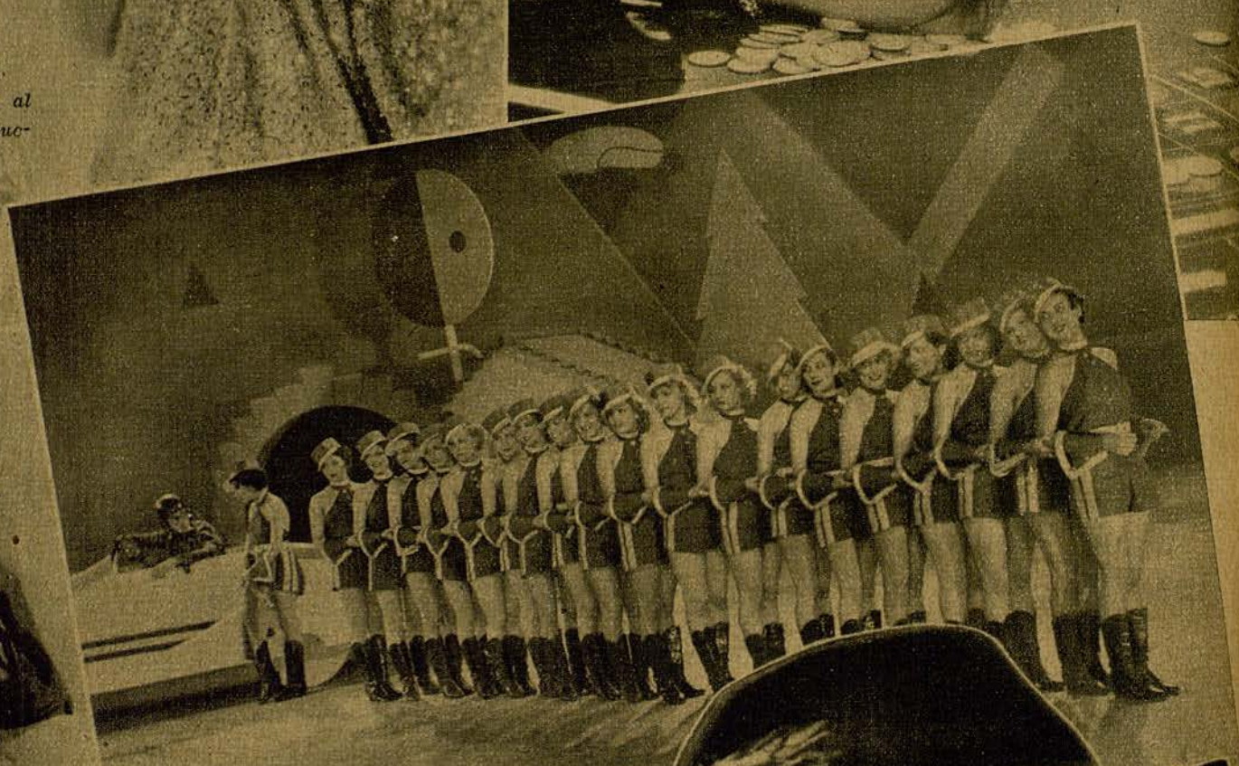
Fox ferroviario. Manojito de encan- tadoras ferroviarias que en "Los hé- roes del barrio", que actualmente se está rodando en los estudios Orpheu, encontrarán seguramente via libre