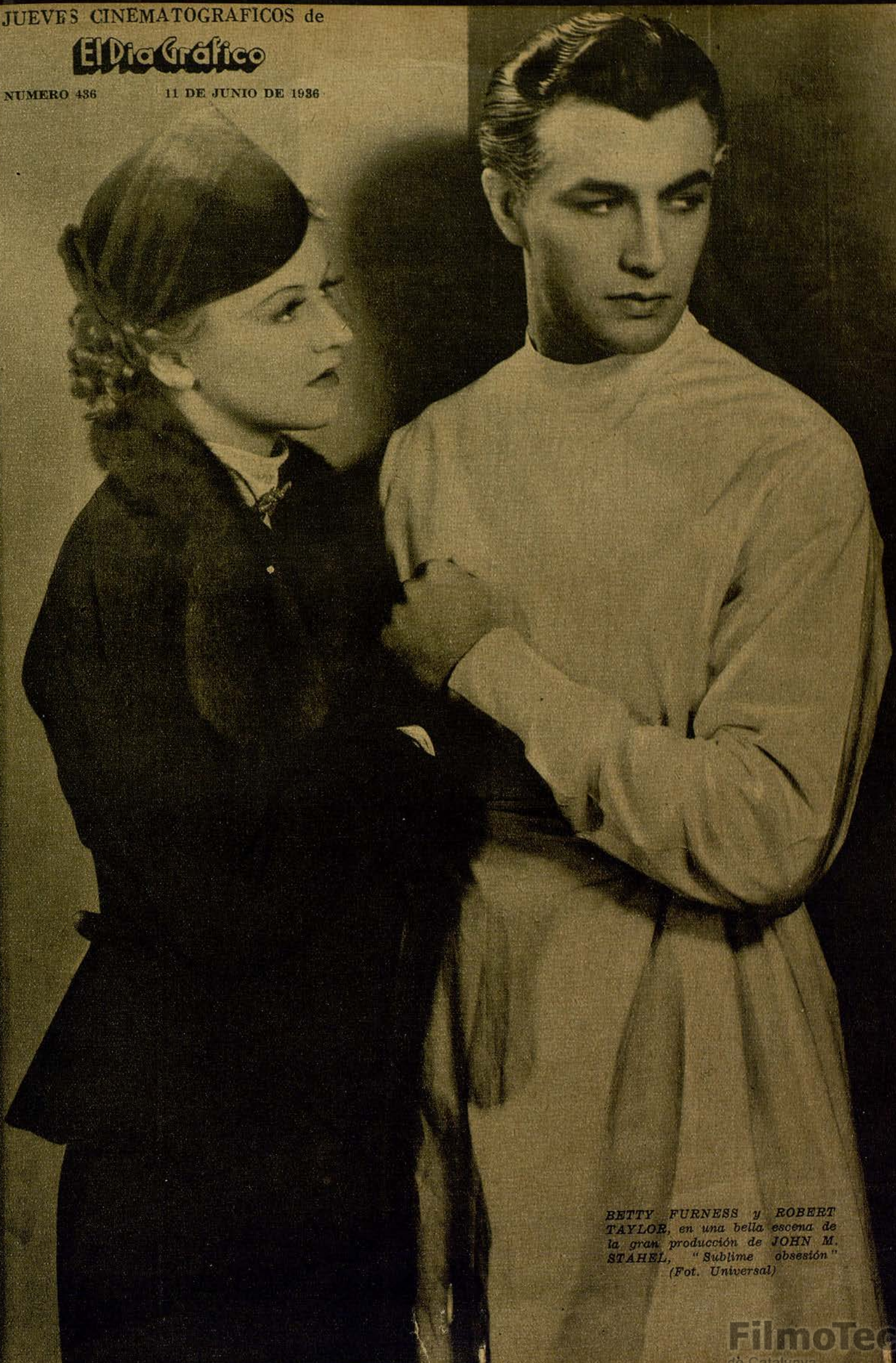
BETTY FURNESS y ROBERT TAYLOR, en una bella escena de la gran producción de JOHN M. STAHEL, "Sublime obsesión"