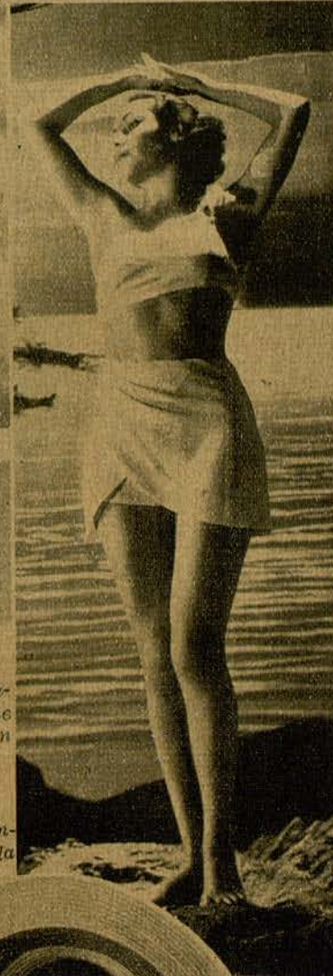
← DOLORES DEL RIO, la escultural estrella de la Warner, que se despereza antes de bañarse