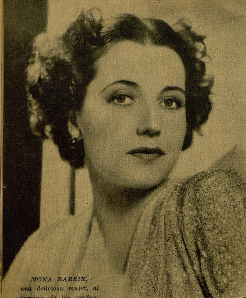
MONA BARRIE, una deliciosa mujer, al servicio de las produc- ciones de la Fox