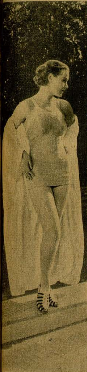
FRANCES FARMER, de la Paramount, se pregunta: ¿Estará fría el agua?