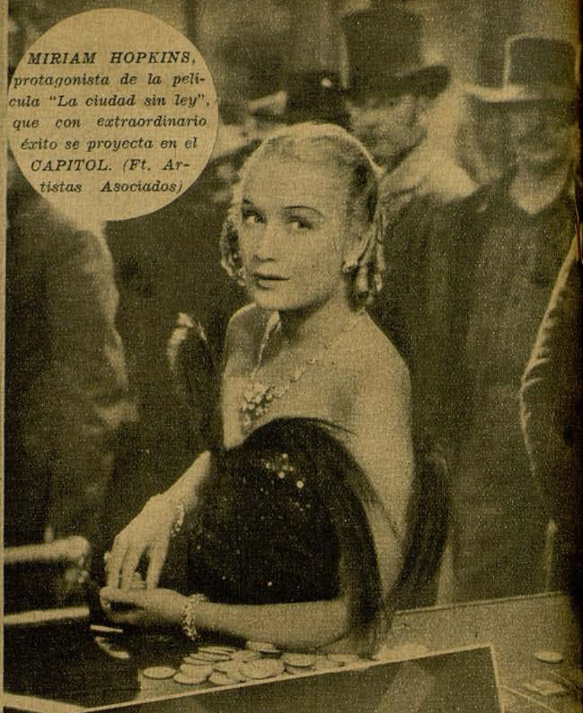
MIRIAM HOPKINS, protagonista de la peli- cula "La ciudad sin ley", que con extraordinario éxito se proyecta en el CAPITOL.