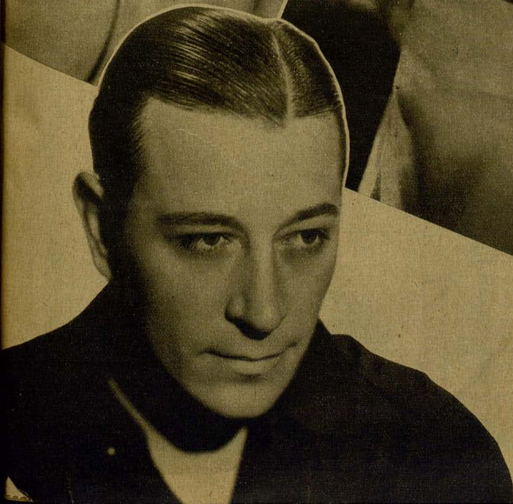
Ginger Rogers, CHISPEANTE ESTRELLA. Y