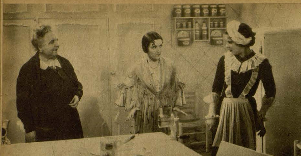
Una escena de la interesante producción española, que protagoniza IMPERIO ARGENTINA, MORENA CLARA. Local de estreno: SALON CATALUÑA