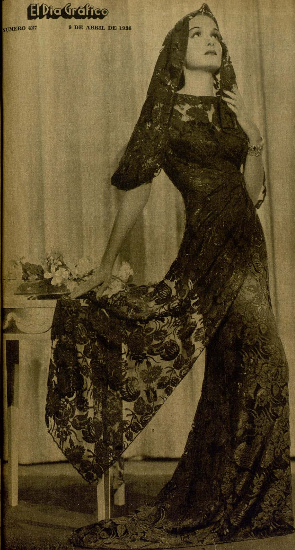
GAIL PATRICK, conocida estrella, mujer bellísima de cuerpo estatuario y elegancia suprema. En esta fotografía aparece su silueta cubierta de blondas, en un traje de línea clásica