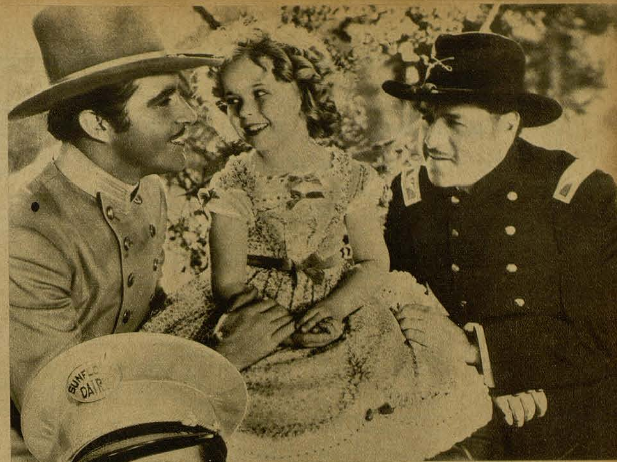
Una escena de la película REBELDE, cinta que protagoniza la estrellita favorita del público, SHIRLEY TEMPLE. Local de estreno: CAPITOL.