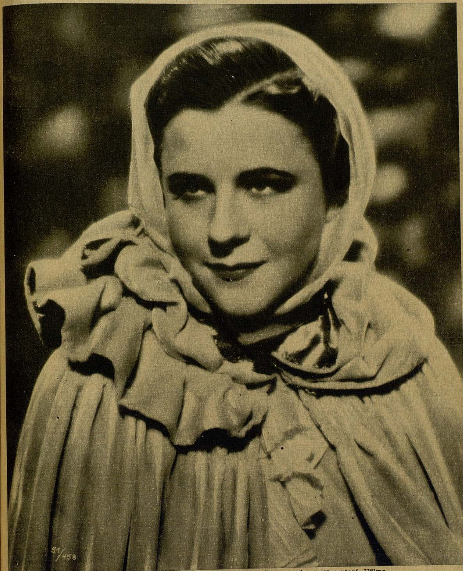
Paula Wessely, protagonista del gran film "Episodio", que en breve presentará Ufilms