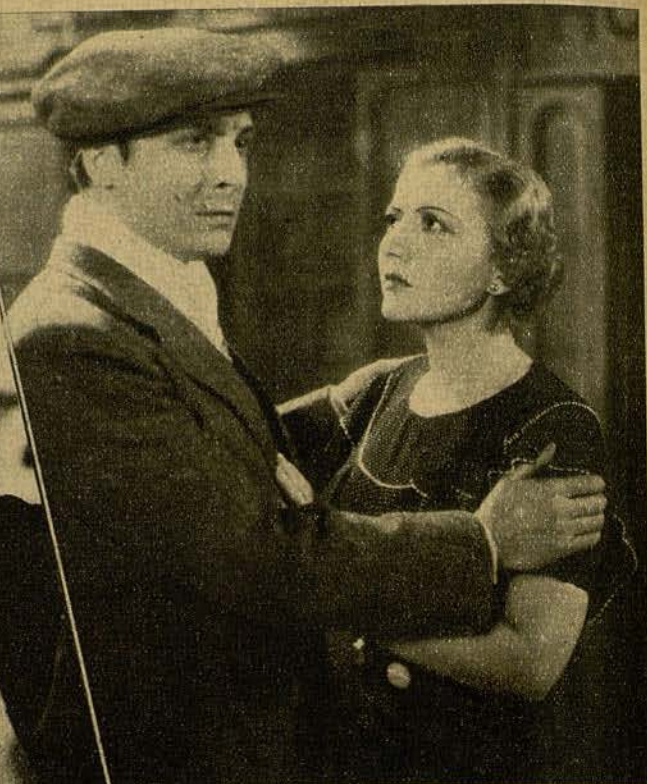
Dos escenas de "Don Quintín, el Amargao" y "Es mi hombre", sainetes netamente madrileños que la pantalla ha sabido realizar con gran acierto