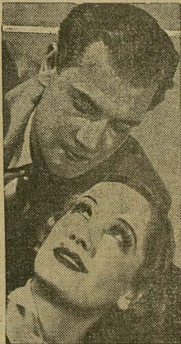
Miriam Hopkins y Joel Mac Crea, en "La Venus de Oro"

El y su bellísima mujercita no han dado nunca escándalo alguno en la Meca cinelándica, no han si-