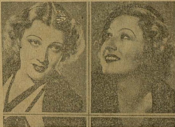
MARGOT GRAHAME, artista inglesa de gran belleza y reputación, debuta en películas de Hollywood con el film dramático "El delator", en el que interpreta el papel de Katie, la novia del gigantesco Gypo. Miss Grahame tiene contrato exclusivo con la RKO-RADIO

Les rozó al pasar un pordiosero ciego. Lanzando una maldición, Gy-