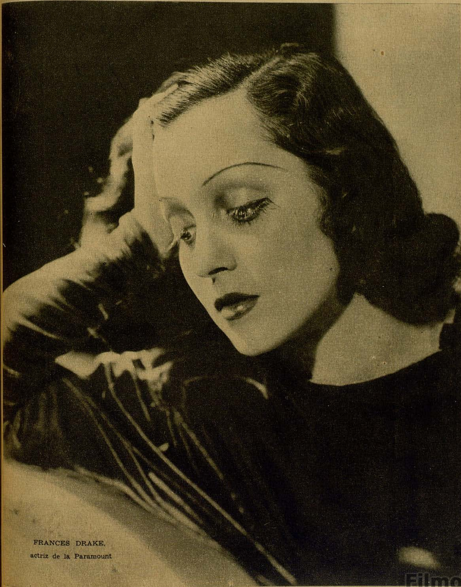
FRANCES DRAKE, actriz de la Paramount