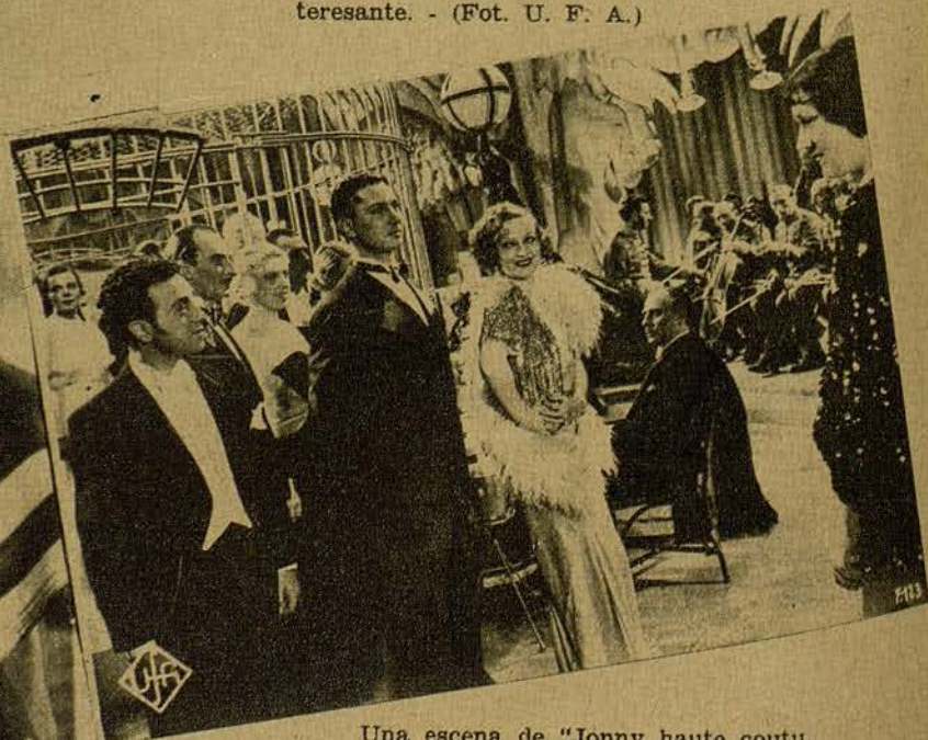
Una escena de "Jonny haute couture", de la misma Empresa