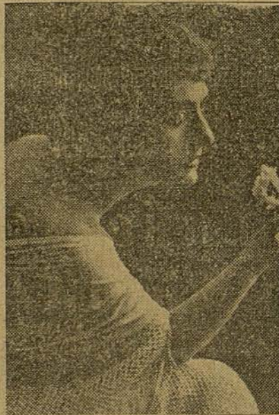
FRANCESCA BERTINI antes de la guerra

La Bertini, diosa del celuloide primitivo, la estrella de ayer, quiere