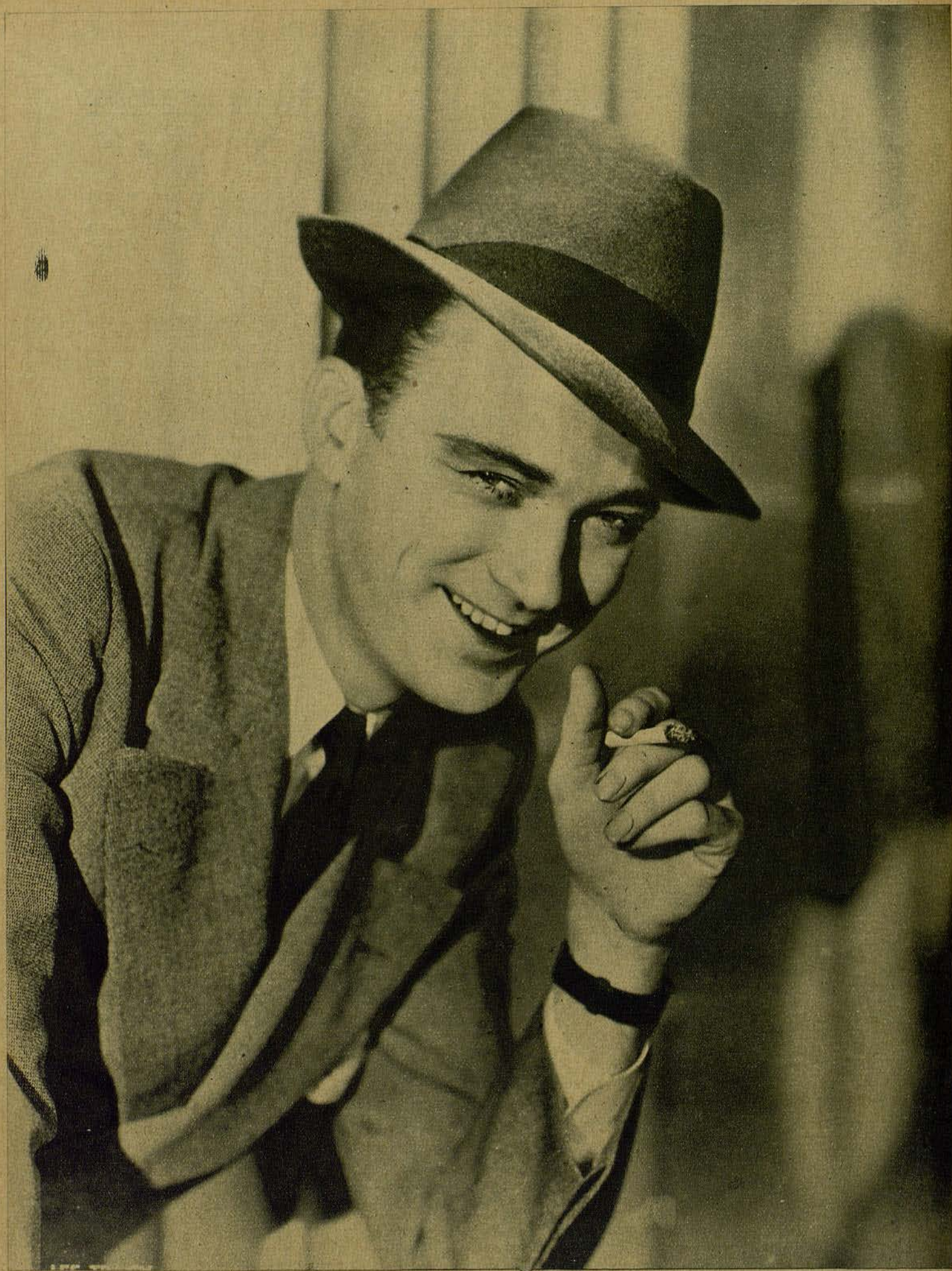
LEE TRACY, NUEVO GALAN, QUE LO UNE LA ESPIRITUALIDAD CON LOS RIBETES COMICOS DE SUS CARACTERIZACIONES