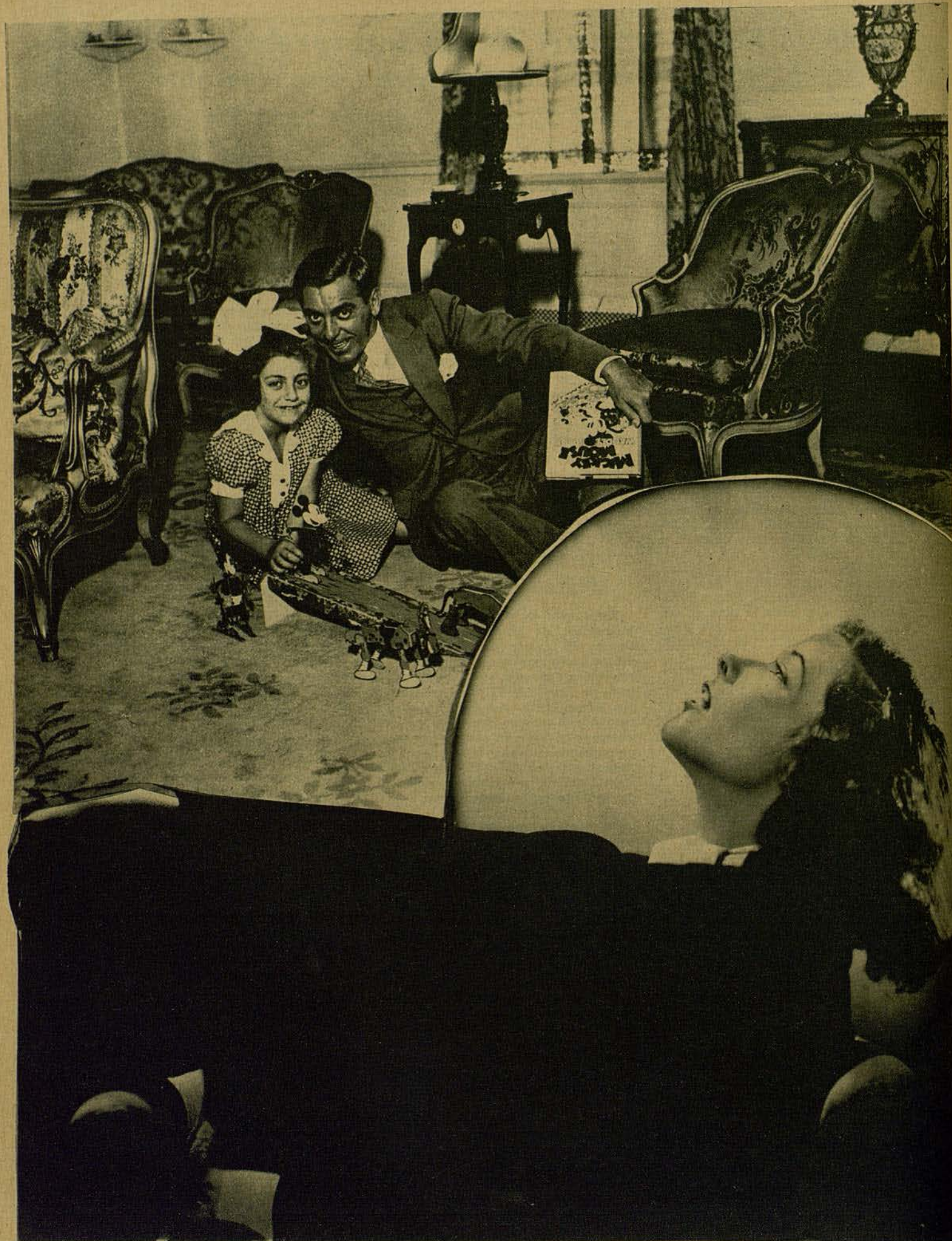
Eddie Cantor y su hijita menor, disfrutaban alegremente los regalos de Papa Noel Abajo, Katharine Hepburn, la estrella que ha revolucionado Hollywood, presenta al público su delicioso perfil imperfecto. Recientemente ha triunfado en «Las cuatro hermanitas», y próximamente asombrará con «Gloria de un día»