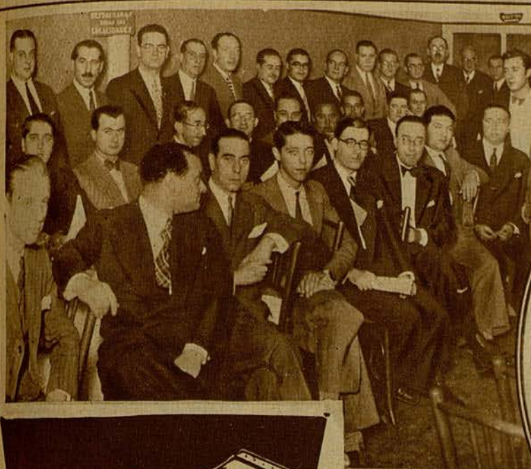
Grupo de asistentes al banquete que se celebró por el éxito de «Cuatro de Infanteria»