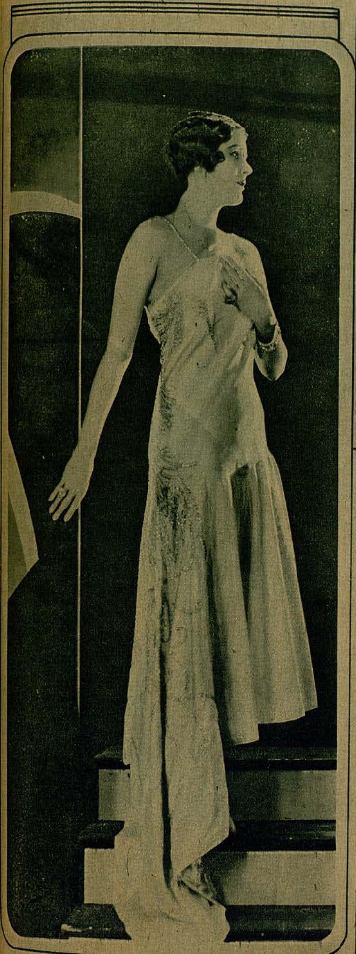
La gentil estrella June Collyer, que ha ingresado en los Studios Paramount