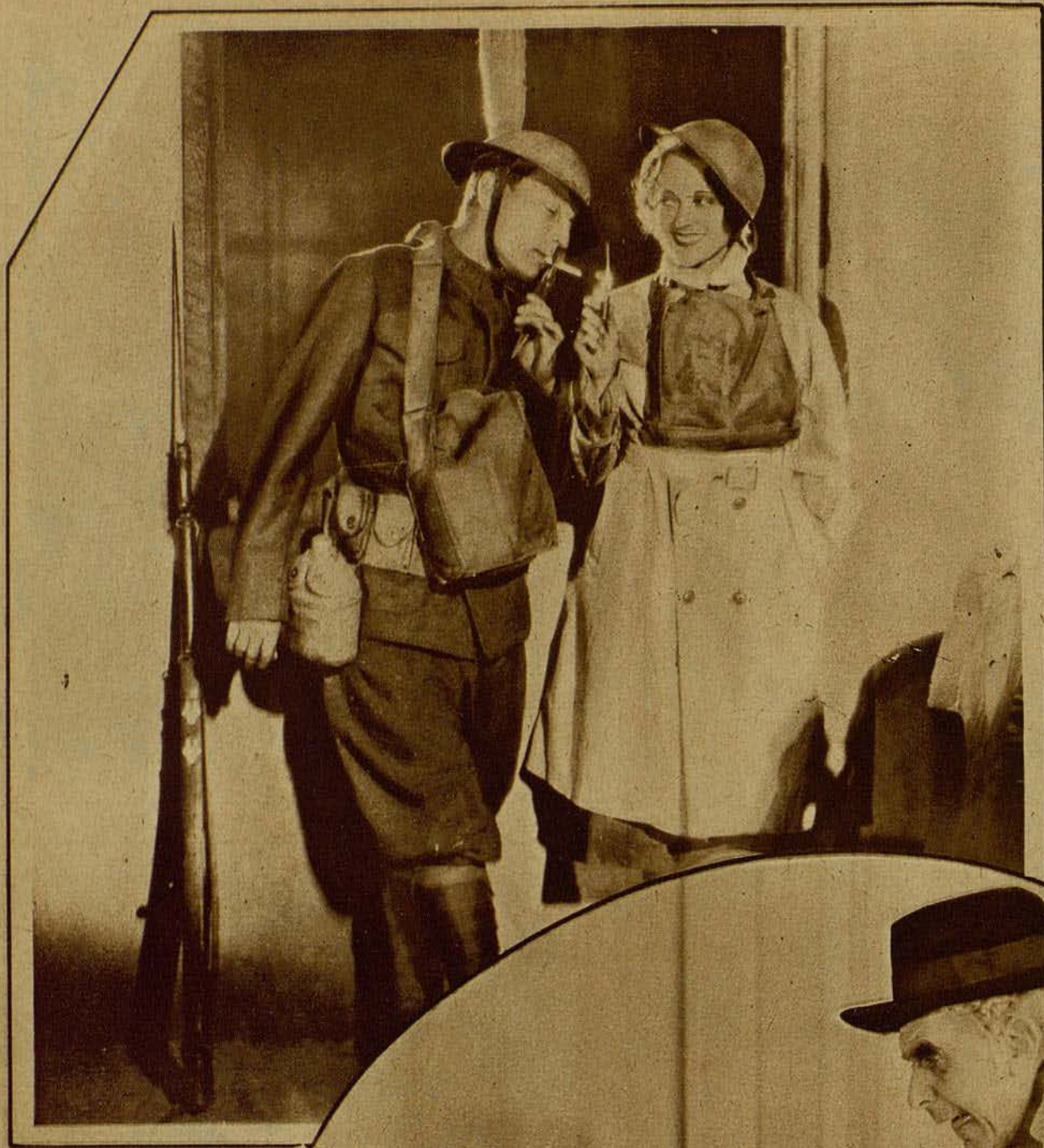
Buster Keaton y Sally Eilers, en una escena de la divertida comedia sobre la vida militar