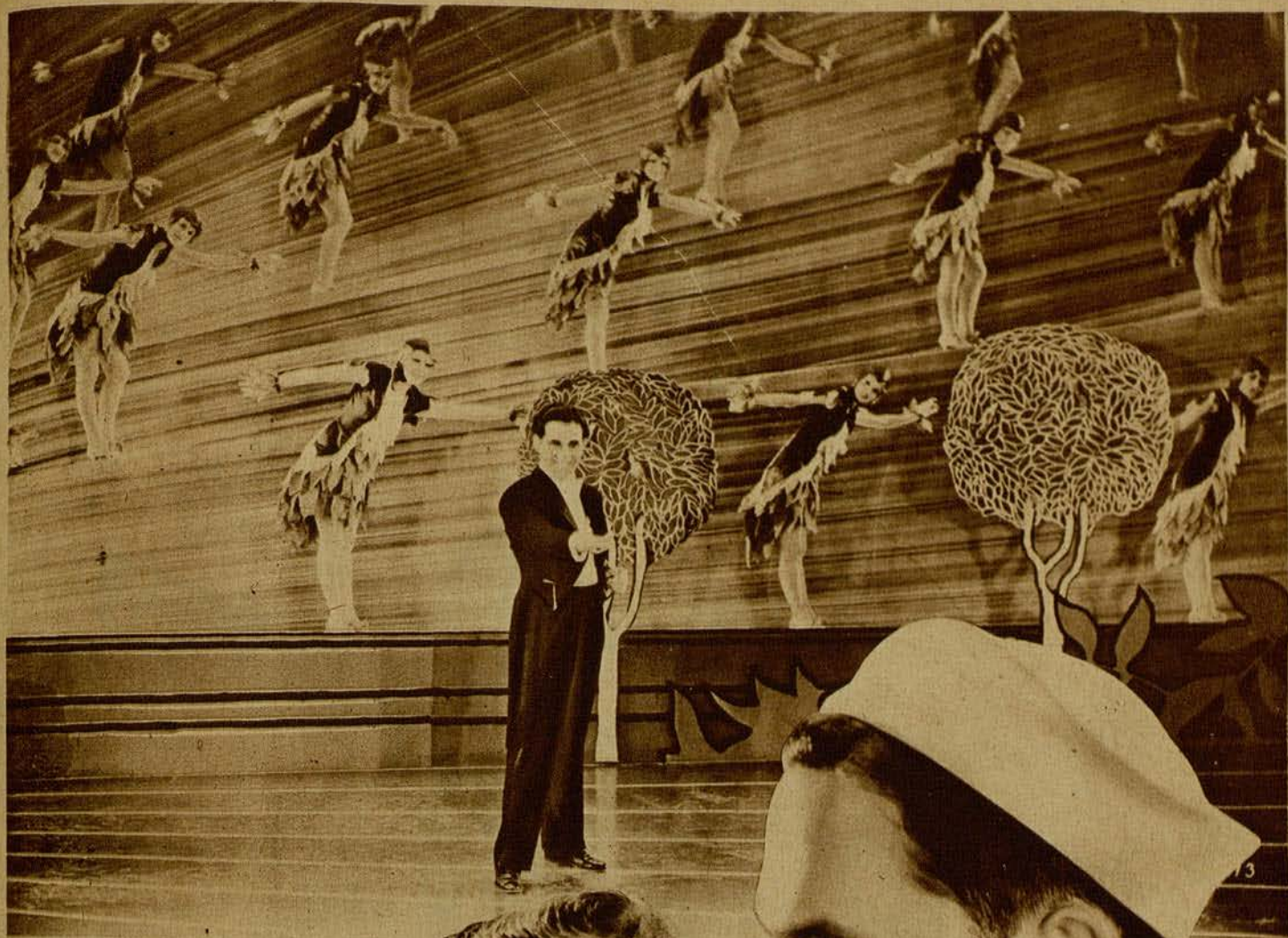
José Bohr, el gran actor cantante, en el superfilm enteramente hablado y cantado en español «Sombras de Gloria», de las Selecciones Gaumont Diamante Azul