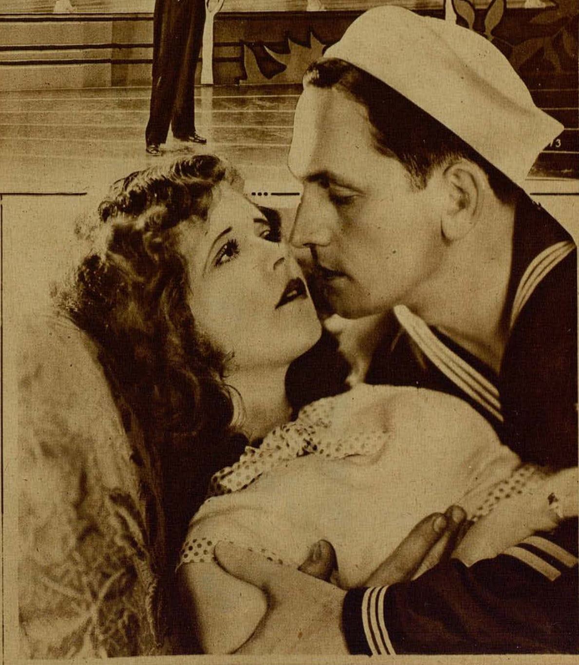
Una escena de la película «Fiel a la Marina», en la que aparece Clara Bow, secundada por Fredric March