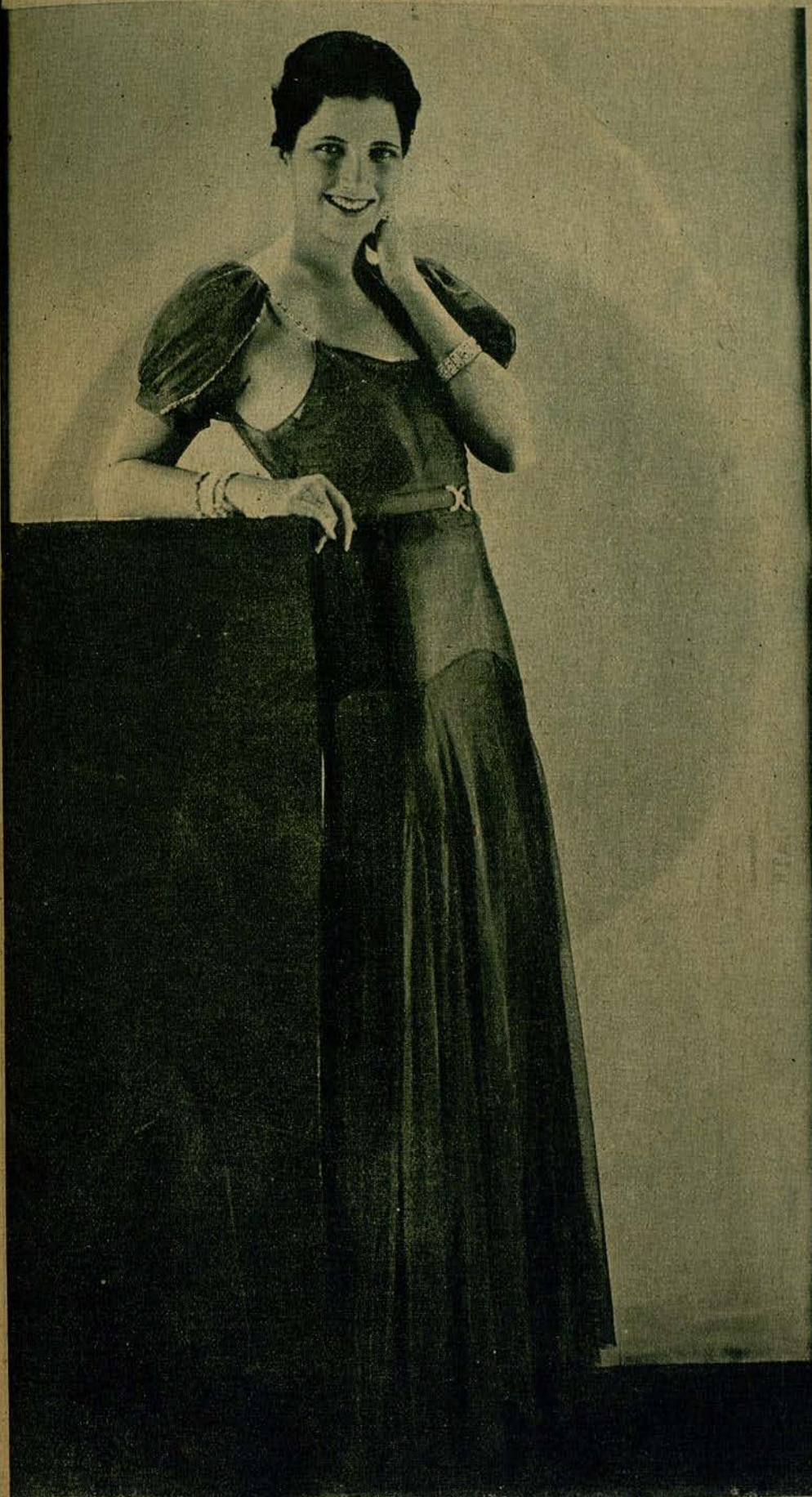
Kay Frances, nueva estrella que ha descubierto el film sonoro