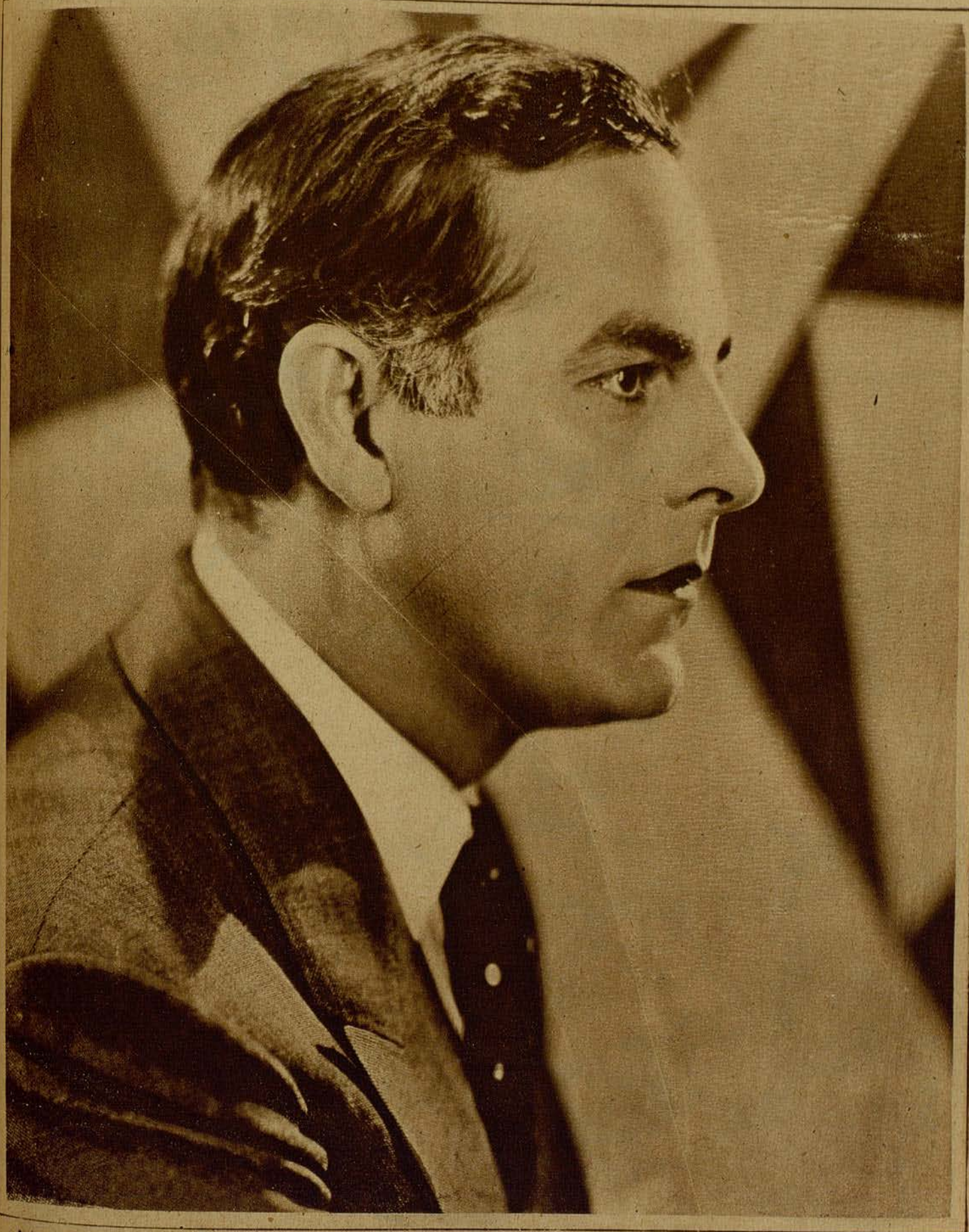
Antonio Moreno, el insigne actor español, luminaria de la cinematografía universal, entusiasmará ahora doblemente a los públicos de habla castellana al aparecer en «EL CUERPO DEL DELITO»