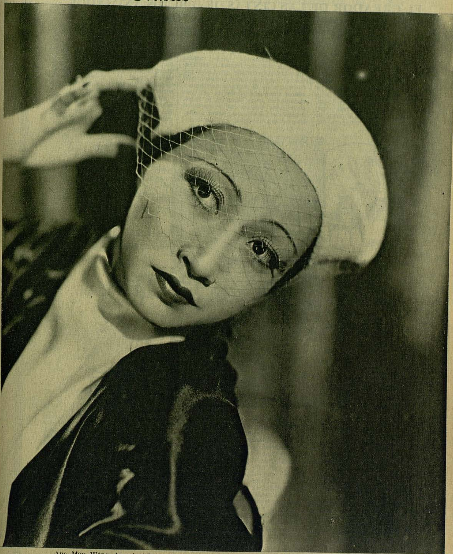
Ana May Wong, la oriental estrella del lienzo, contratada actualmente por la casa Paramount