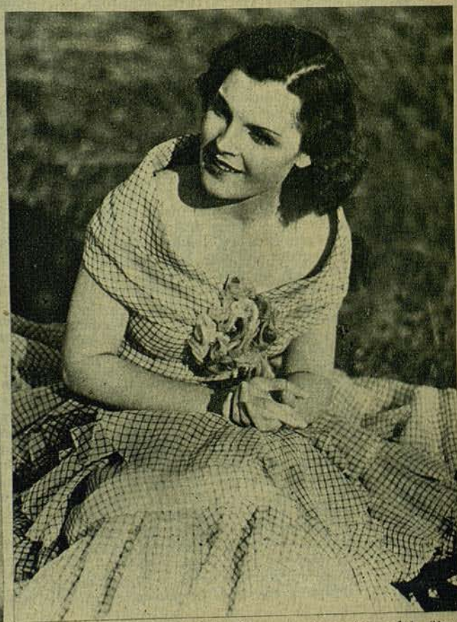
Magda Schneider, la deliciosa protagonista del film musical, «Noches en los bosques de Viena».