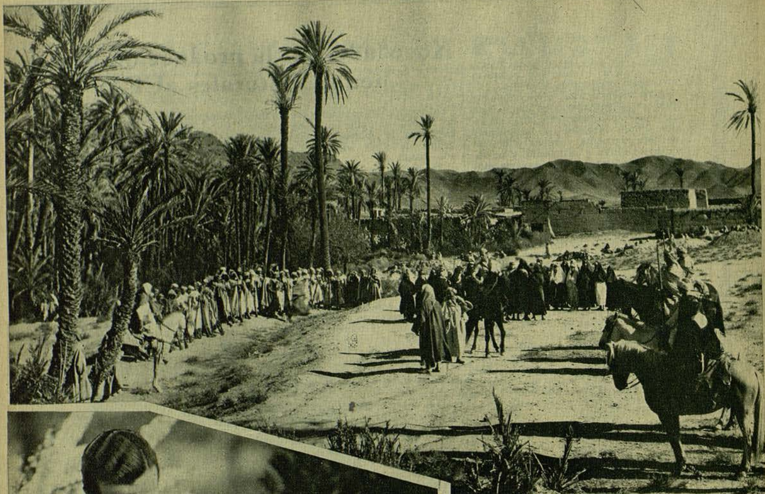
Una bella escena marroqui del film «Itto», que Jean Benoit rueda actualmente por cuenta de «Edén Productions».