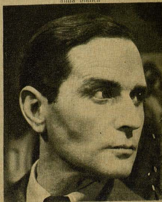
Pierre Blanchard, figura destacada de la «Ufa», estupendo intérprete de la película «1900»