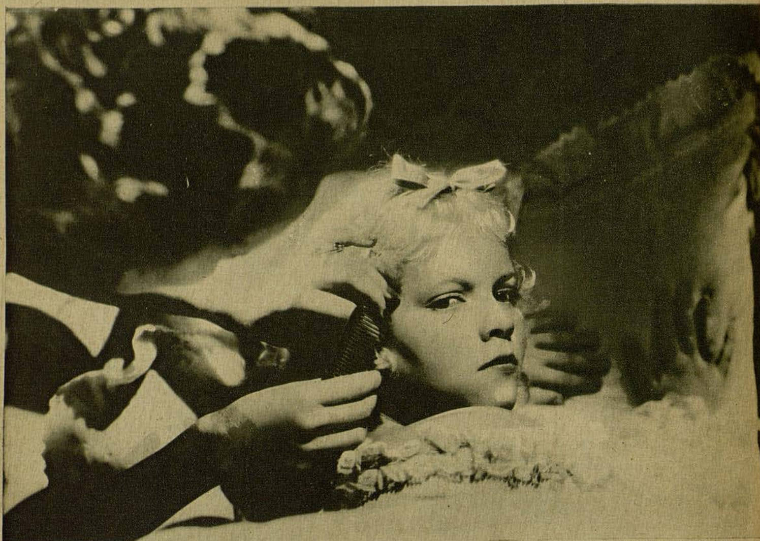
Una escena de la película de la Paramount «Capricho imperial», de la que es protagonista la genial Marlene Dietrich