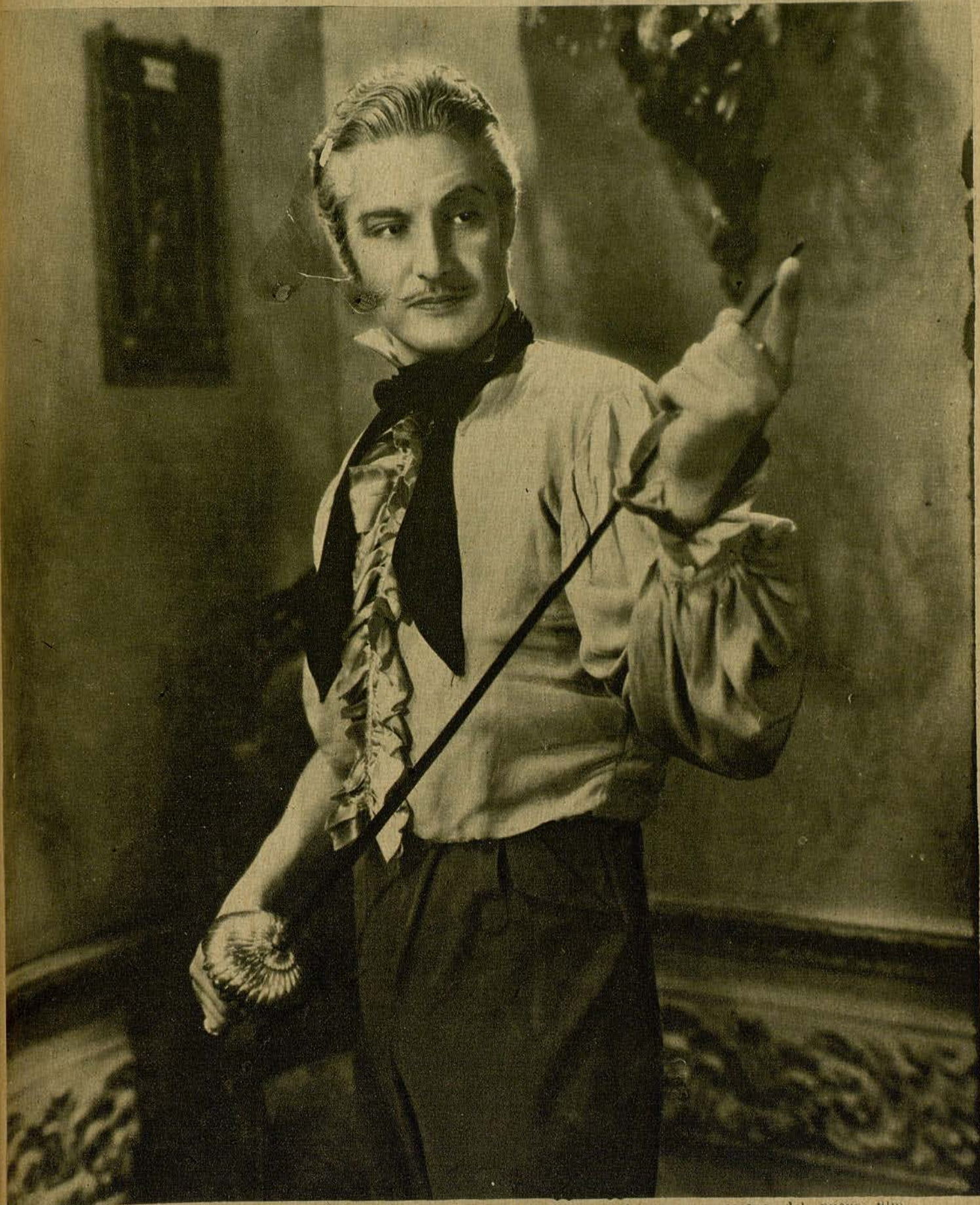
Robert Donat, una de las más prestigiosas figuras de los Artistas Asociados, en una escena del nuevo film «El Conde de Montecristo».