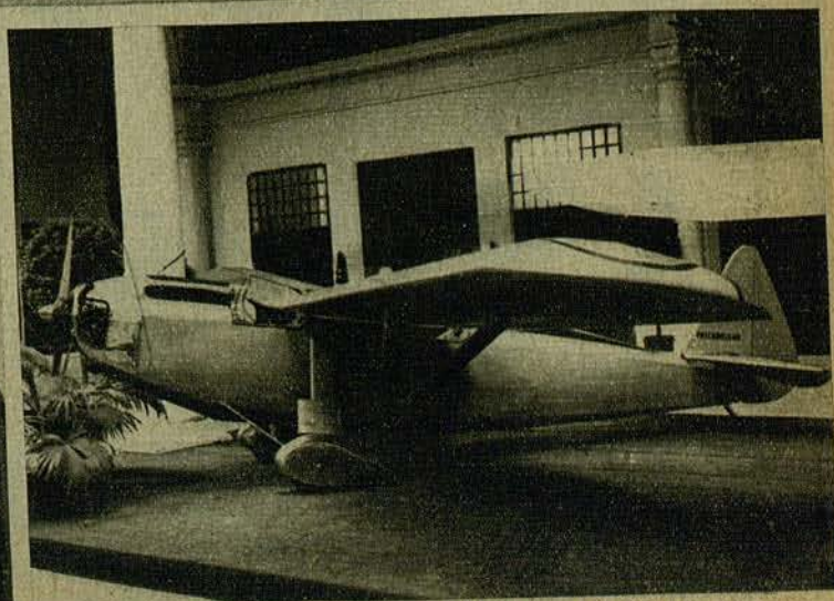
El célebre Avión de Turismo " PALLAROLS 40-A ", de construcción nacional, que puede adquirirse por el irrisorio precio de 8.000 pesetas y que constituye la atracción del Salón de Turismo y de los Deportes