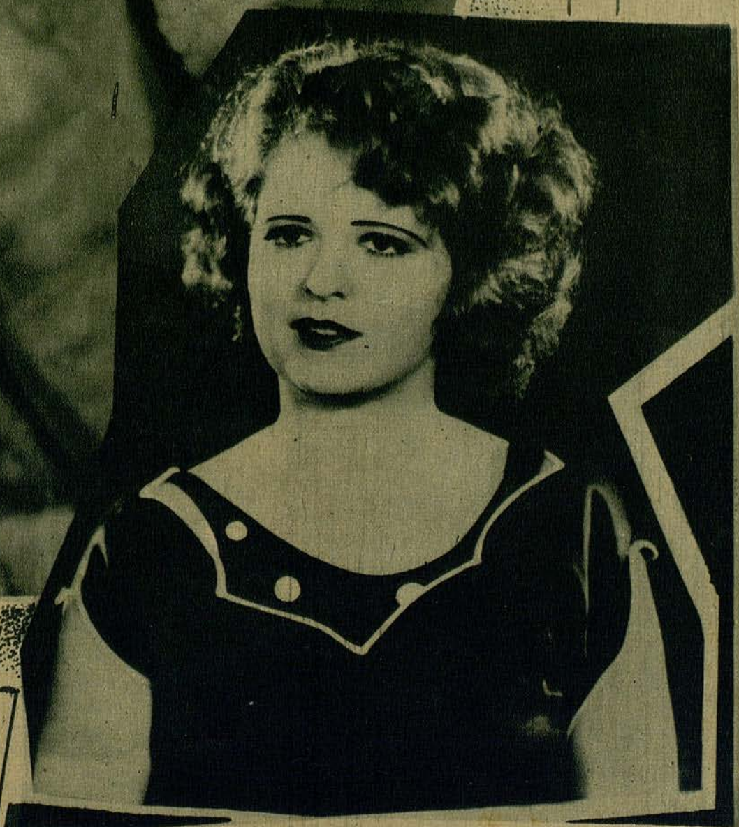
CLARA BOW, QUE EN BREVE CONTRAERA MATRIMONIO CON ARRY RICHMOND