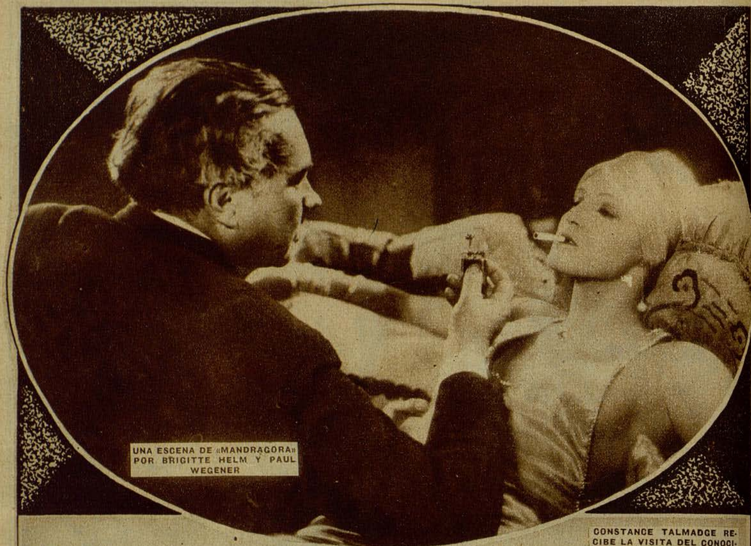
UNA ESCENA DE «MANDRÁGORA» POR BRIGITTE HELM Y PAUL WEGENER