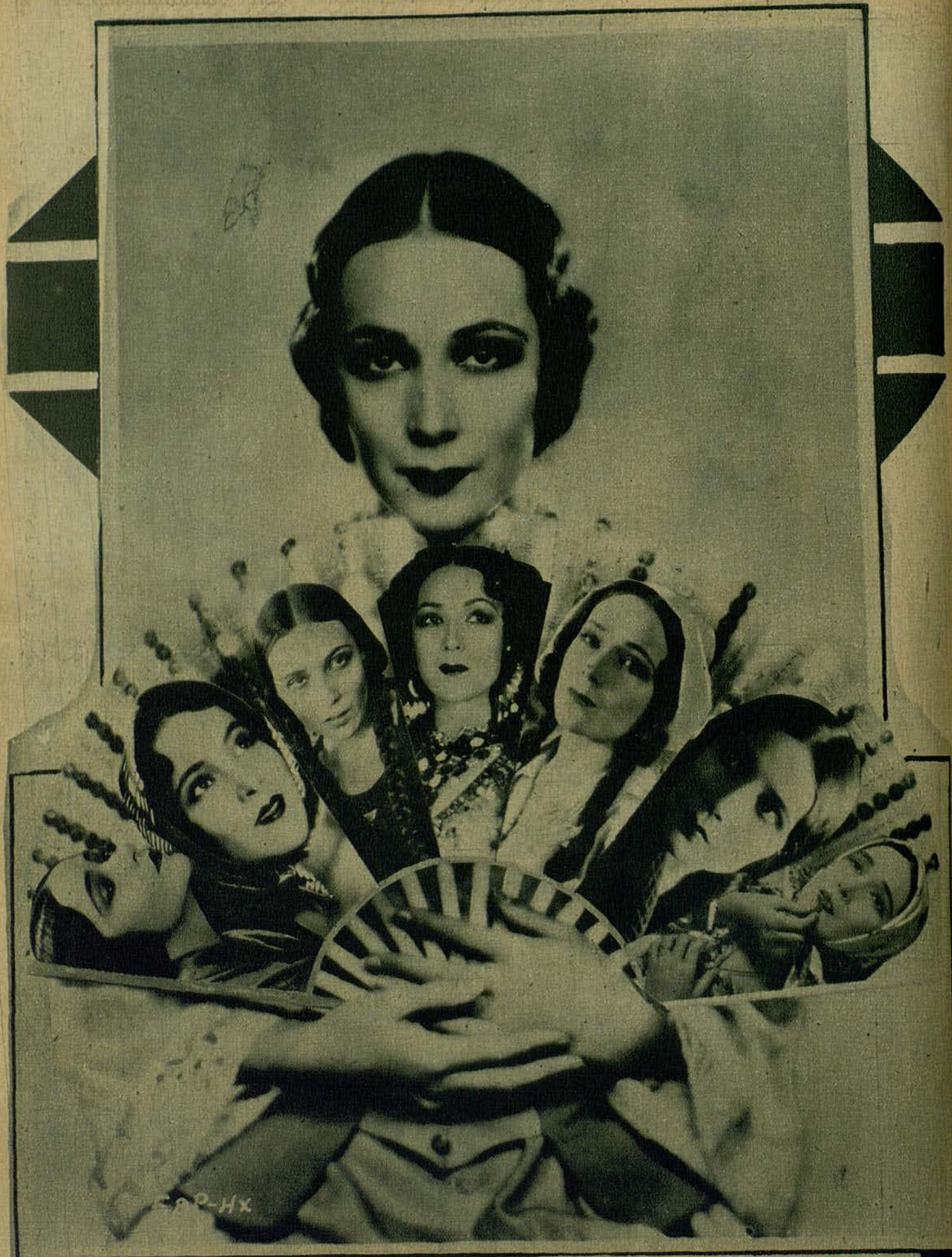
DOLORES DEL RIO EN VARIAS PELICULAS QUE HAN HECHO FAMOSO EL NOMBRE DE TAN GENIAL ARTISTA