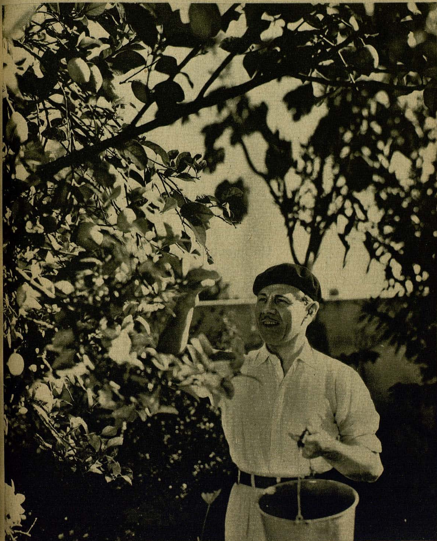
Charlie Ruggles, popularísimo actor cómico de la Paramount, en su casa de Beverly Hills, escogiendo los dorados frutos de un magnífico limonero.