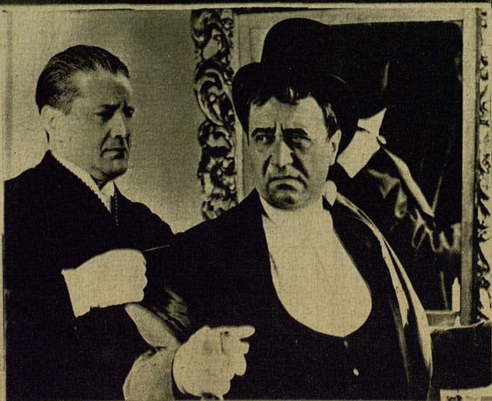
El gran actor cómico Raimu, en su nueva creación «Carlomagno».