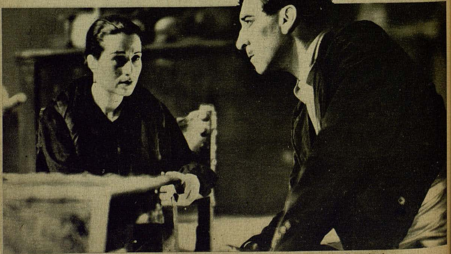
Marina Torres y Antonio Partago, destacadas figuras de la cinematografía nacional