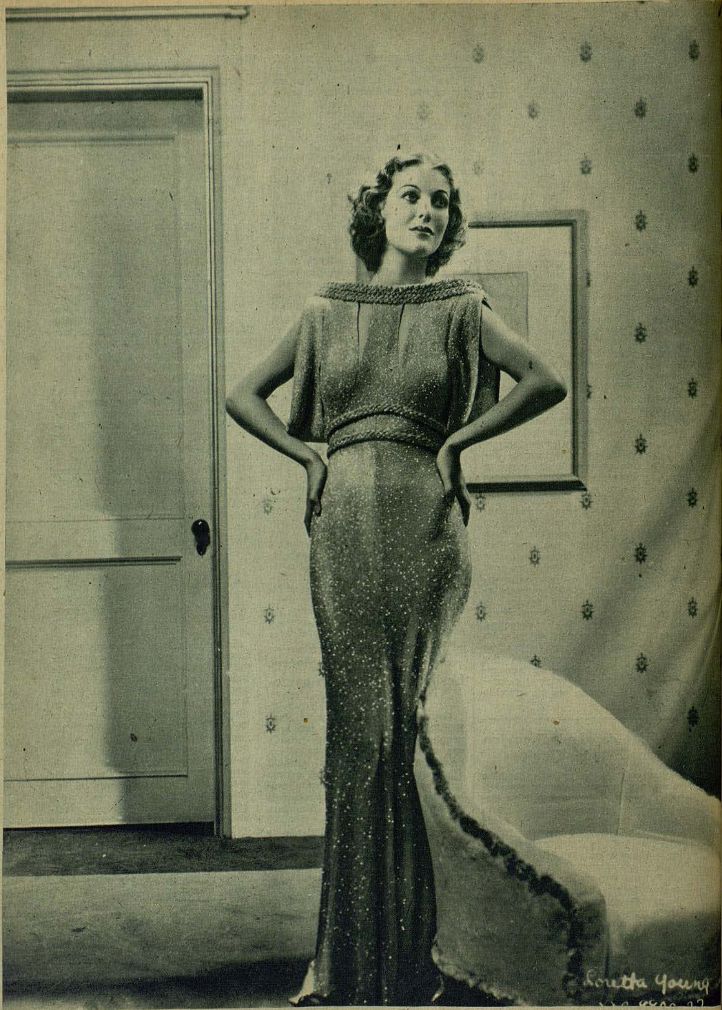
La sugestiva, celebrada y superhéroe estrella Loreita Young, de los Artistas Asociados