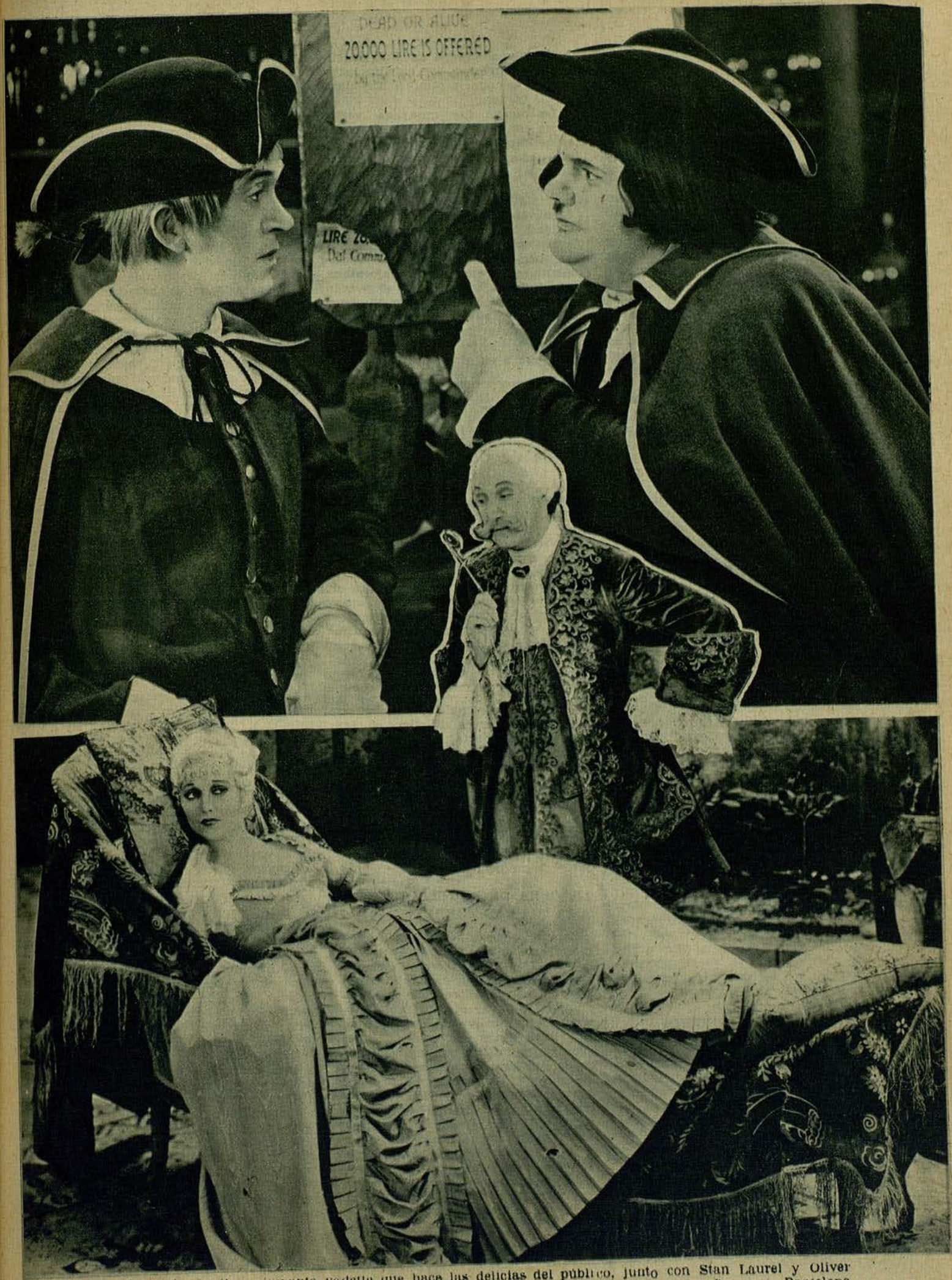
Thehna Todd, gentil y pimpante vedette que hace las delicias del público, junto con Stan Laurel y Oliver Hardy, en una escena de «Fra Diavolo», producción M. G. M., que se estrenará en breve en Barcelona