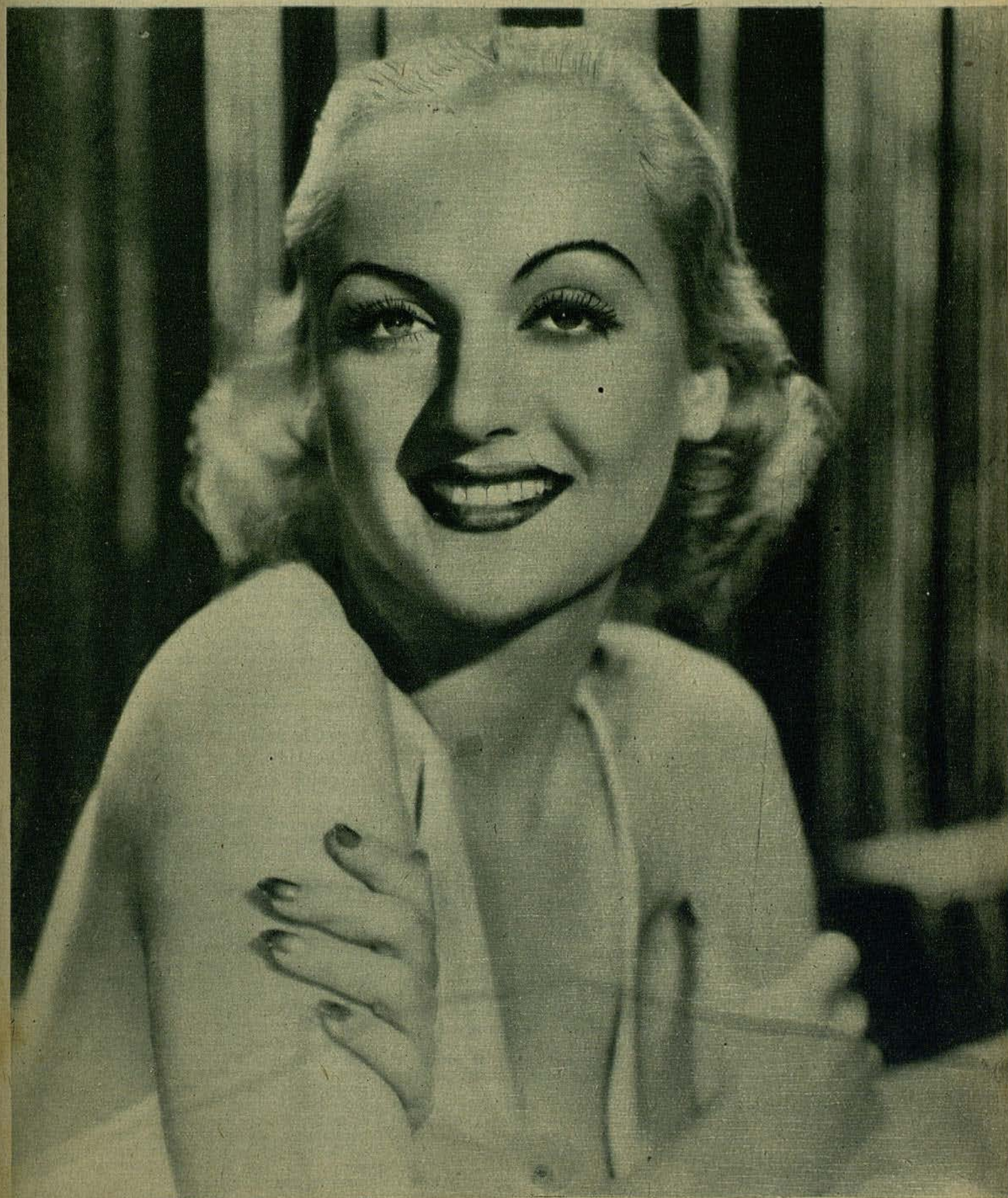
Carole Lombard, bellísima y gentil star de la Paramount