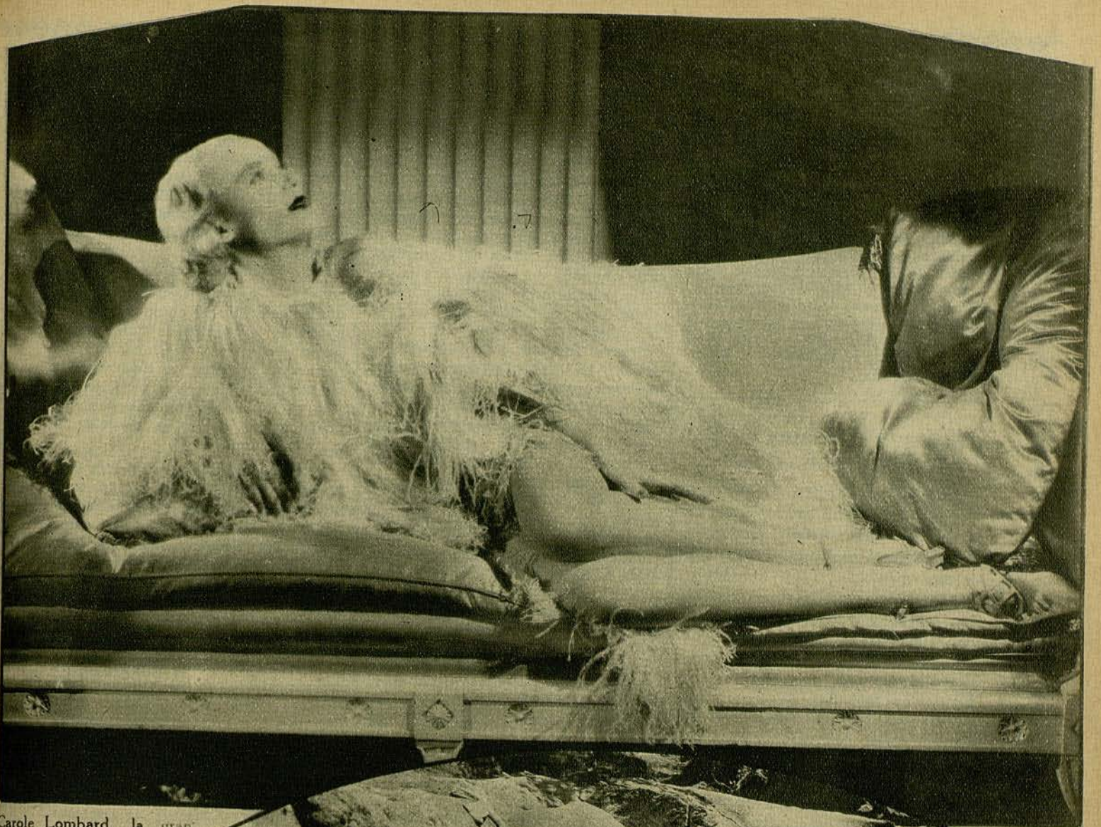
Carole Lombard, la gran actriz de la Paramount en una sugestiva po- se que realza su belleza