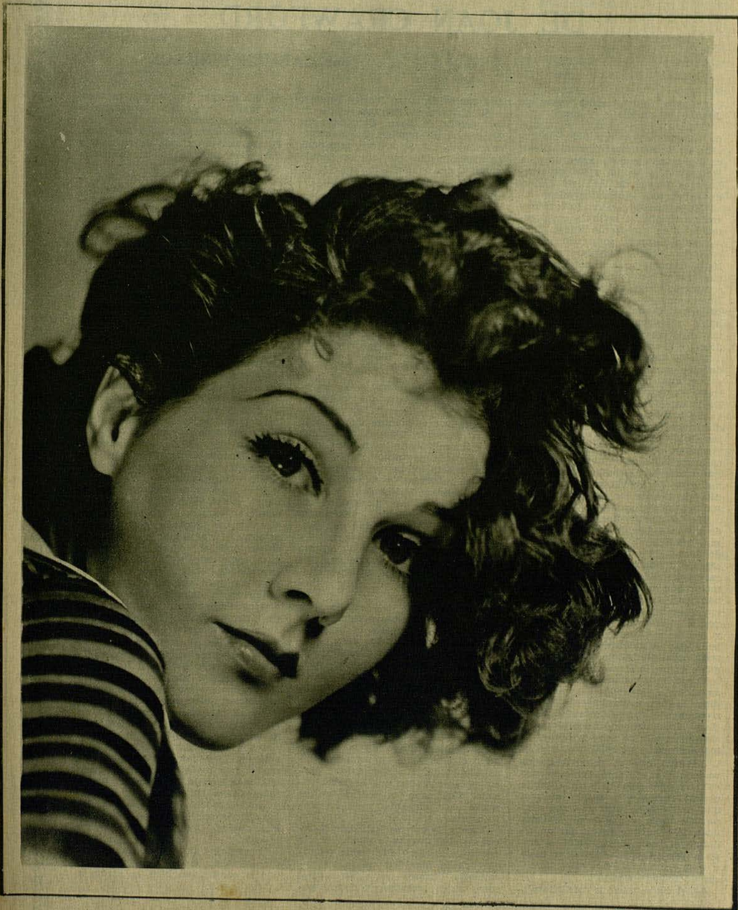
JEAN PARKER. bella ingenua de la M. G. M., que camina a pasos agigantados hacia el estrellato, y a quien veremos pronto en varias cintas