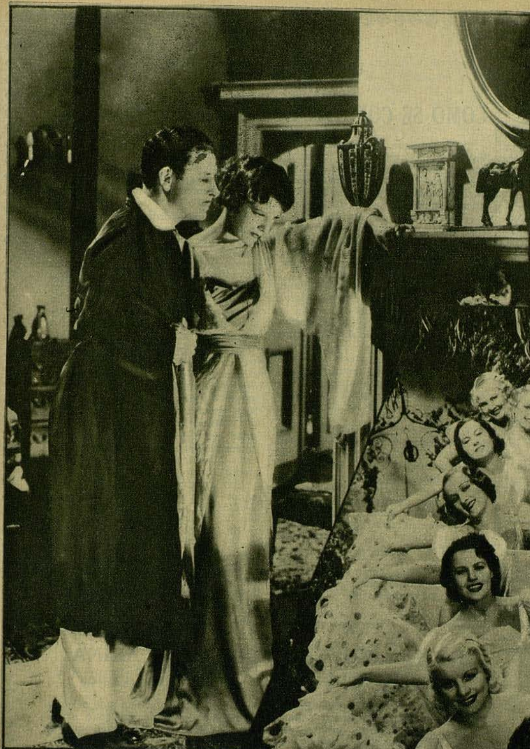
Ronald Colman y Elisa Landi, en una escena de «Tras la máscara», film en el que, según dicen, Ronald Colman realiza una de sus más grandes creaciones