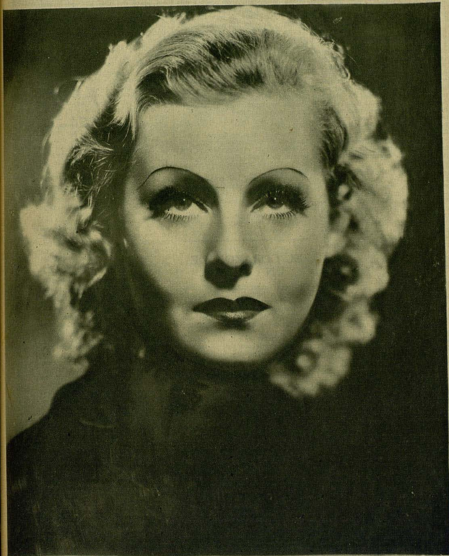
Lilian Harvey, la bellísima y excelente actriz alemana, que actualmente se halla en los estudios de la Fox, filmando varias cintas para dicha casa productora