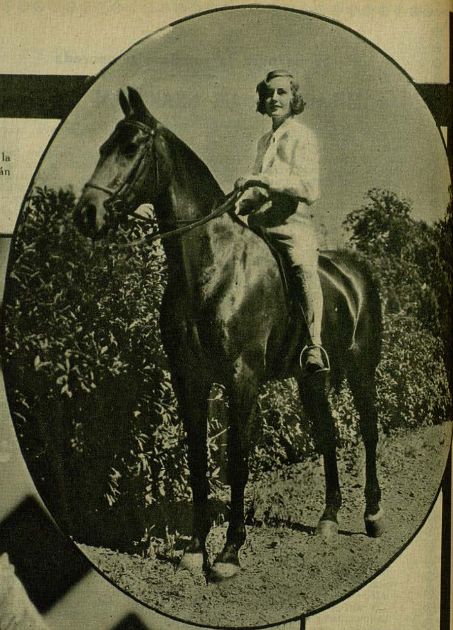
Madge Evans, linda actriz de la M. G. M., montada en su alazán favorito