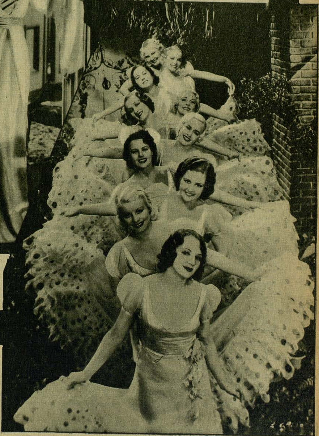
Un grupo de guapísimas girls, que aparecen en el divertido film de Eddie Cantor, «Torero a la fuerza»