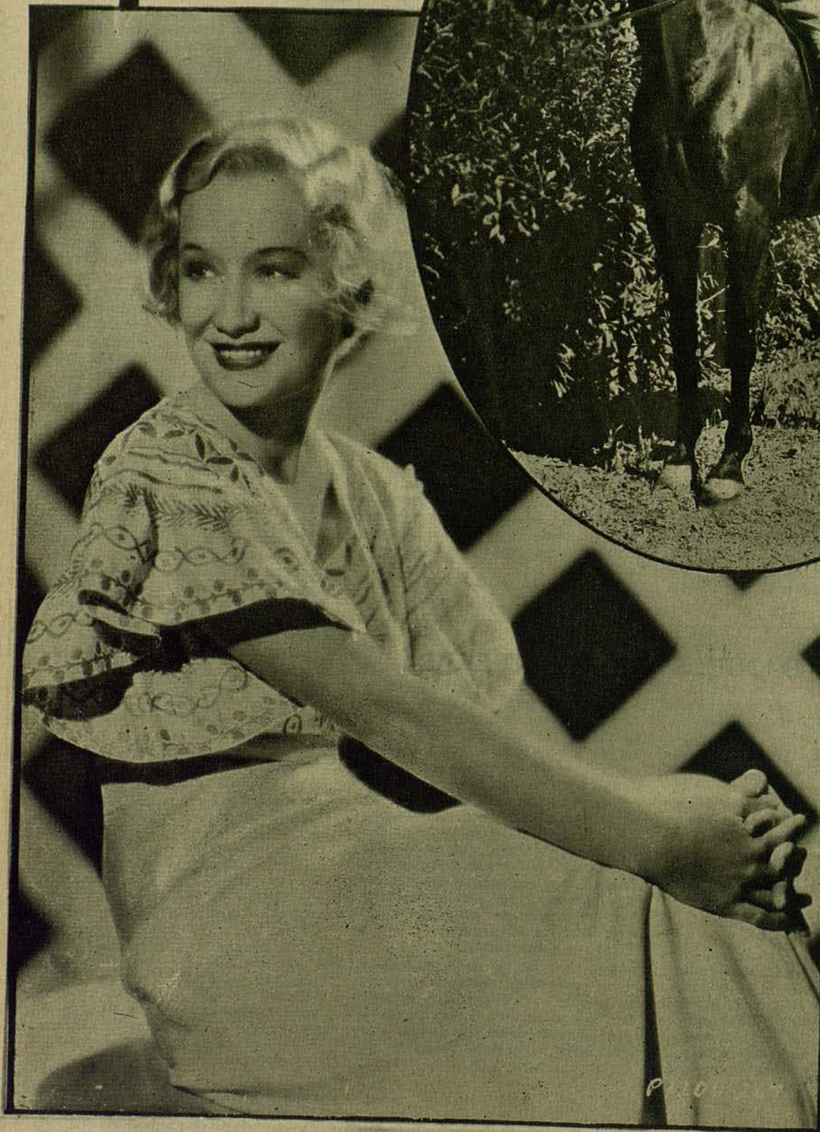
La rubia Miriam Hop- kins, estrella de la Paramount