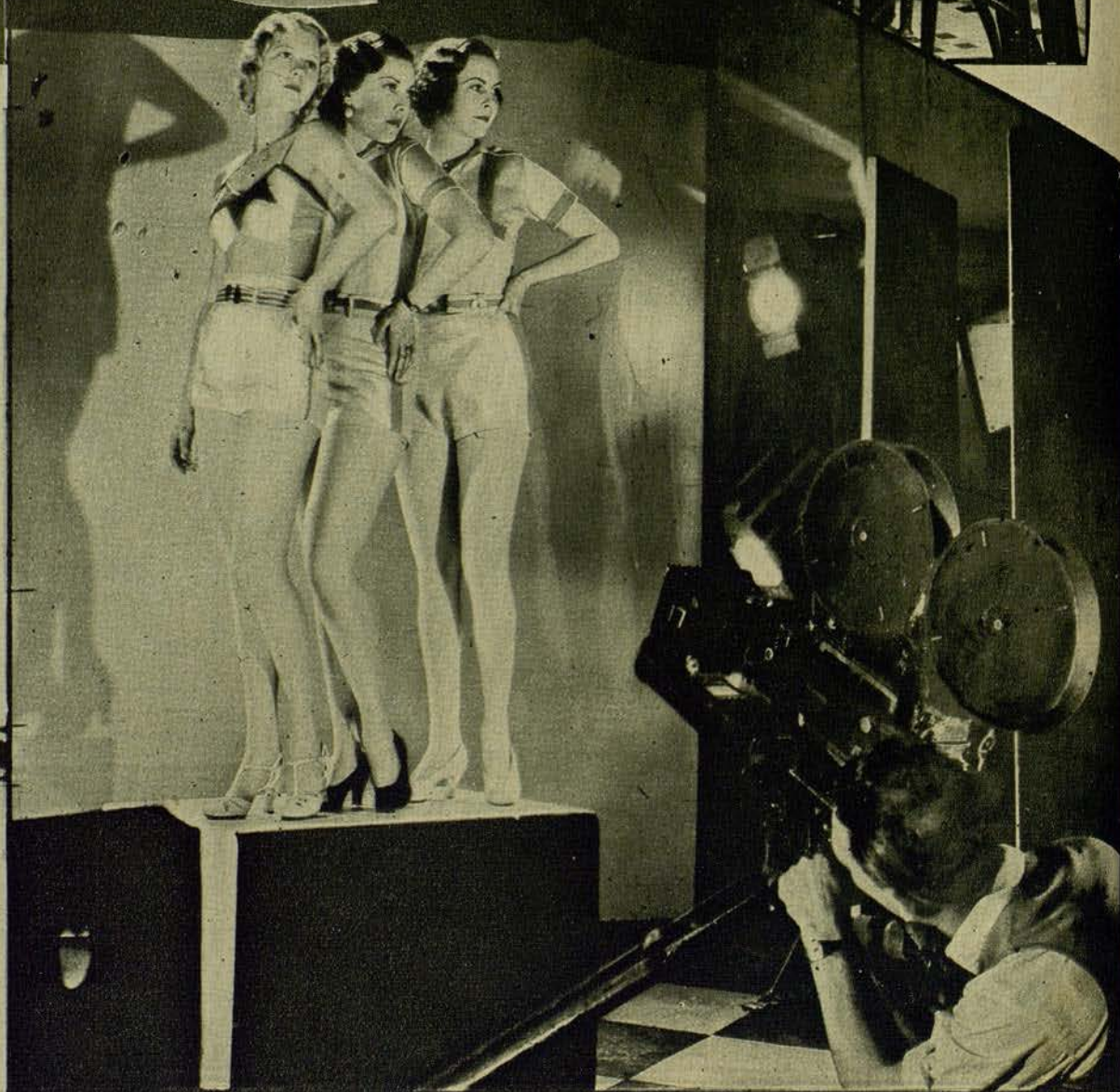
Tres bellísimas coristas que aparecerán en una próxima cinta de la M. G. M., posan ante el operador