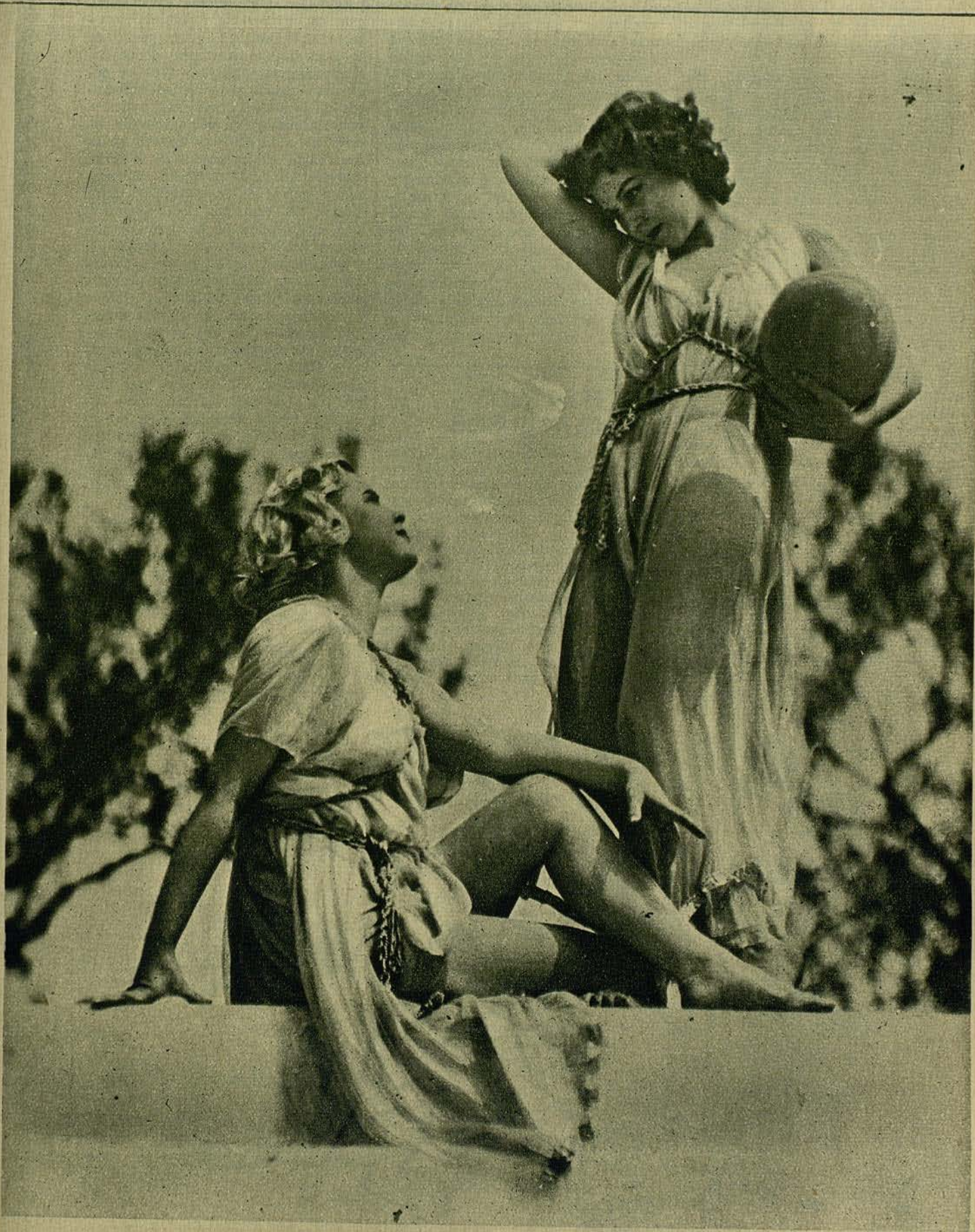
Interesante y artístico estudio fotográfico de JEAN PARKER y MARY CARLISLE, bellísimas «stars» de la Metro Goldwyn Mayer