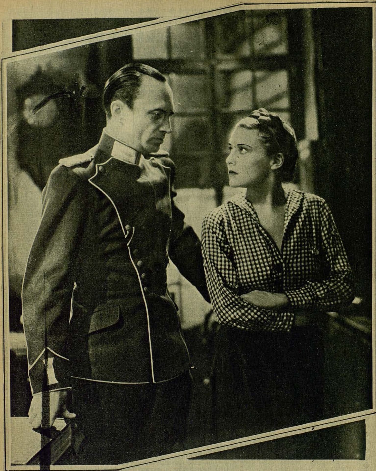
Madeleine Carroll y Conrad Veidt, en una escena del film «Yo he sido espía», que acaba de rodarse en los estudios de la Gaumont-British