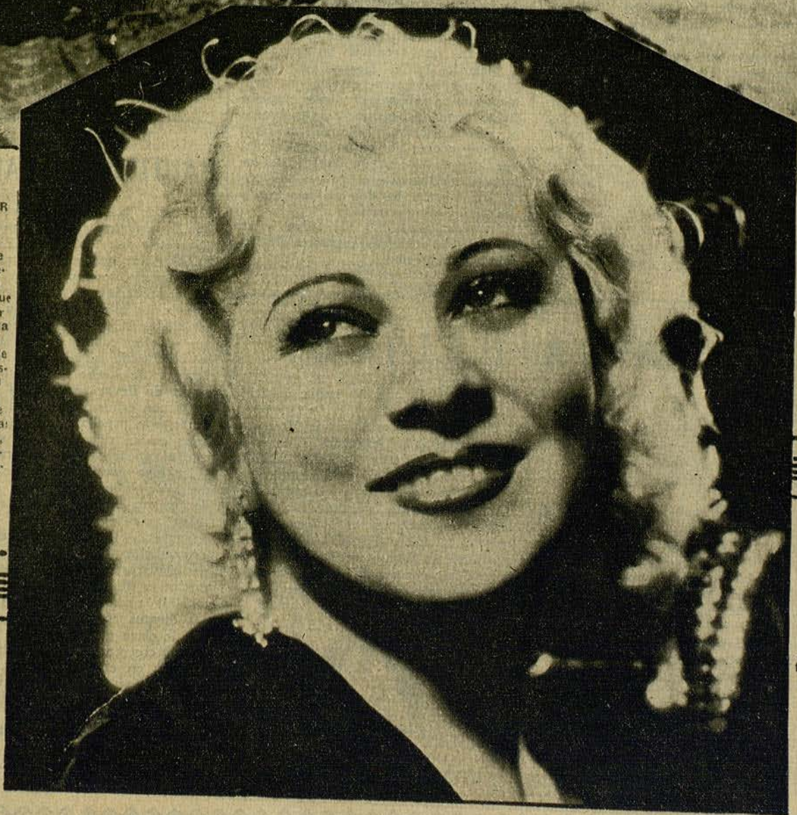
MAE WEST, -a hermosa y sugestiva artista que hace poco ha ingresado en las huestes de la Paramount

en una escena de la graciosísima película «Britannia de Billingsgate», que se acaba de filmar en los estudios de la Gaumont-British» bajo la dirección de Sinclair Hill. En este film alcanza el divertido Gordon Harker, intérprete sin rival de las obras de Edgar Wallace, uno de sus mayores éxitos cinematográficos