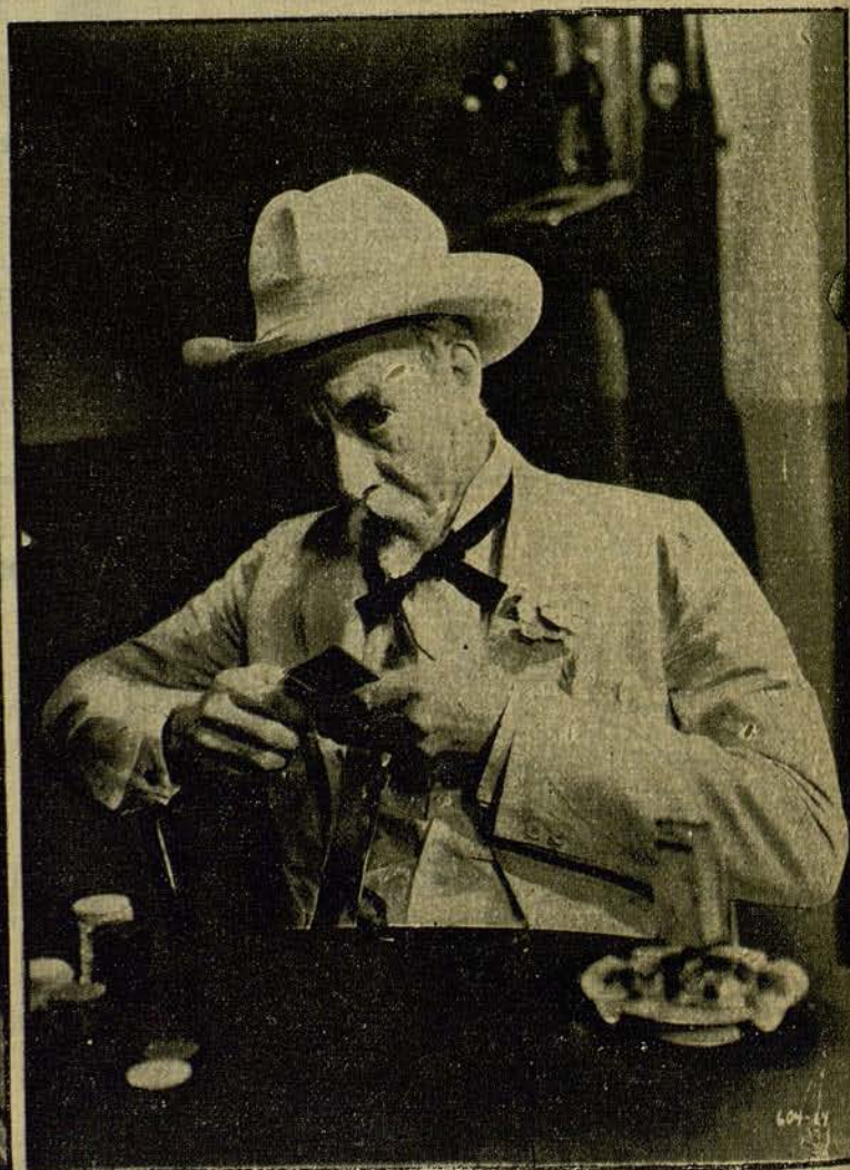
«Alcohol prohibido», una alegata contra el alcoholismo y la ley seca, con Dorothy Jordan, Lewis Stone, Neil Hamilton, Robert Young, Walter Houston, Jimmy Durante, Wallace Ford, Myrna Lox, Joan Marsh, John Miljan. - Producción Metro Goldwyn Mayer