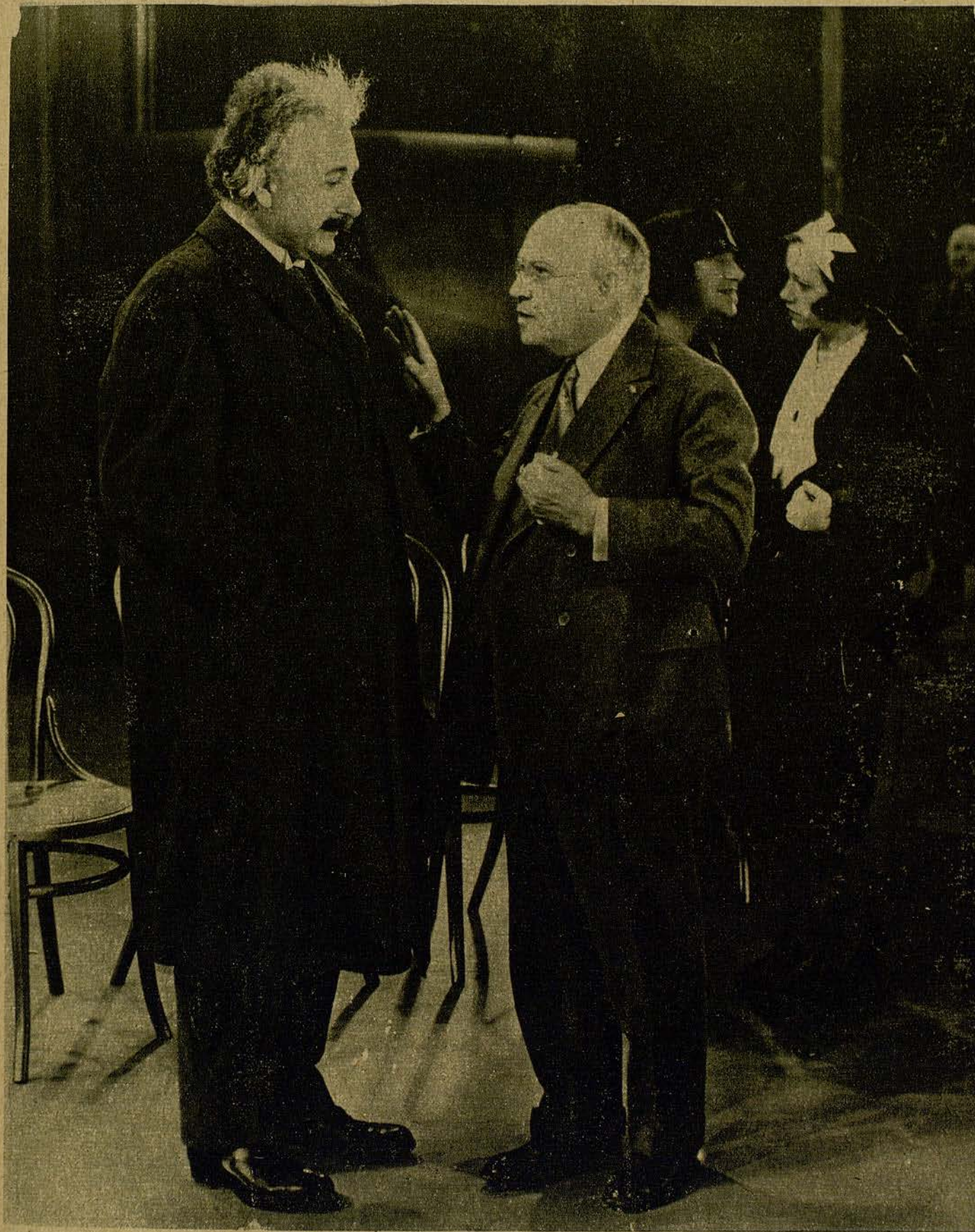
El sabio profesor Eisenstein, es recibido por Carl Laemle durante la visita que hizo a los estudios de la Universal