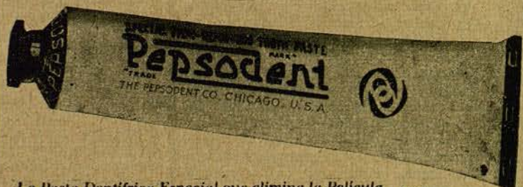
La Pasta Dentífrica Especial que elimina la Película 5015

Use Pepsodent dos veces al día — Vea a su dentista dos veces al año