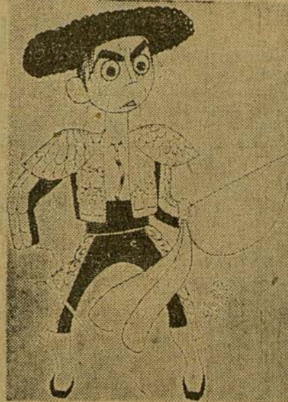
EDDIE CANTOR en "Torero a la fuerza" (Visto por el caricaturista cubano Conrado Massaguer)

lete de chispeantes fuegos artificiales. Eddie Cantor interpreta esta es-