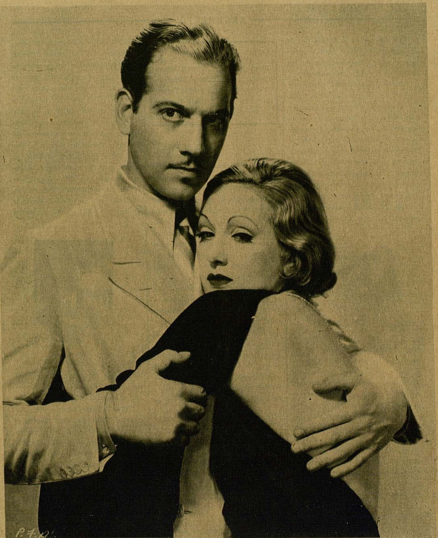
MELVIN DOUGLAS Y TALA BIRELL

de la Universal, dos artistas muy queridos por nuestro público, después del estreno del gran film «Nagana». Tala Birell aparece en la fotografía en una de las escenas más emocionantes de la citada película. Busca el amparo de Douglas cuando, presa de horrible pánico, recuerda la peligrosa acometida de las fieras