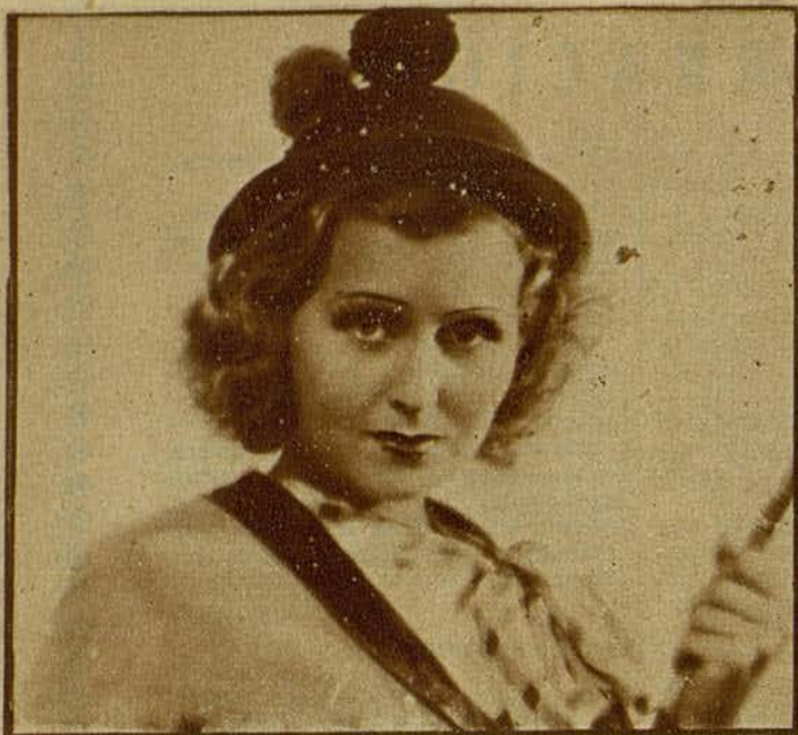
La bella actriz Lillian Harvey, que tanta fama logró en los estudios alemanes, y que ahora se ha trasladado a Hollywood. Esta fotografía pertenece a una de sus últimas y más deliciosas interpretaciones que realizó en Europa por cuenta de la marca alemana Ufa