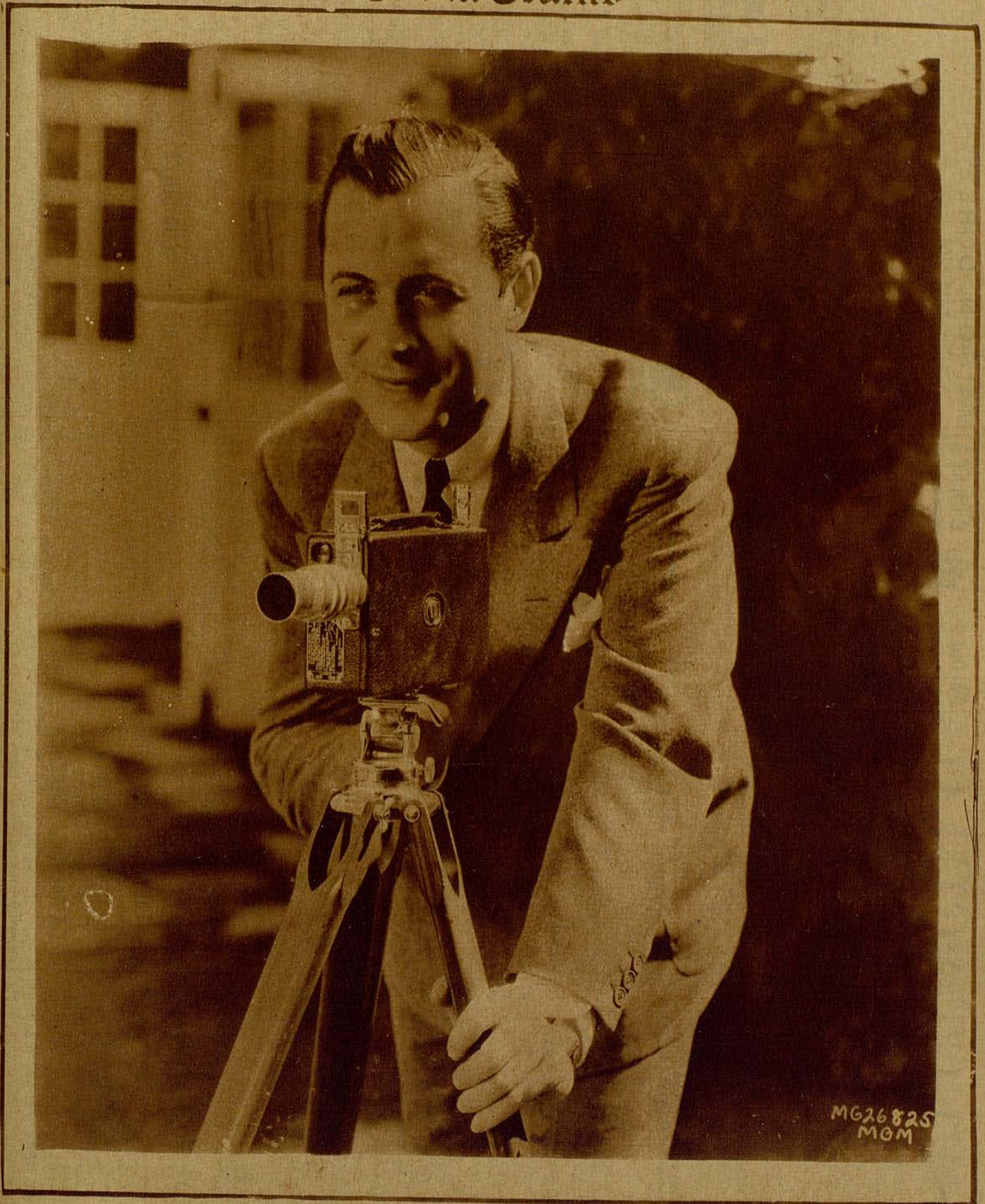
Robert Montgomery, artista de M. G. M., se entusiasma con la fotografía dentro y fuera del Estudio