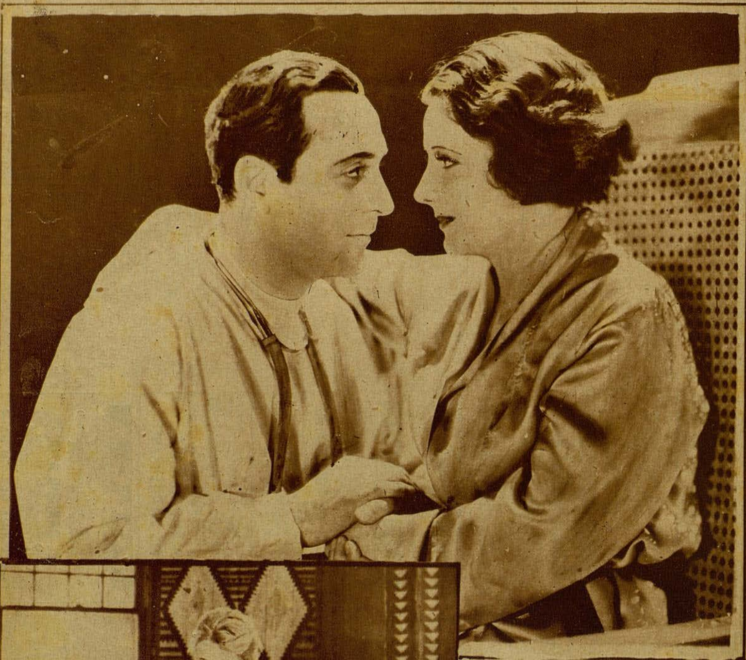
Irene Dunn y Ricardo Cortez, en una escena del film «La melodía de la vida», película S. I. C. E.—R. K. O.