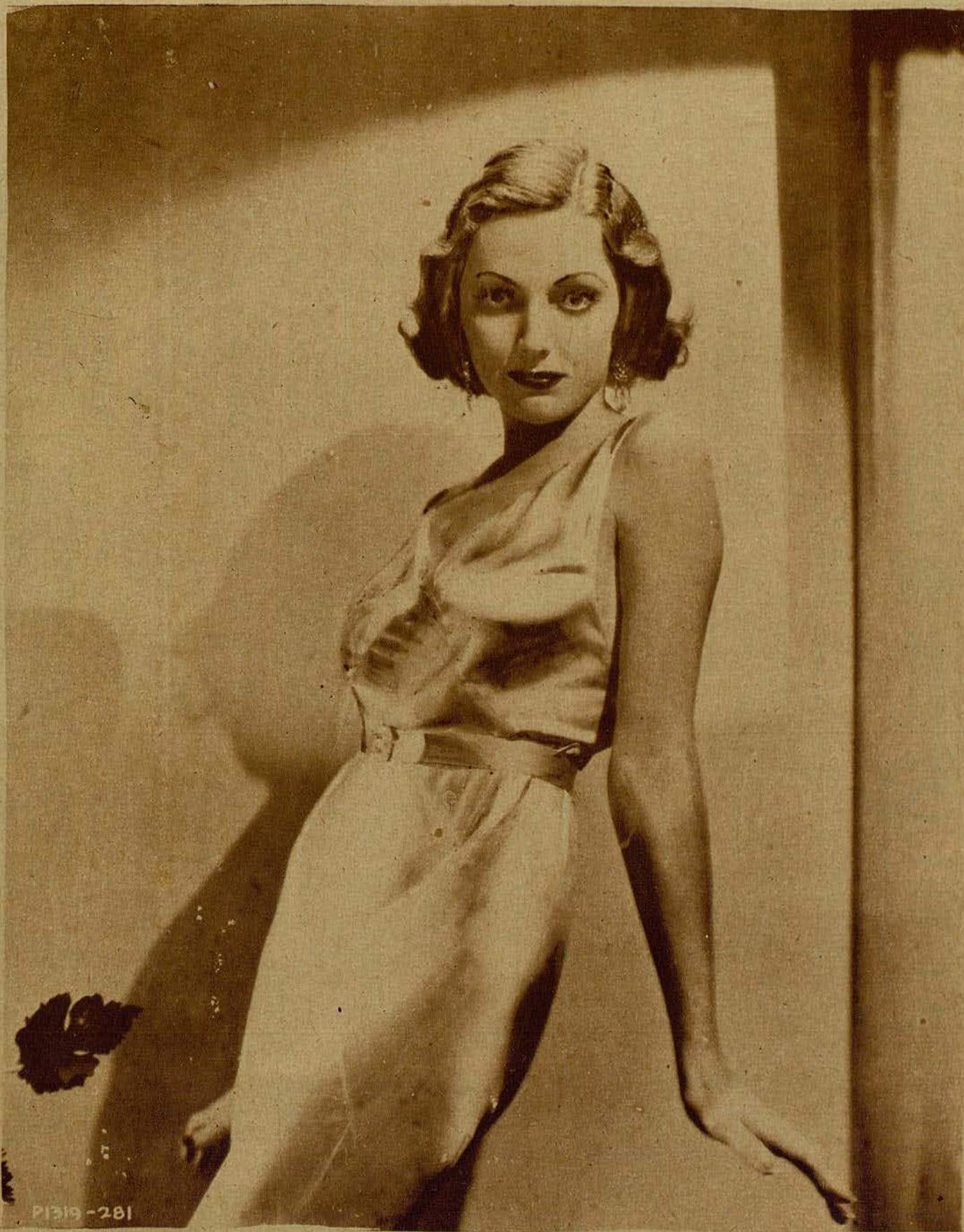
Adrienne Ames, descubierta por la Paramount para gloria y prosperidad del cine sonoro