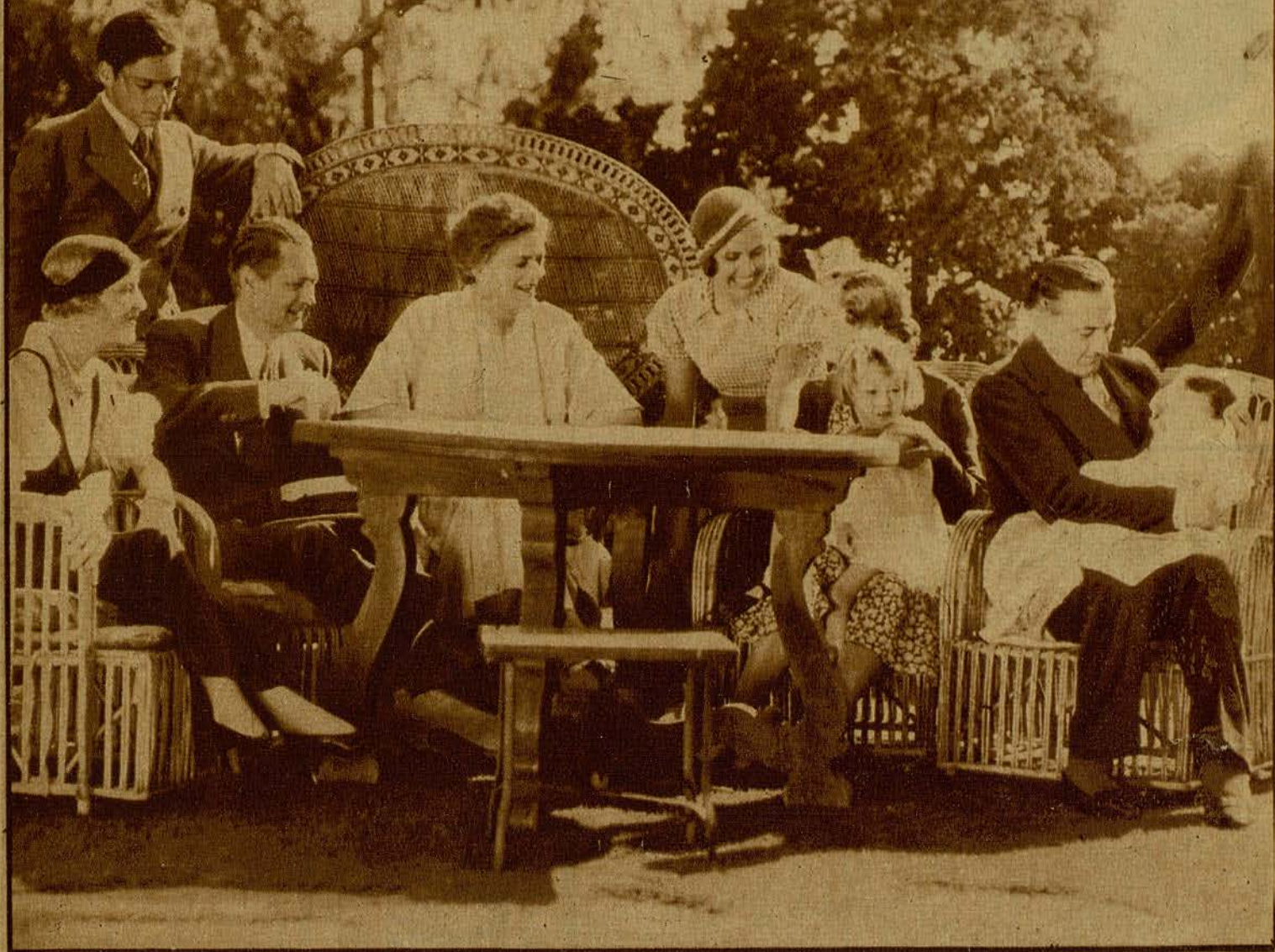
LOS BARRYMORE REUNIDOS