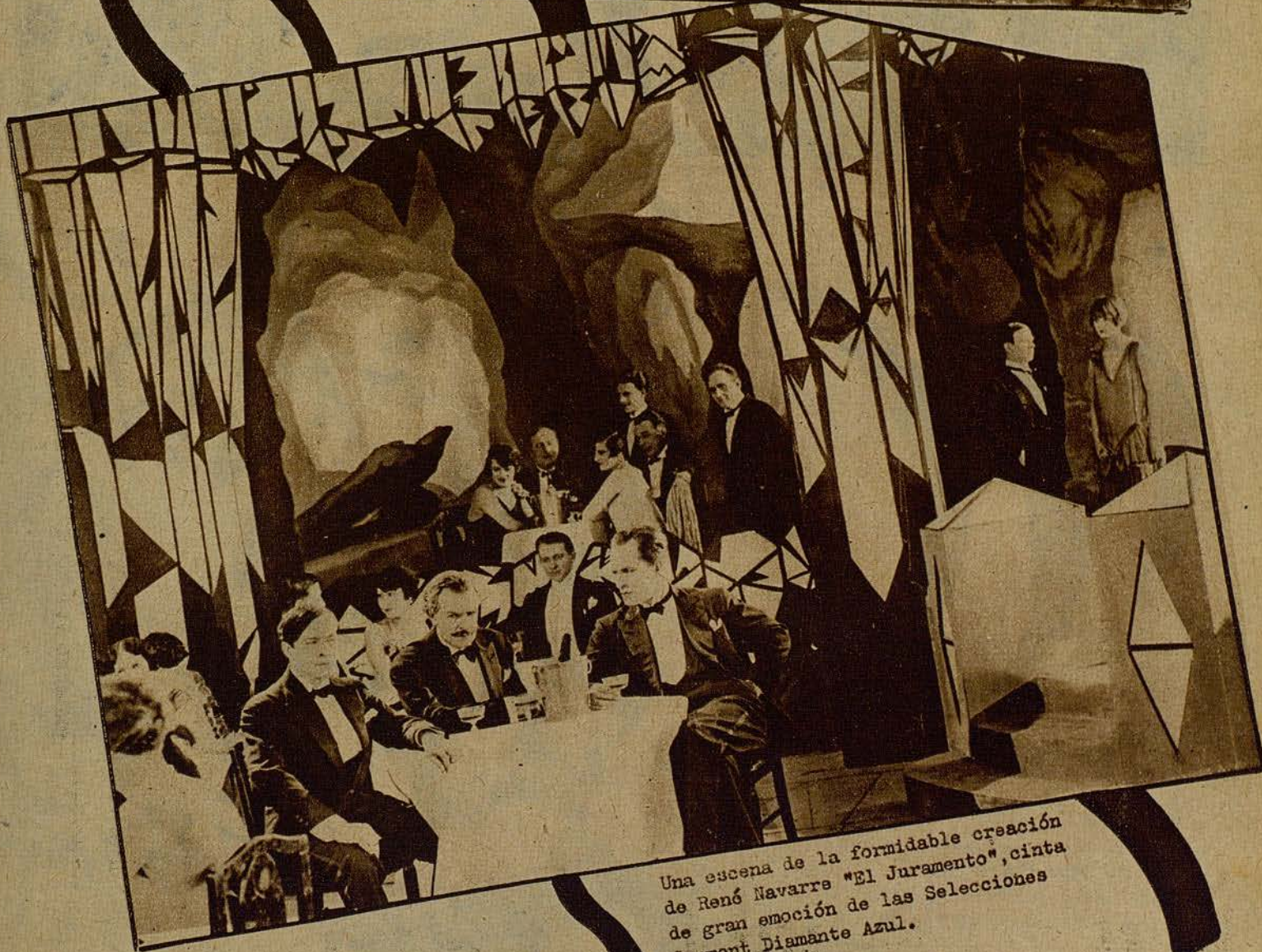
Una escena de la formidable creación de René Navarre "El Juramento", cinta de gran emoción de las Selecciones Gaumont Diamante Azul.