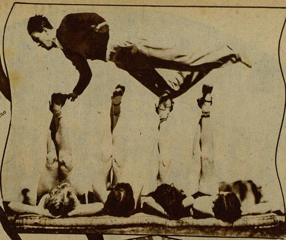
El conocido artista de cine Eddie Nugent ensayando un salto tan curioso como difícil.