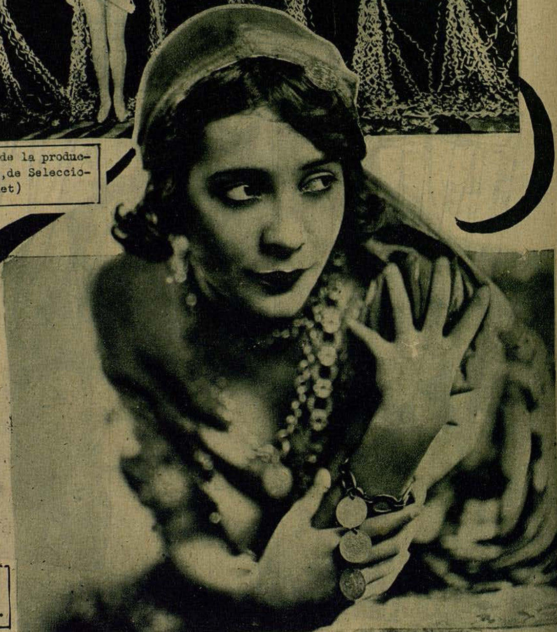
La nueva estrella mejicana Delia Magana, que ha ingresado en los estudios de la Fox Film.