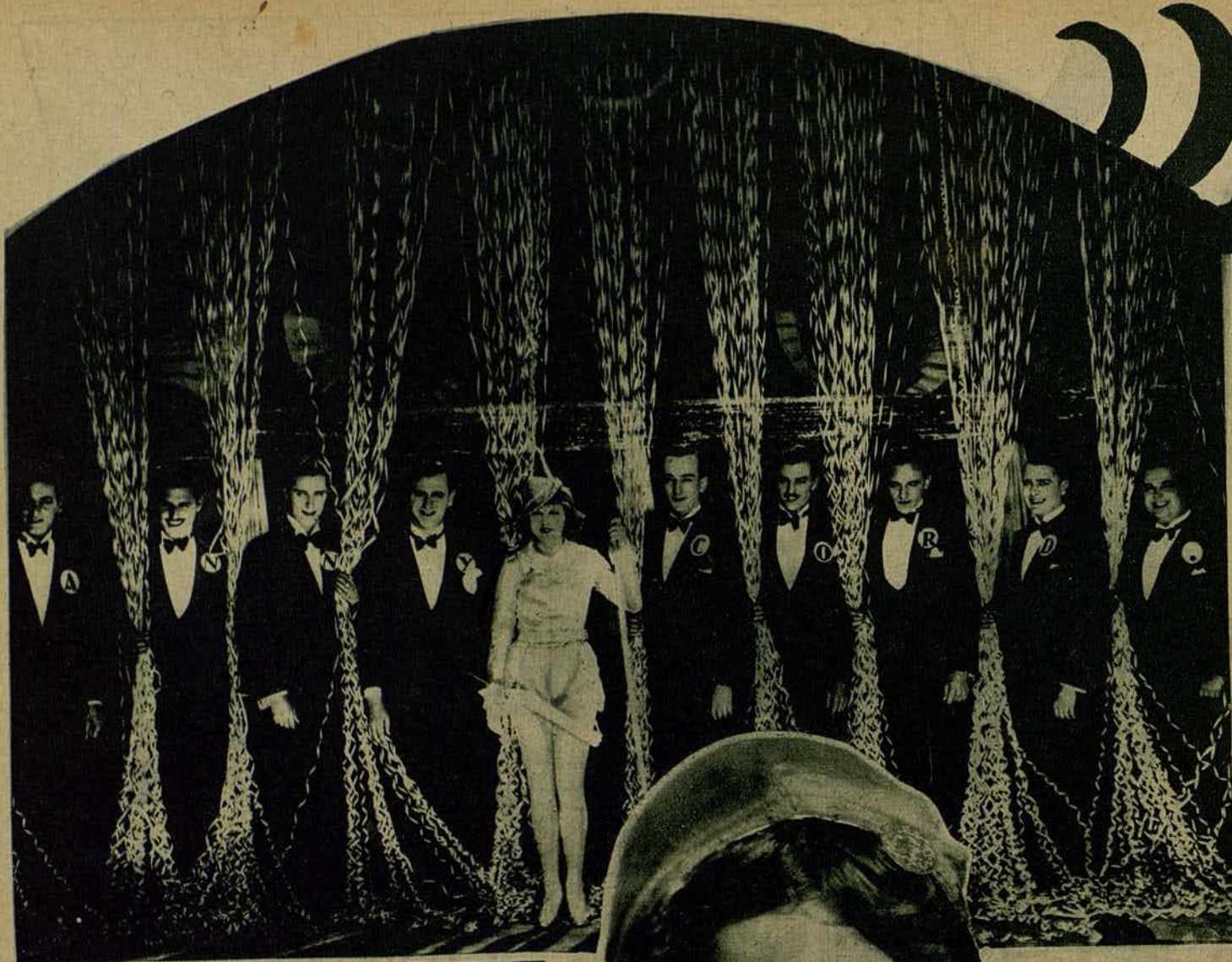
Una sugestiva escena de la producción "El primer beso", de Selecciones Capitolio (S. Hugué)