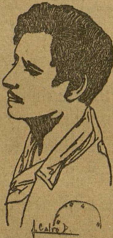
RONALD COLMAN

fica originó el derrumbamiento de las acciones del Banco Universal. Saccard estaba literalmente aplastado, cuando recibió un telegrama cifrado de Mazaud, anunciándole que Hamelin había, en efecto, aterrizado en inmejorables condiciones, en Guyana, pero que las noticias oficiales se había retrasado. El primer movimiento del financiero fué lanzar la noticia a los cuatro vientos, más pensándolo mejor, optó por callarse para aprovecharse de la baja experimentada y volver a comprar sus acciones a un precio muy ventajoso.