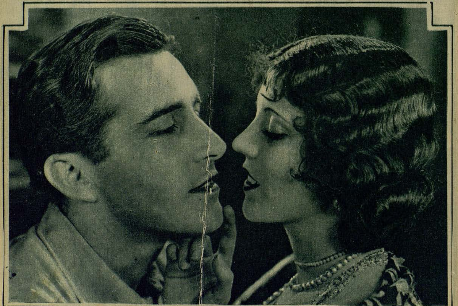
OLIVE BORDEN Y JOHN BOLES, EN UNA BELLA ESCENA DEL FILM COLUMBIA ... UNA MUJER