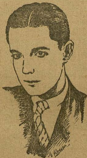
RAMON NOVARRO (por Emilio Beura, de Llagostera)

tacan: un soberbio contrato con la Paramount para «rodar» películas sonoras, ya que la citada artista es una enorme adquisición para cumplir a maravilla dicho cometido. Ninguno de ustedes ignora que miss Olga fué actriz de ópera del Teatro Imperial, de Moscov.