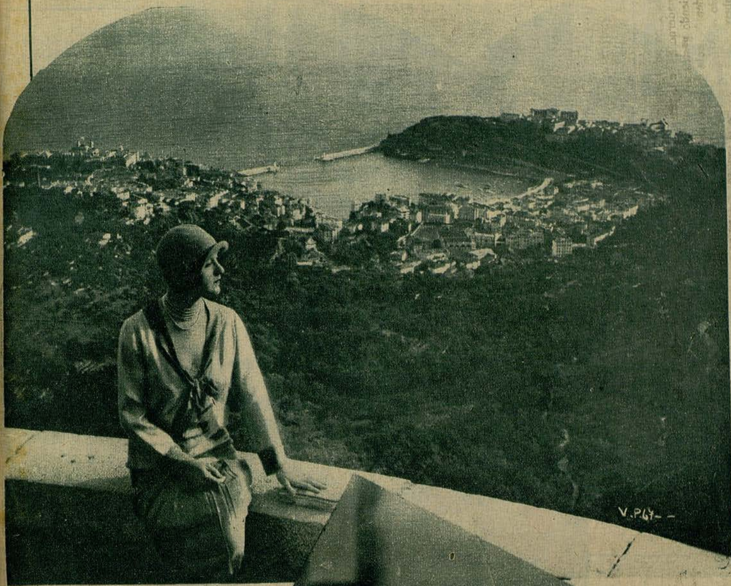
UNA INSTANTANEA DE CONSTANZA TALDMADGE, TOMADA EN MONTE CARLO, DESPUES DE LA IMPRESION DEL FILM «VENUS», DE LOS ARTISTAS ASOCIADOS