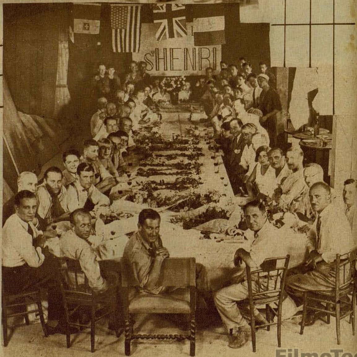
REX INGRAM, PRESIDENDO UNA FIESTA QUE SE CELE- BRO EN SU HONOR, EN LOS ESTUDIOS DE NIZA