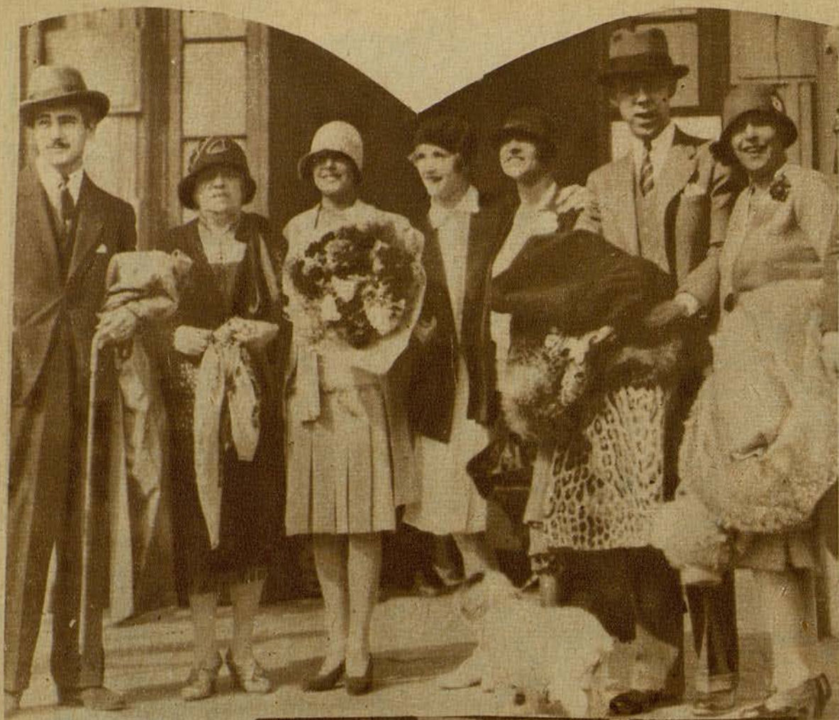
NORMA Y CONSTANCIA TALMADGE Y LUIS ALON- SO, A SU LLEGADA A PARIS