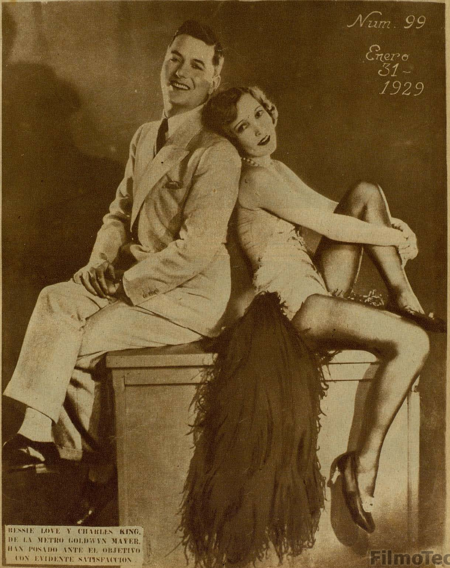
BESSIE LOVE Y CHARLES KING, DE LA METRO GOLDWYN MAYER, HAN POSADO ANTE EL OBJETIVO CON EVIDENTE SATISFACCION.