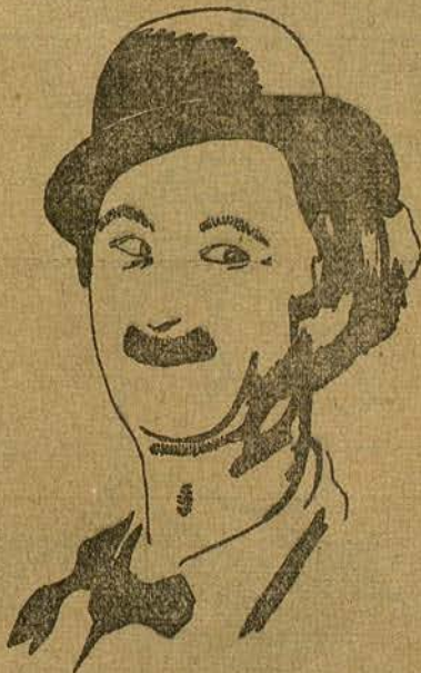
BEN TURPIN (por Carmen Cabré F. de Barcelona)

encabezan estas líneas, habrán admirado el formidable y maravilloso trabajo de trapecios volantes que en la primera tienen que ejecutar Jennings, Lya de Putti y Marwick Ward, papeles que fueron, naturalmente, doblados por el trío trapecista más formidable que existe en el mundo: los tres Codona, dos hombres y una mujer, trío conocido en Barcelona por haber actuado en un famoso coliseo de ésta.