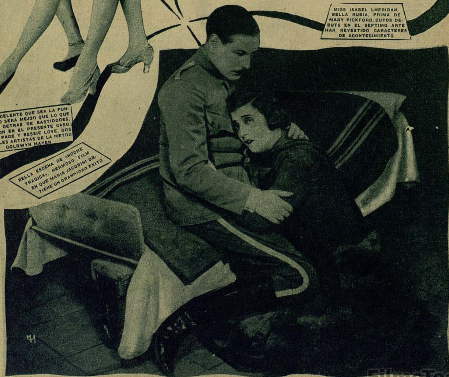
BELLA ESCENA DE "NOCHE TRAGICA", HERMOSO FILM EN QUE MARIA JACOBINI DE- TIENE UN GRANDIOSO EXITO