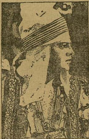
RODOLFO VALENTINO (por Enrique Suñé Bullich de Barcelona)

horrible, que según se decía había inventado un monje llamado Aven-More, o al menos, así se decía.