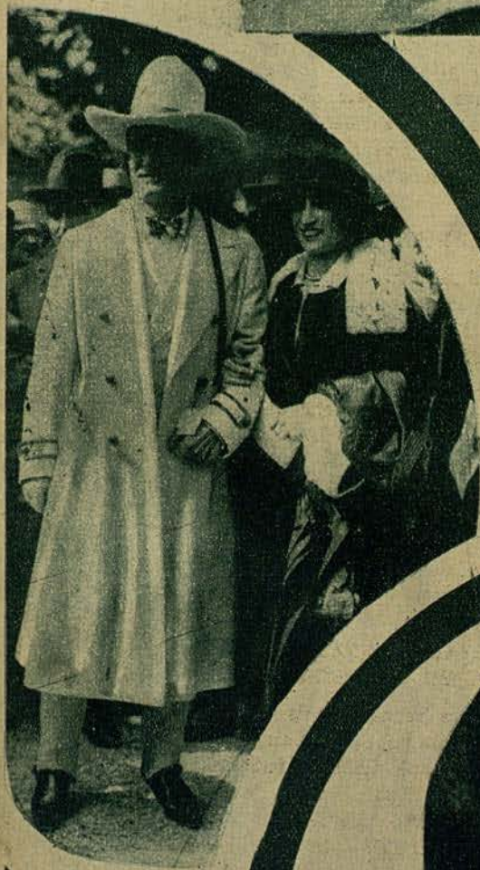
COMO SE LAS COMPONE EL POPULAR TOM MIX PARA PASAR DESAPERCIBIDO