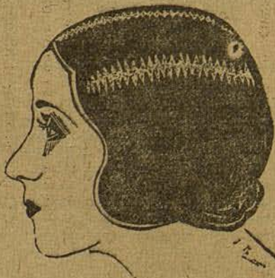
DOLORES DEL RÍO (por José Farreras de Sitges)

ta, que no puede negar por su «gancho» que es andaluza.