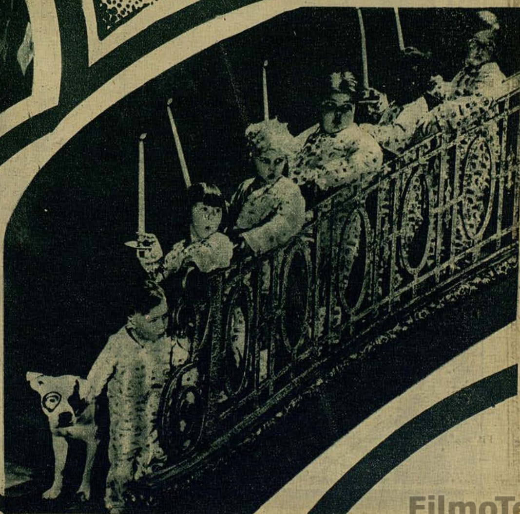
LA «PANDILLA», DE LA METRO GOLDWYN MAYER, SE DIRIGE, EN PERFECTA FORMACION, A VER LO QUE LES HA TRAIIDO PAPA NOEL