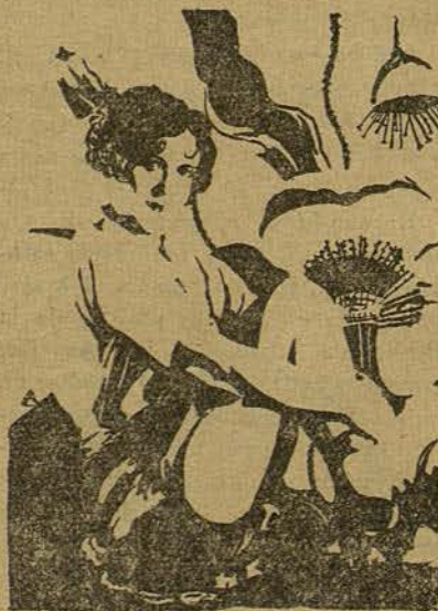
NANCY CARROLL

nuevamente organizada Corporación Radio - Beth - Orpheum. La nueva Compañía está asociada con la Radio Corporation of América y su subsidiaria, la Compañía R C A Photophone; con vaudeville propiedad de la Keith - Albee - Orpheum Corporation con la cooperación de la Compañía National Broadcasting.