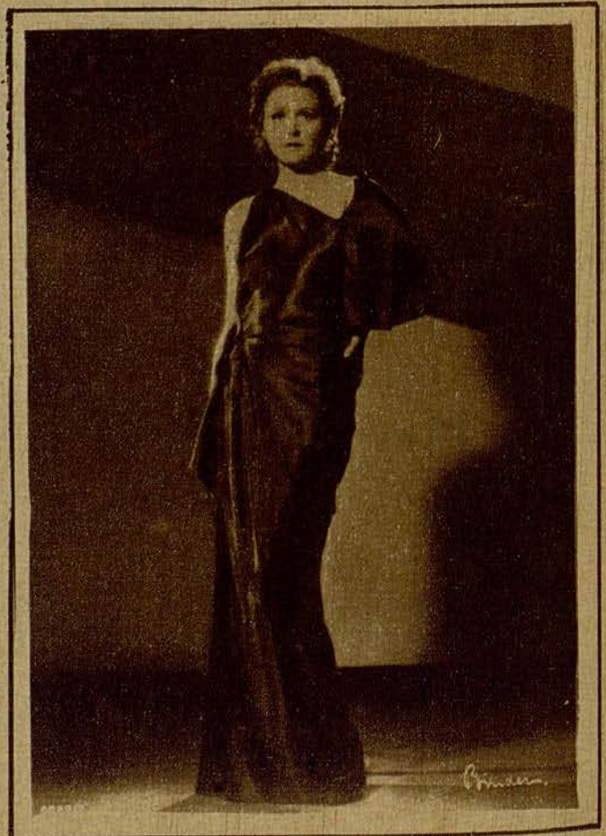
La hermosa Liane Haid, a quien veremos en esta temporada interpretando varios films de Exclusivas Huguet