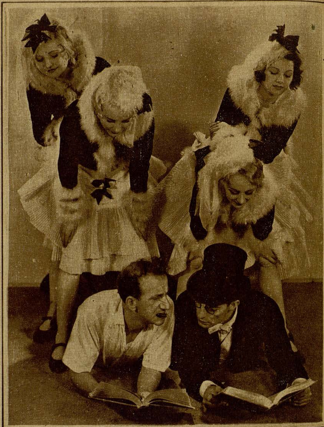
Dos de los más formidables cómicos americanos. Jimmy Durante y Buster Keaton. Al primero le llaman «El narigudo», y aunque aquí sólo le hemos visto en una producción—«Hazte rico pronto!»—, su sola evocación aún provoca nuestra sonrisa

Virginia Bruce pasó de las follies a la pantalla, desempeñando partes menores en «El desfile del amor», «El hombre del milagro» y otras películas. En seguida, la Metro Goldwyn Mayer la contrató por varios años.