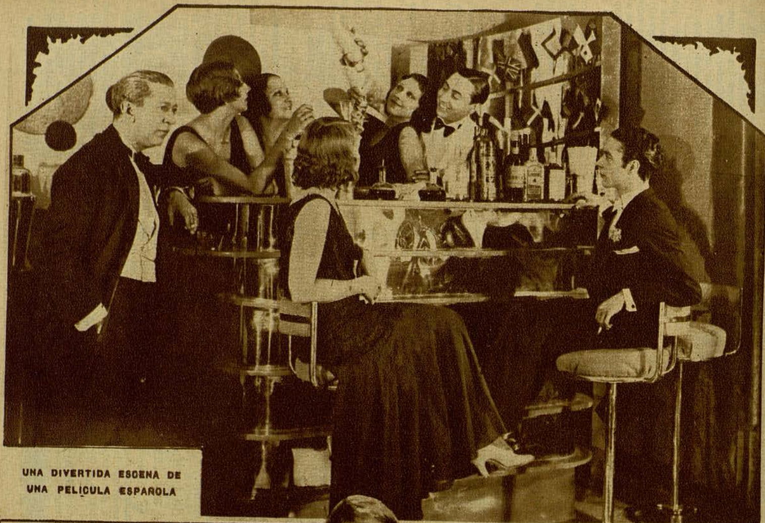
UNA DIVERTIDA ESCENA DE UNA PELÍCULA ESPAÑOLA