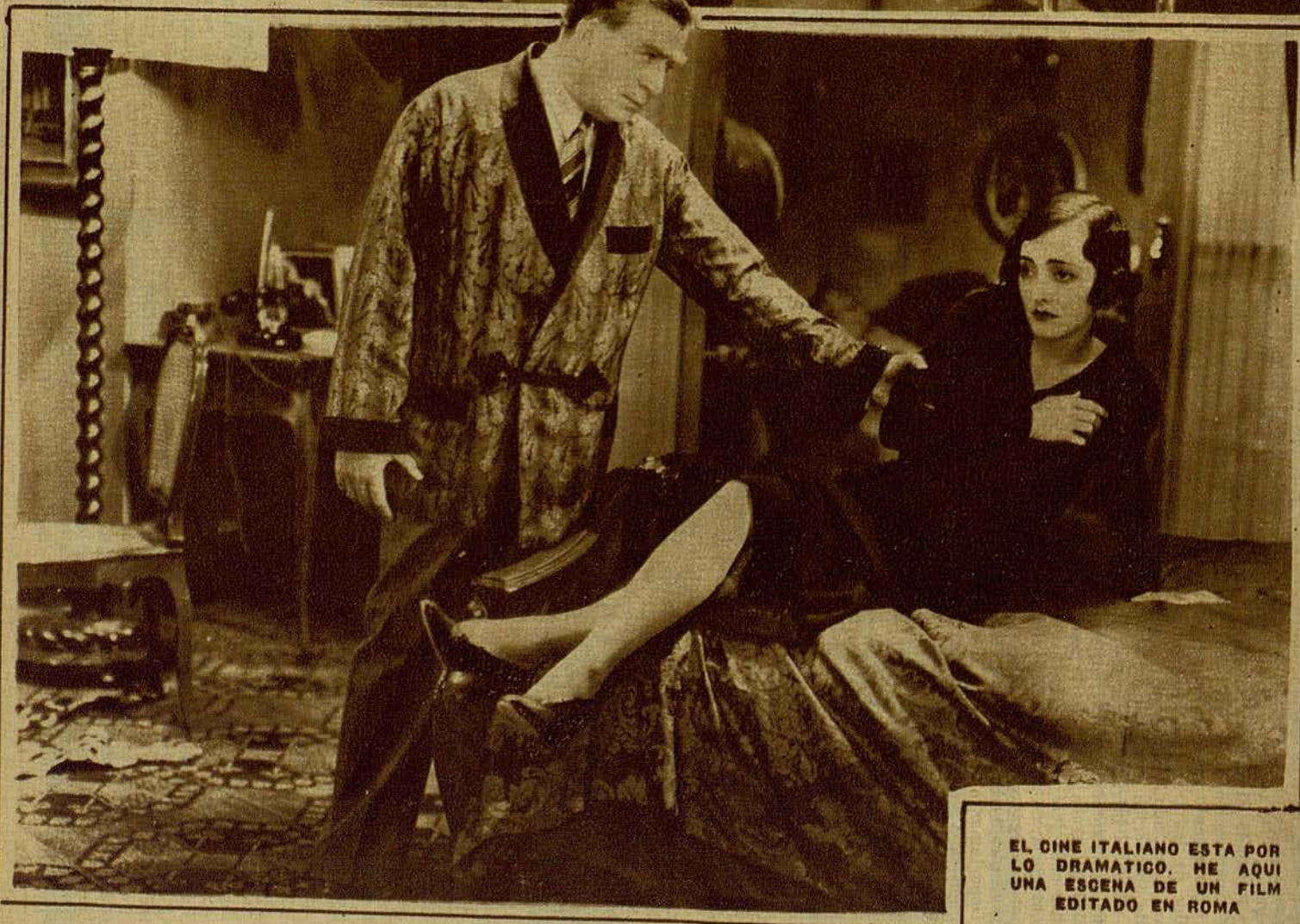
EL CINE ITALIANO ESTA POR LO DRAMATICO. HE AQUI UNA ESCENA DE UN FILM EDITADO EN ROMA