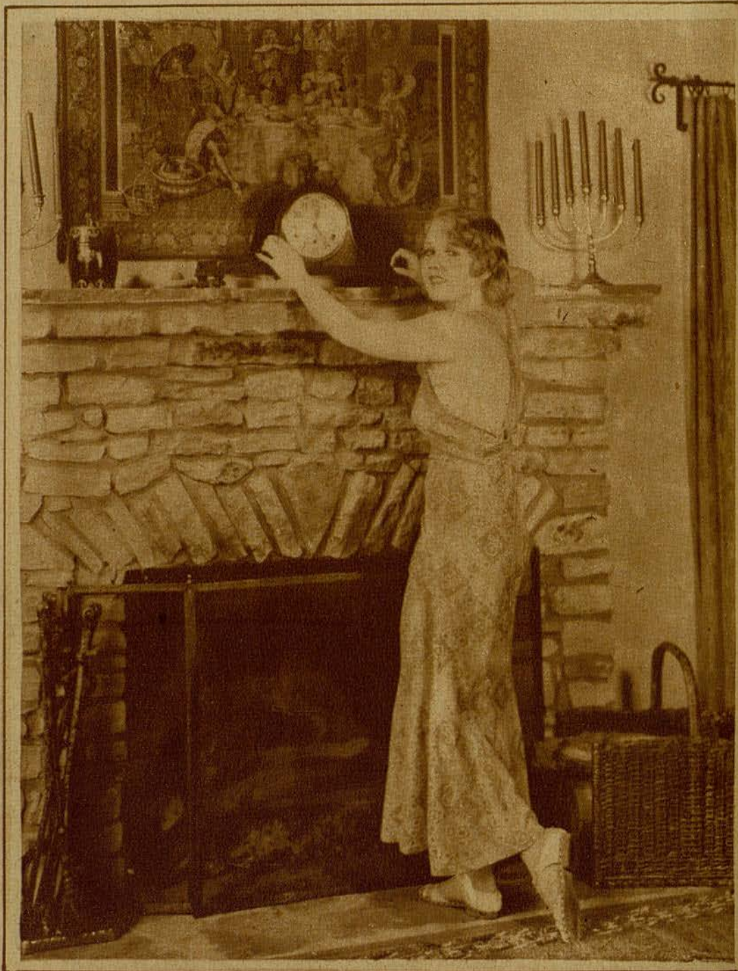
Anita Page, la linda actriz de la M. G. M., dando cuerda al reloj de su casa, en la playa de Malibú, donde vive todo el año

Pero también es fácil conservar el peso normal, al menos para mí. Yo, mientras estoy filmando una película adelgazo sin ningún esfuerzo; tanto es así, que al día siguiente de terminada, puedo darme un banquete de helados y pasteles sin temor alguno. Durante mis vacaciones, o cuando hago algún viaje a Nueva York, ocurre todo lo contrario. En estos casos, naturalmente, recibo a mis amigos, hago visitas y engordo casi sin sentirlo. Resultado: al regresar, tengo que cuidar mucho de mi dieta, para recobrar mi peso normal.