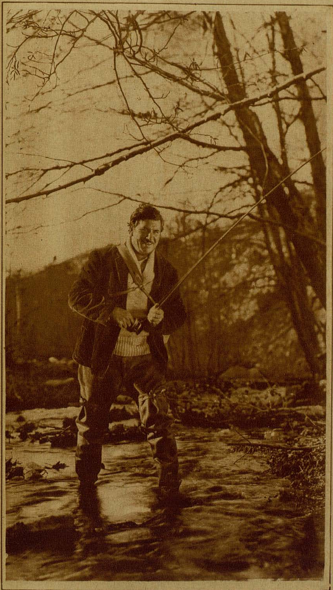
George Bancroft, el gran artista de la Paramount, pescando tranquilamente durante sus vacaciones, en la Sierra de California

Pocos artistas existen en la constelación cinematográfica internacional, que hayan señalado su personalidad con caracteres tan vigorosos como lo ha conseguido George Bancroft.