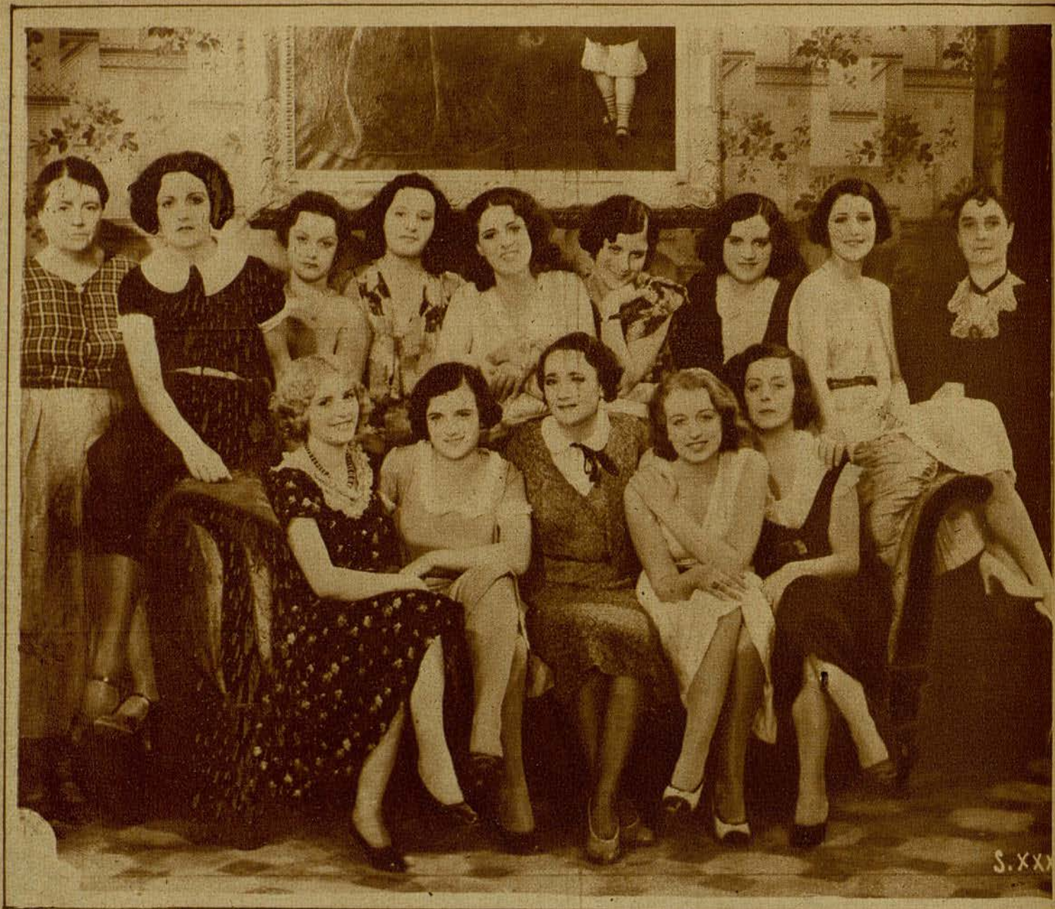
Elsa Merlini, con el bello y abundante regimiento de sus colaboradoras, en una escena de la más reciente de sus producciones