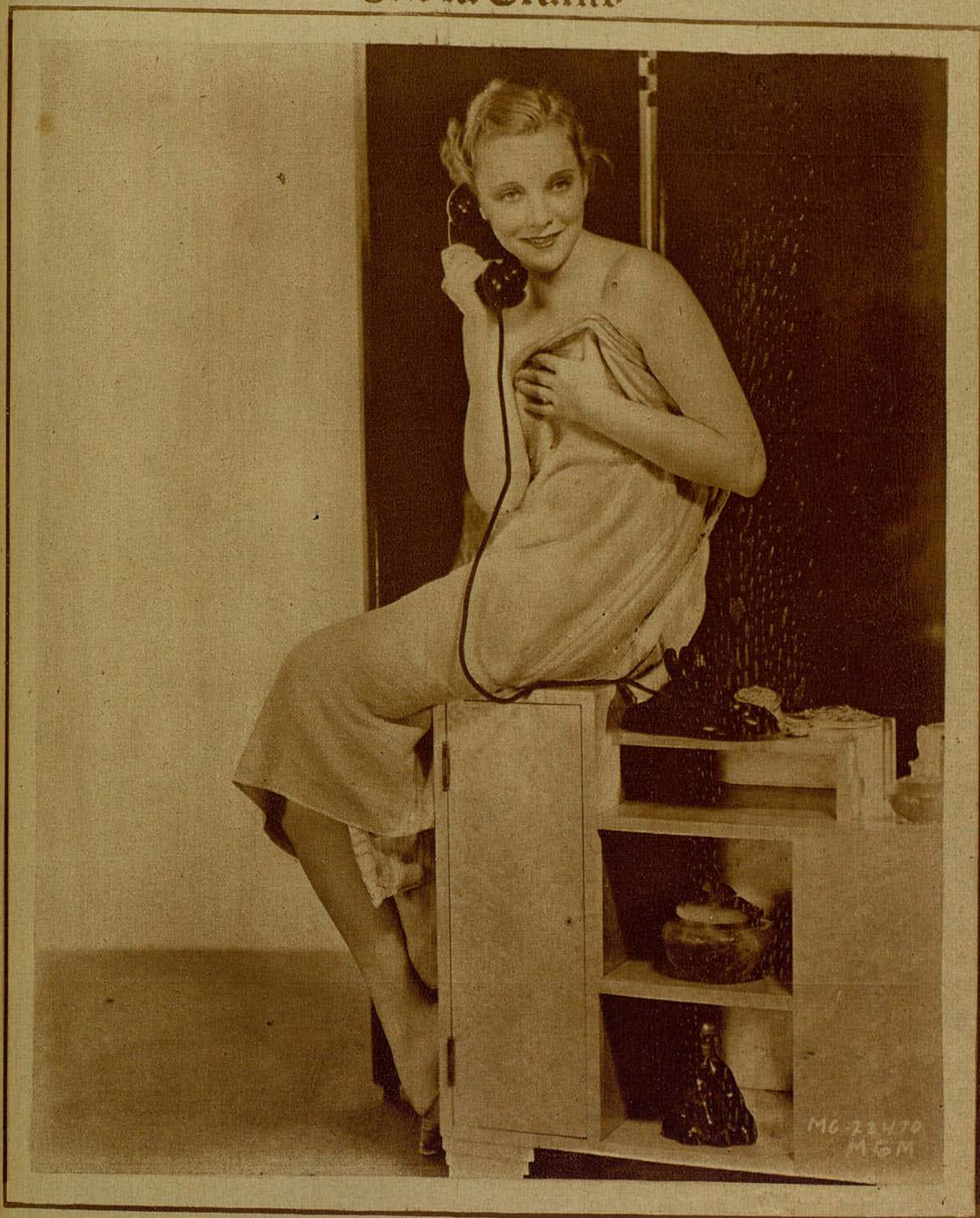
La deliciosa rubia Virginia Bruce, de la M. G. M., ha sido sorprendida en el baño por la llamada telefónica inopinada de uno de sus admiradores. La falta de oportunidad no es obstáculo para que la bella actriz atienda amablemente