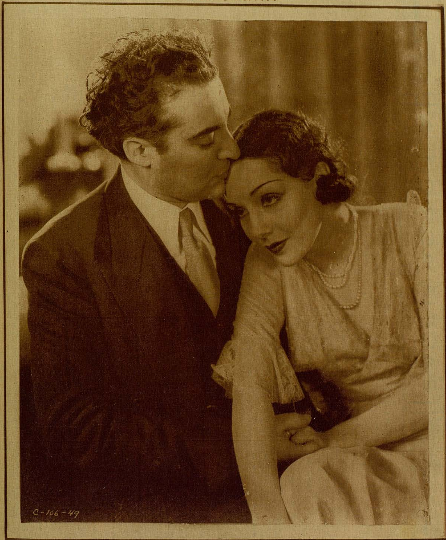
Lupe Vélez y Ramón Pereda, en una escena del film Columbia Pictures, distribuido por «Artistas Asociados», «Hombres en mi vida»