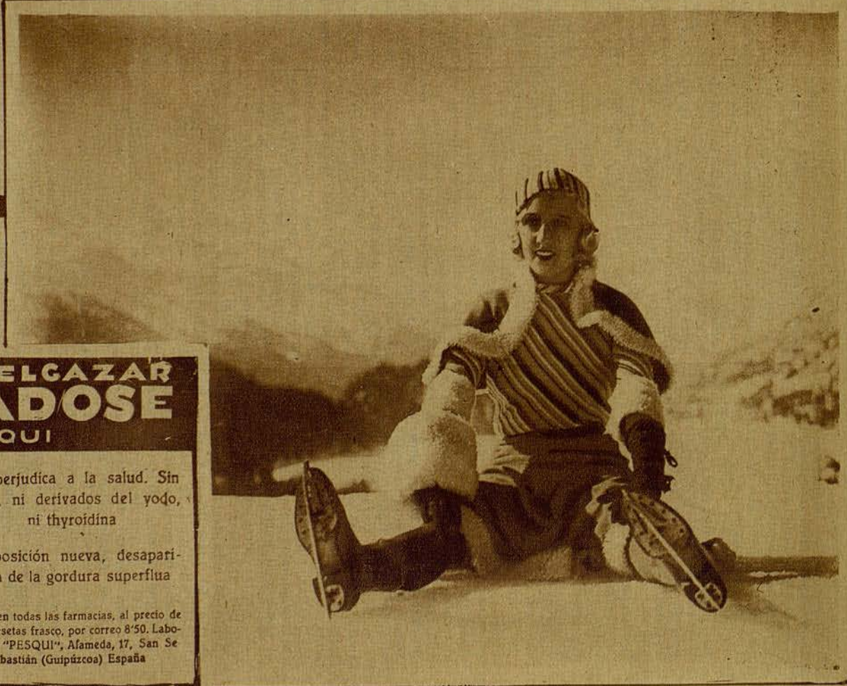
La artista alemana Rosy Barsony