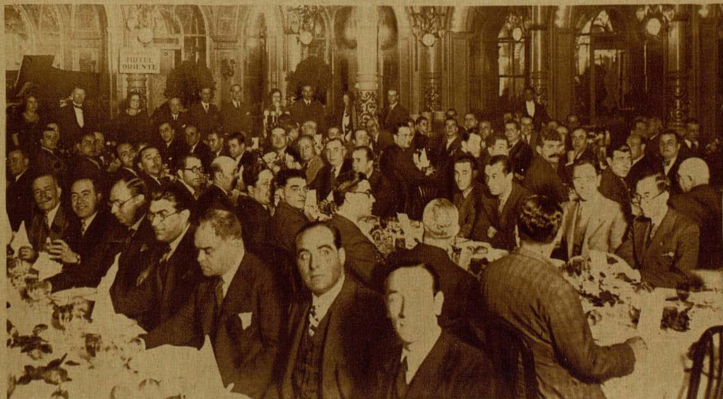
Aspecto que ofrecía el salón de fiestas del Hotel Oriente, en donde se celebró el banquete.