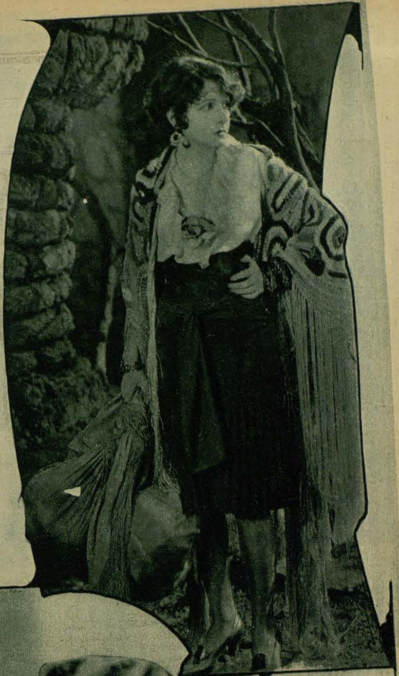
NORMA TALMADGE, PROTAGONISTA DE VA- RIOS FILMS DE «LOS ARTISTAS ASOCIADOS», EN UNA DE SUS ULTI- MAS CREACIONES