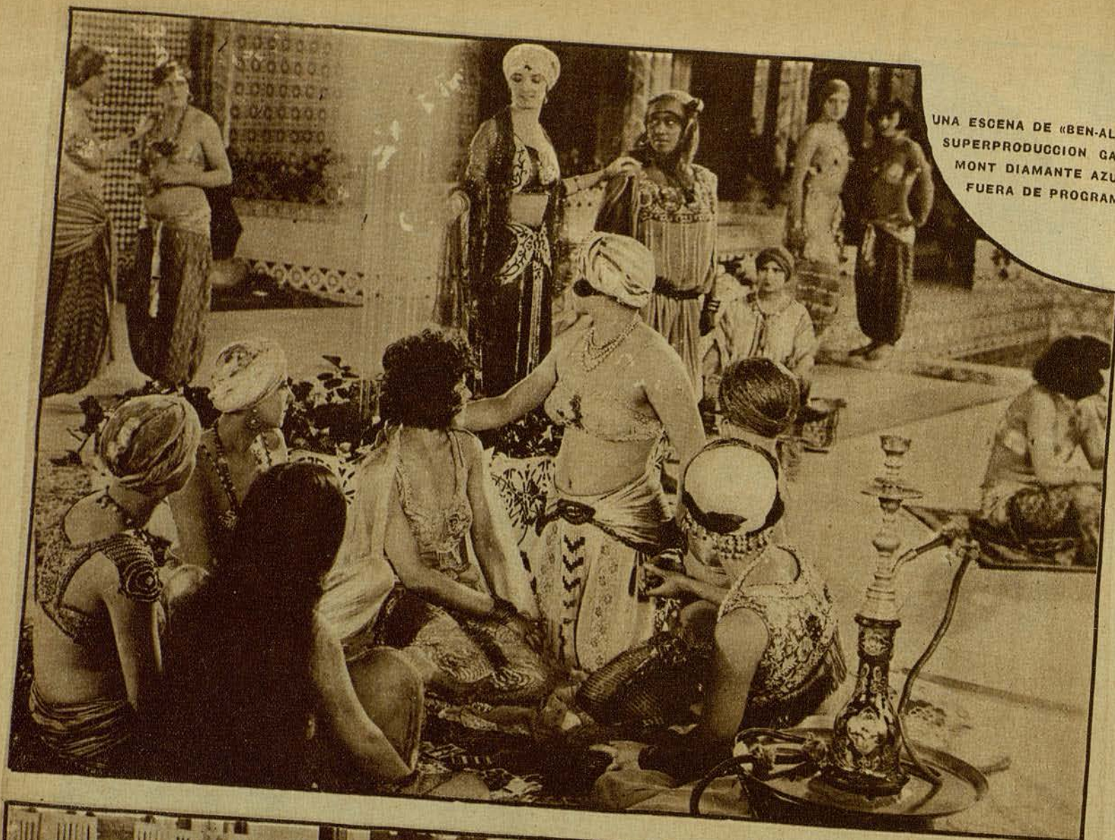
UNA ESCENA DE «BEN-ALI», SUPERPRODUCCION GAU. MONT DIAMANTE AZUL, FUERA DE PROGRAMA