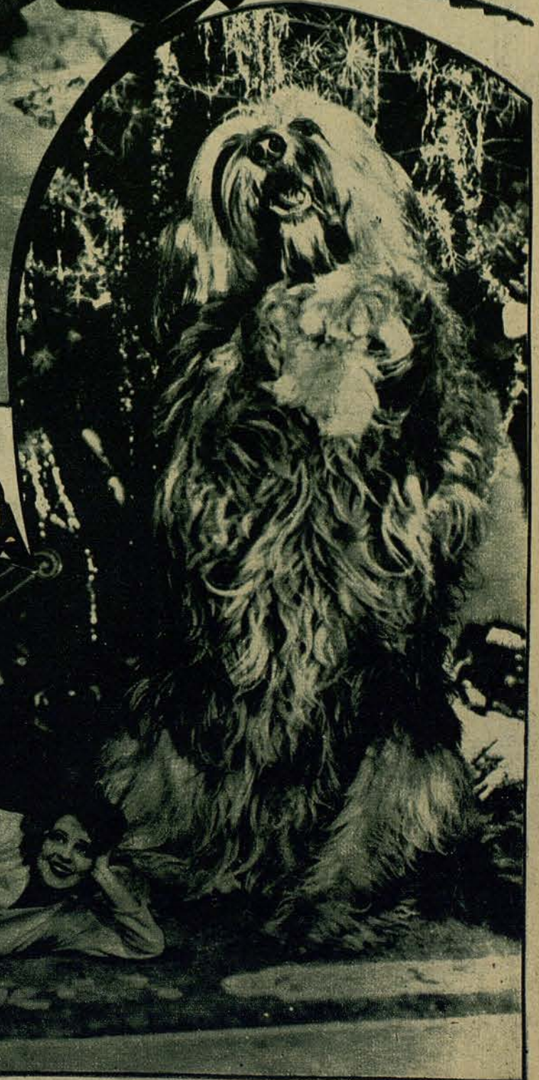
FANTASTICO A NO PODER SERLO MAS ES EL ARBOL DE NOEL DE LA BELLA CLARA ROW, ESTRELLA DE LA PARAMOUNT, QUE SE NOS APARECE COMO UN CHIQUILLO TRAVIESO