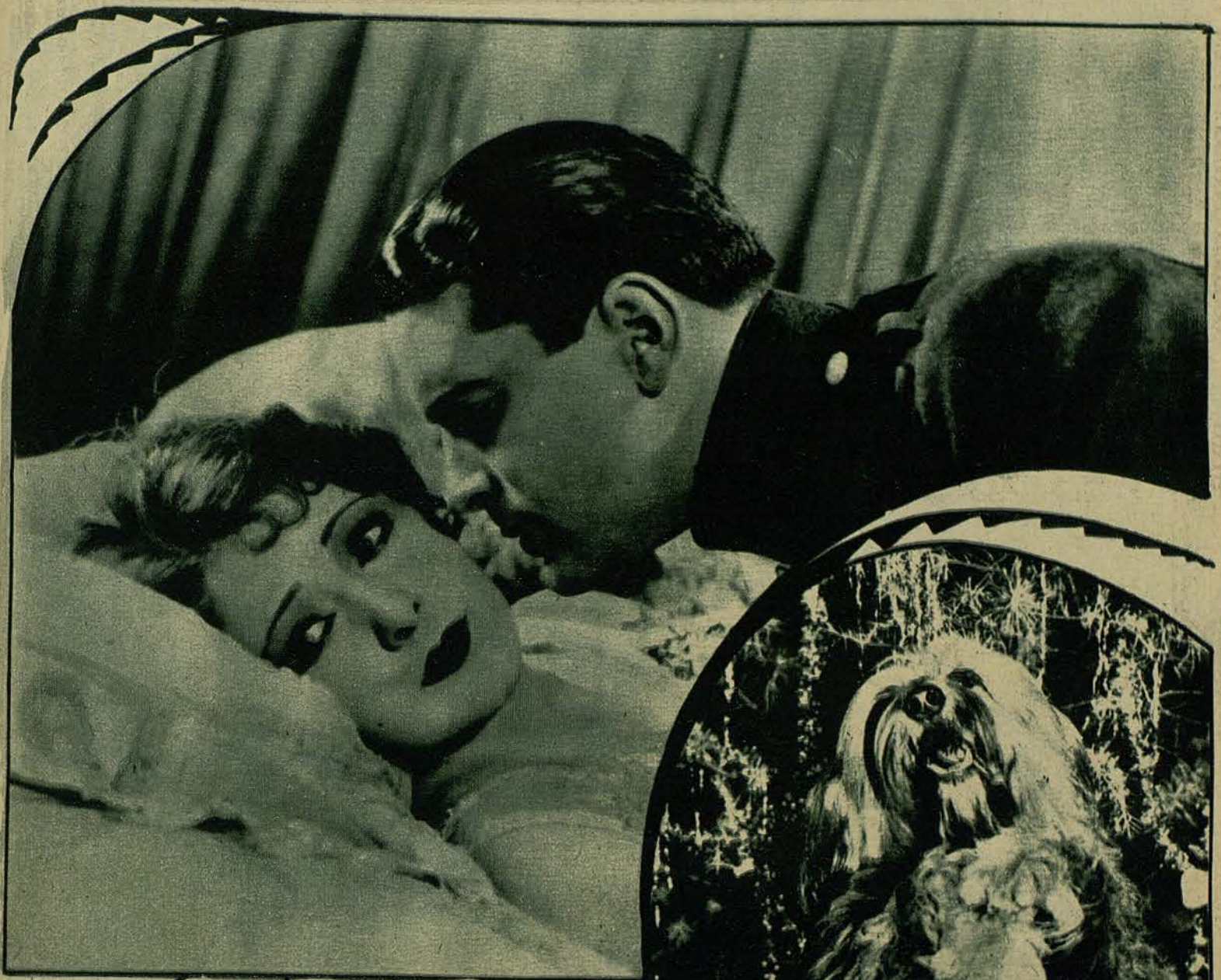
BILLIE DOVE Y LLOYD HUGHES, EN UNA ESCENA DE «LOS HUSARES DE LA REINA», FILM SELECCION GRAN LUXOR VERDADERO