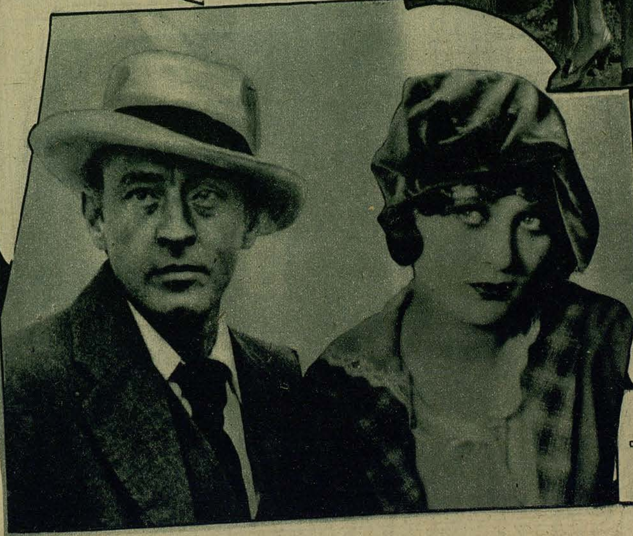
JHON BARRYMORE Y DOLORES COSTELLO, DUYO NOVIAZGO HA SIDO HECHO PUBLICO