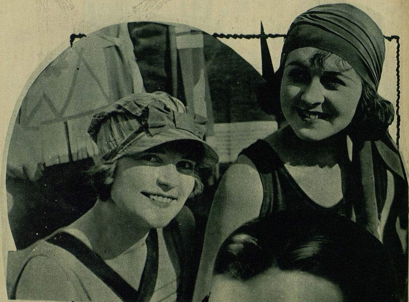
DOS BELLEZAS DE HOLLYWOOD, QUE ASPIRAN AL RANGO DE ESTRELLAS