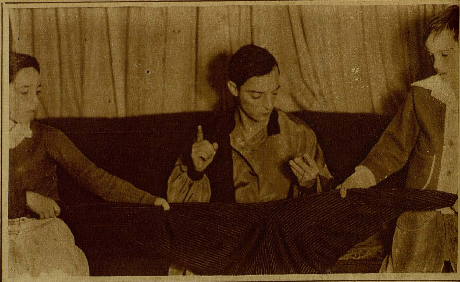
Buster Keaton enseña a sus hijos Bob y Joe, la mejor manera de rasgar pantalones