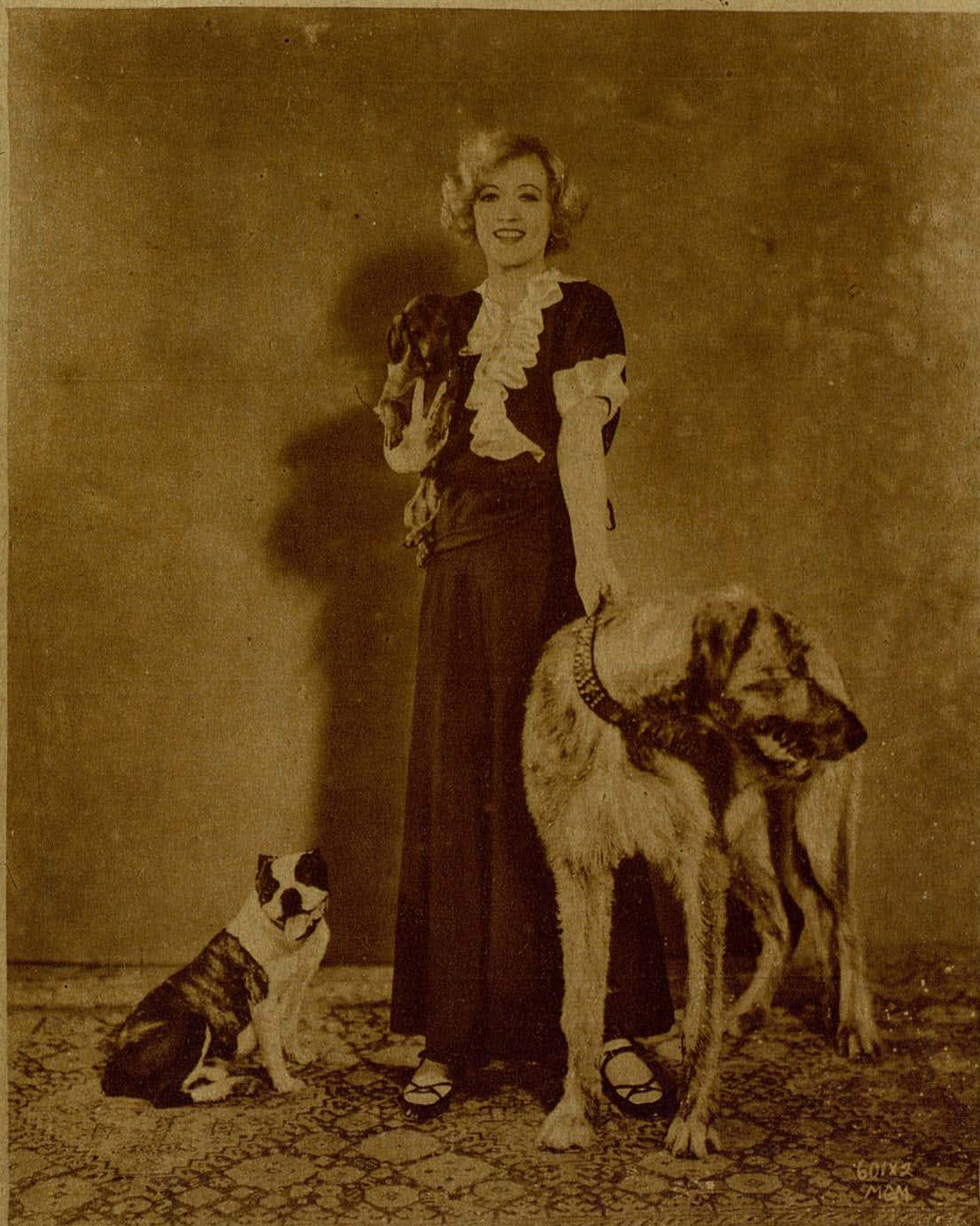
La célebre estrella Marion Davies, nos presenta a sus tres perros favoritos