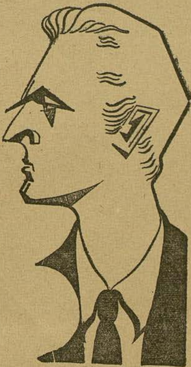
(EL GRAN BARRYMORE)

Emil Jannings, el gran actor que recientemente conquistó su segundo triunfo en los Estados Unidos con la película «La última orden», está ahora filmando bajo la dirección de Ernest Lubitch, descubridor de Pola Negri, una película que se llamará «El patriota». Solamente los decorados de dicha producción cuestan hasta ahora cien mil dólares, lo que da una idea del dinero que va a gastarse en la nueva cinta.