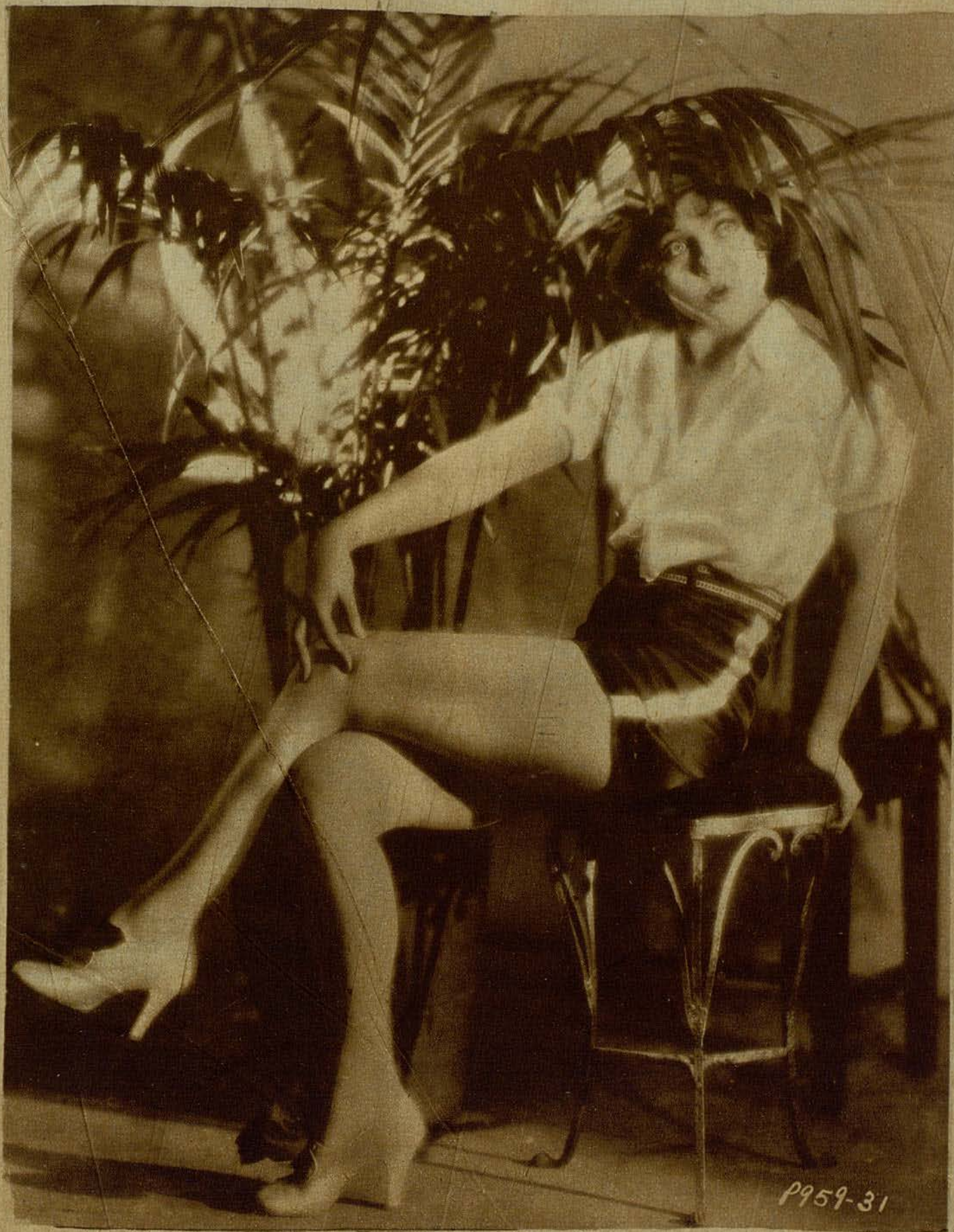
Nancy Carroll nueva estrella de la Paramount