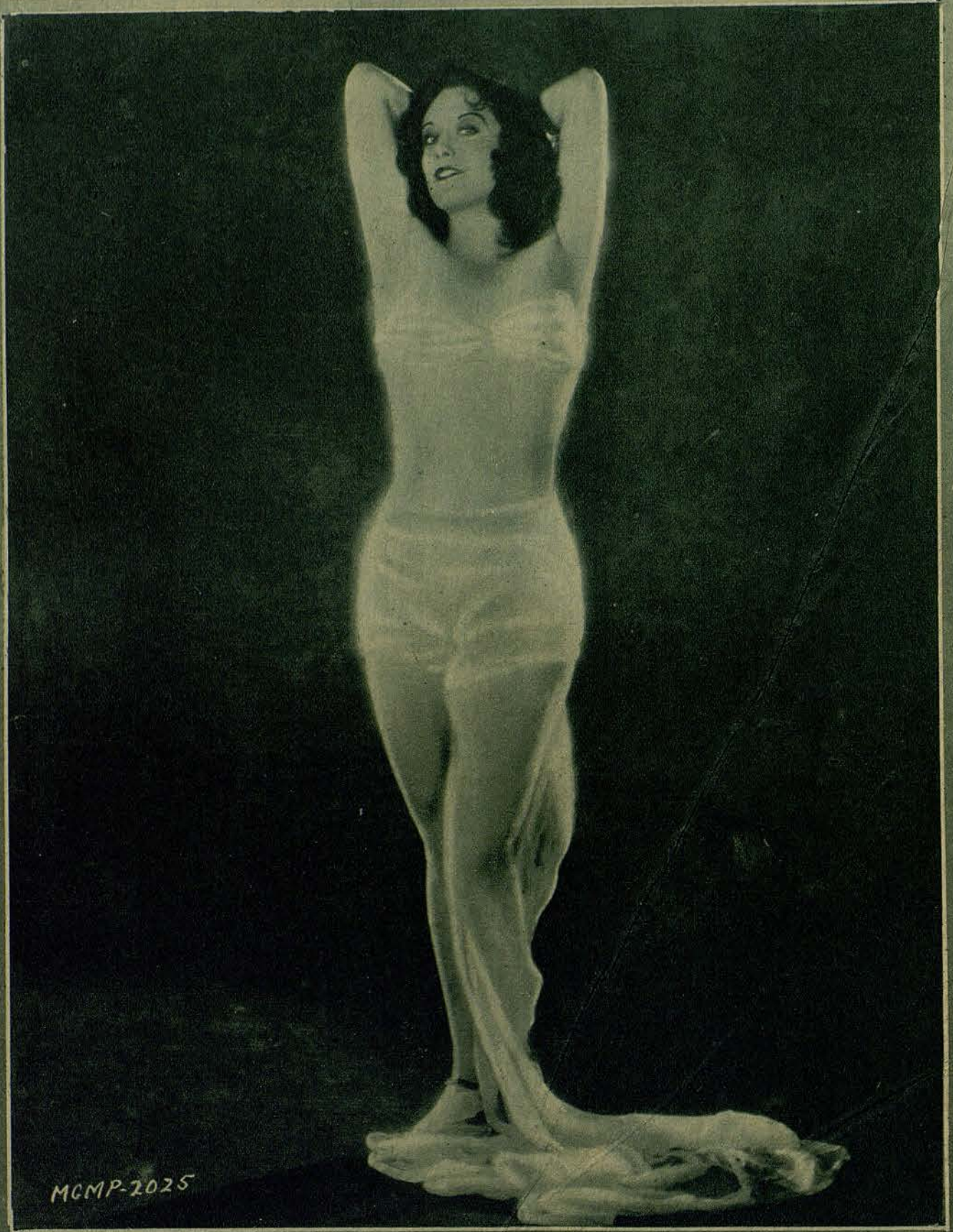
Jean Crawford, estrella de la M. G. M. que ha sido calificada la "Venus de Holliwood."