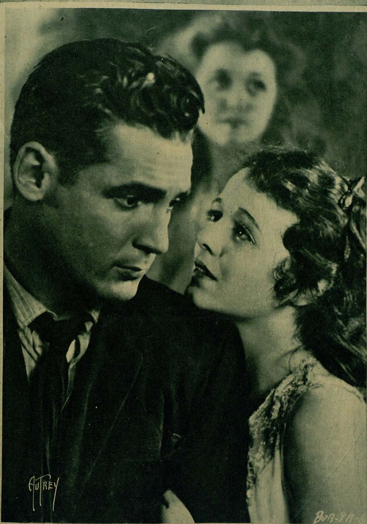
Una escena de "El Angel de la calle" ~ film Titan Fox ~ por Janet Gaynor y Charles Farrell.