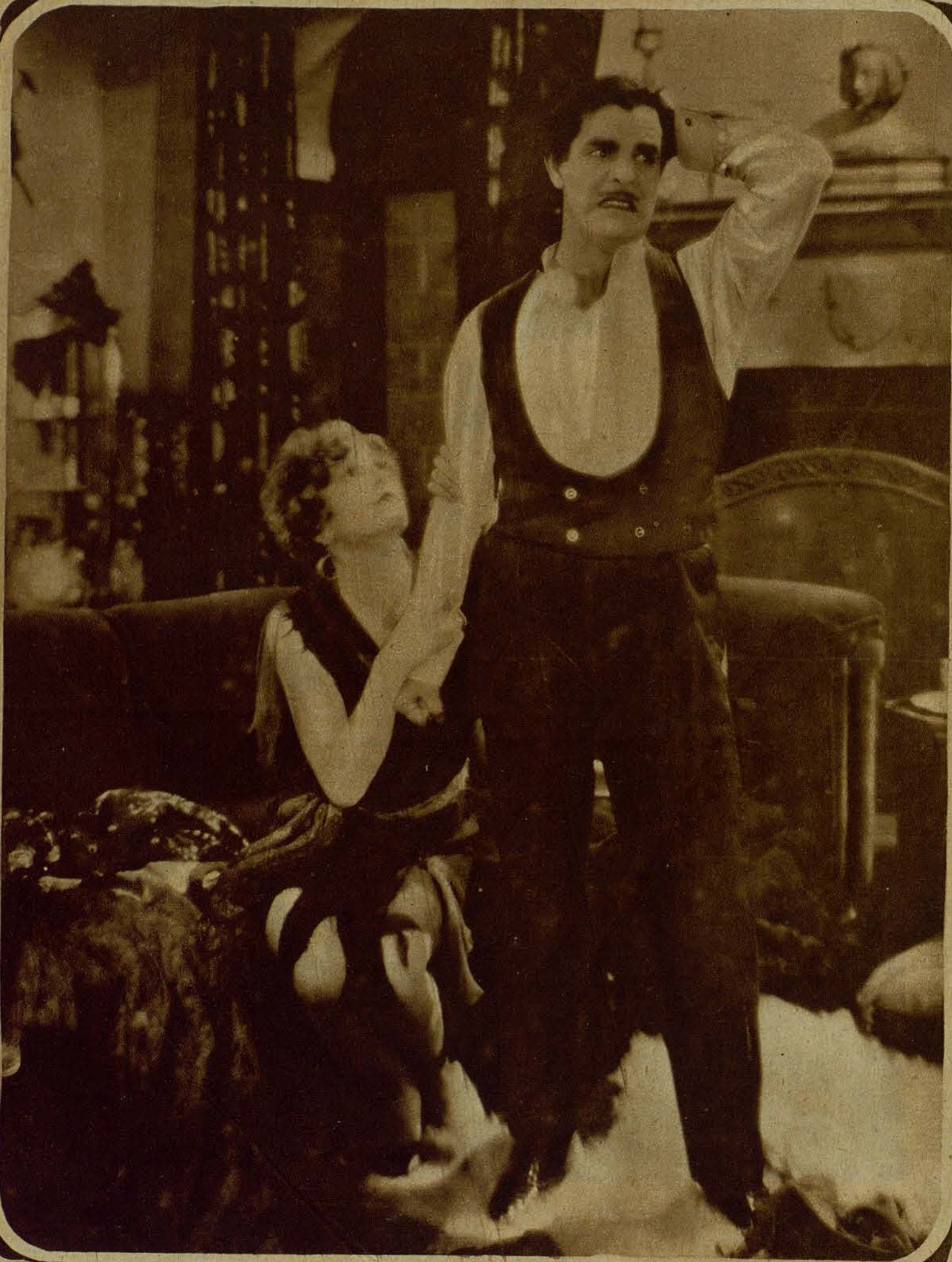
Constance Talmadge y Antonio Moreno en una escena del film First National "Venus de Venecia."