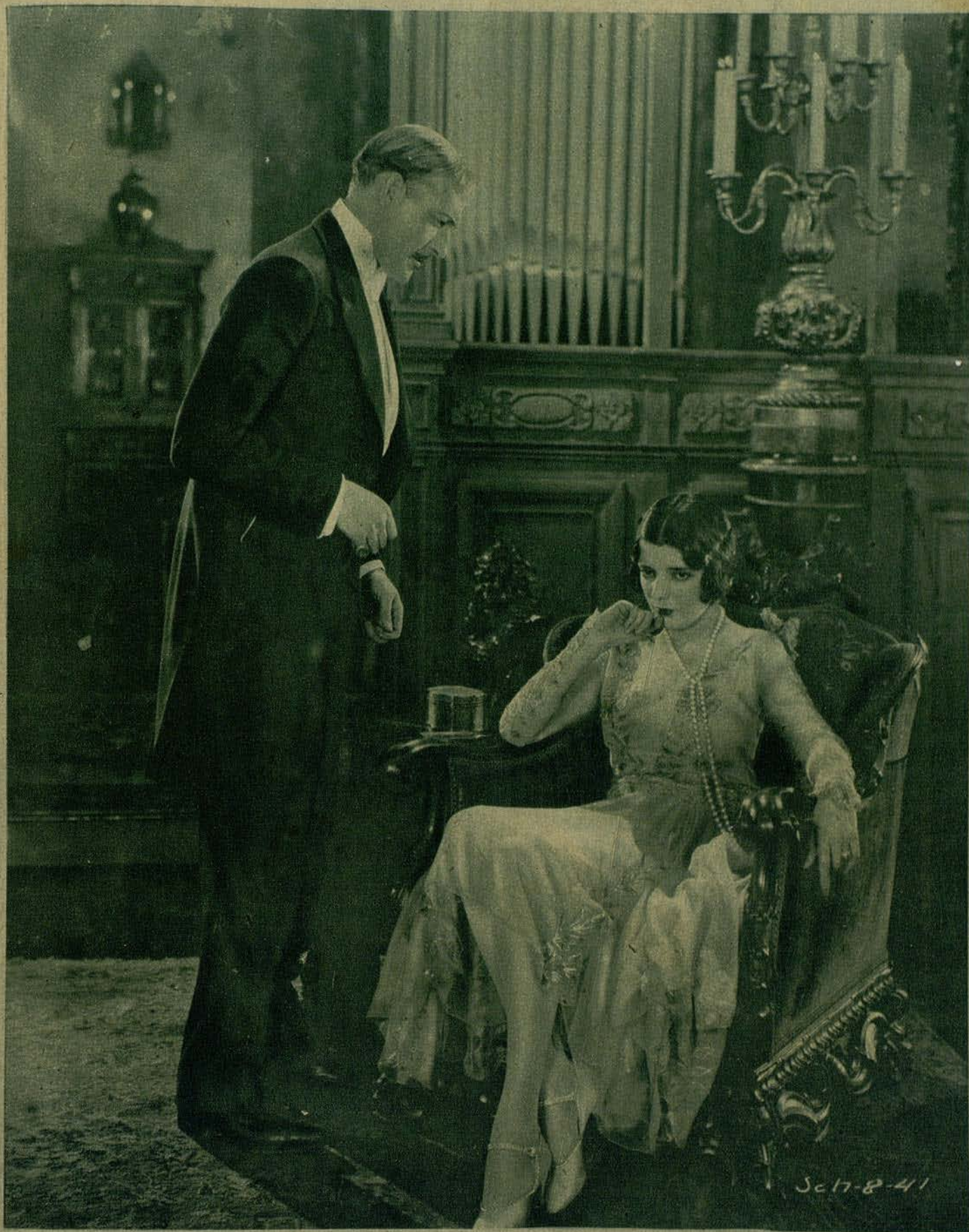
Alma Rubens en la superproducción Fox, El corazón de Salomé