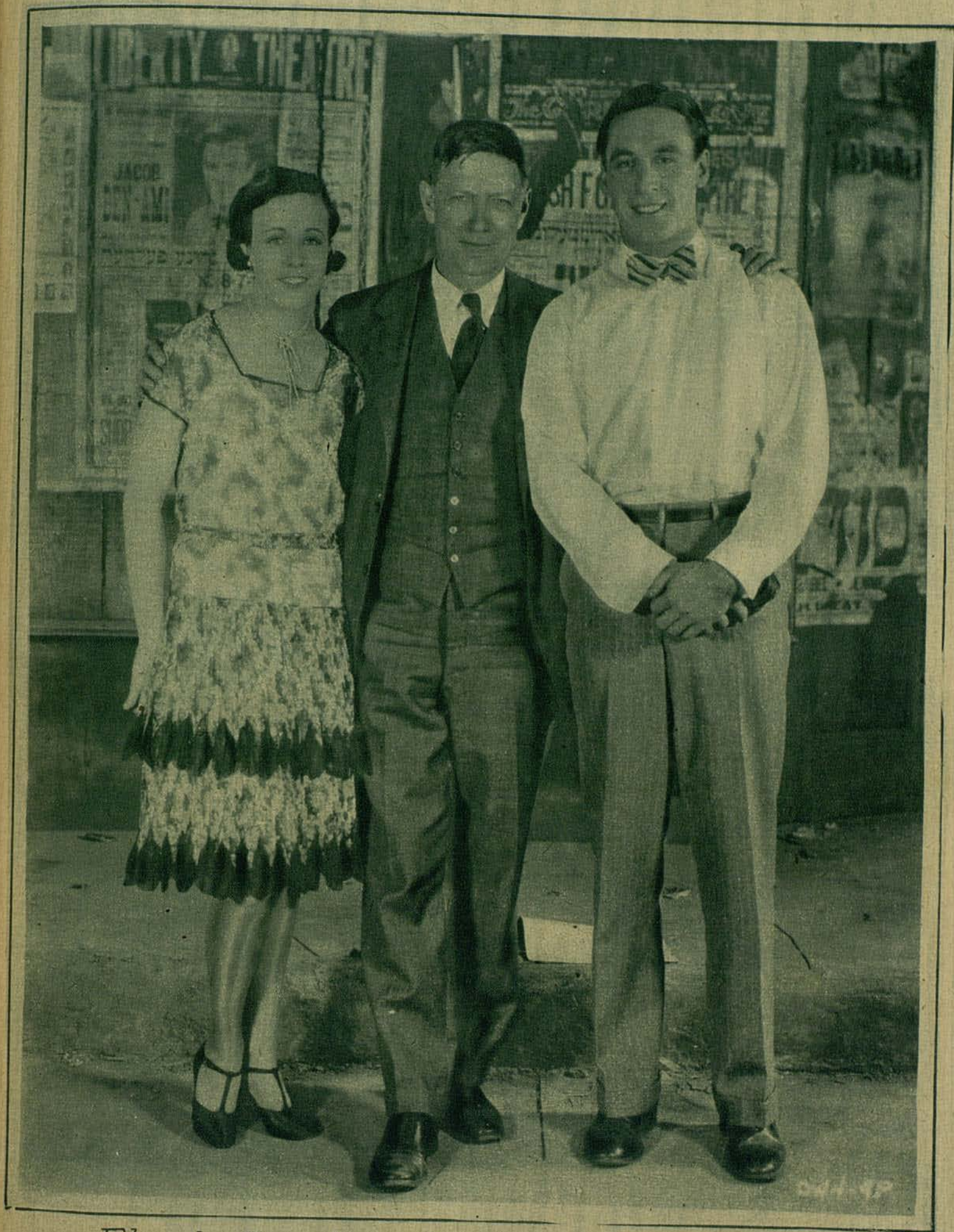
El capitan Riesenbers autor de "Titanic" con Virginia Valli y George O'Brien protagonistas de la versión de la Fox Film.