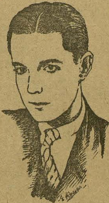
RAMON NOVARRO (por Emilio Roure, de Llagostera)

tacan: un soberbio contrato con la Paramount para «rodar» películas sonoras, ya que la citada artista es una enorme adquisición para cumplir a maravilla dicho cometido. Ninguno de ustedes ignora que miss Olga fué actriz de ópera del Teatro Imperial, de Moscu.