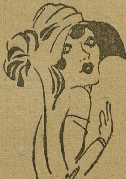
GLORIA SWANSON

tervenir para que esto no sucediera y desvió el golpe que debía alcanzar al financiero.