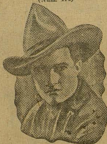
TOM MIX (por Rafael Rubio Casado, de Barcelona)

laba hacia París, donde, libre de persecuciones, podría proseguir tranquilamente sus estudios.