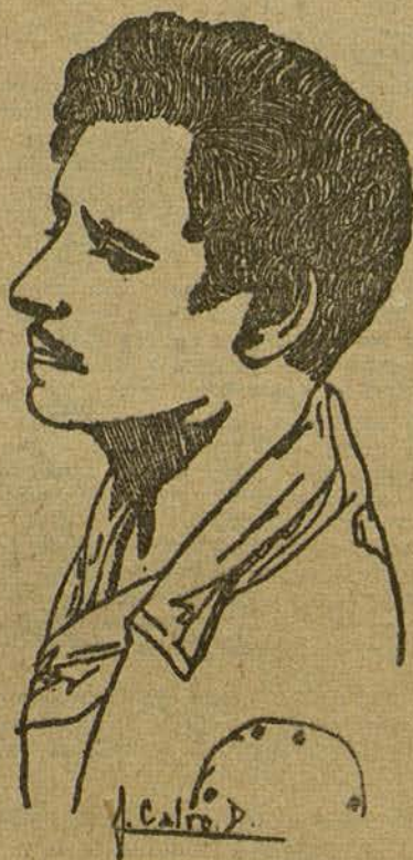
RONALD COLMAN

fica originó el derrumbamiento de las acciones del Banco Universal. Saccard estaba literalmente aplastado, cuando recibió un telegrama cifrado de Mazaud, anunciándole que Hamelin había, en efecto, aterrizado en inmejorables condiciones, en Guyana, pero que las noticias oficiales se había retrasado. El primer movimiento del financiero fué lanzar la noticia a los cuatro vientos, más pensándolo mejor, optó por callarse para aprovecharse de la baja experimentada y volver a comprar sus acciones a un precio muy ventajoso.