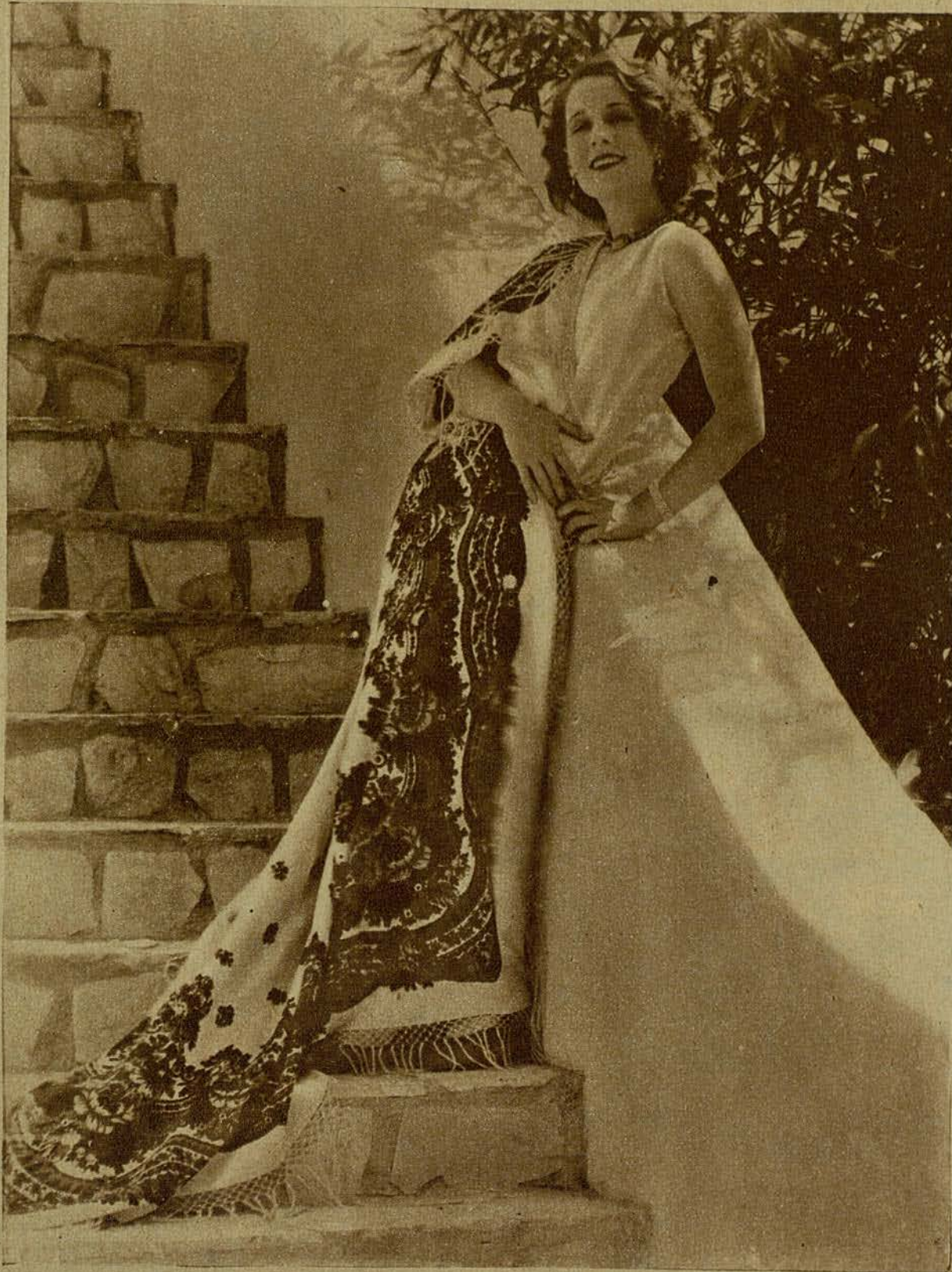
NORMA SHEARER estrella de la M. C. M.