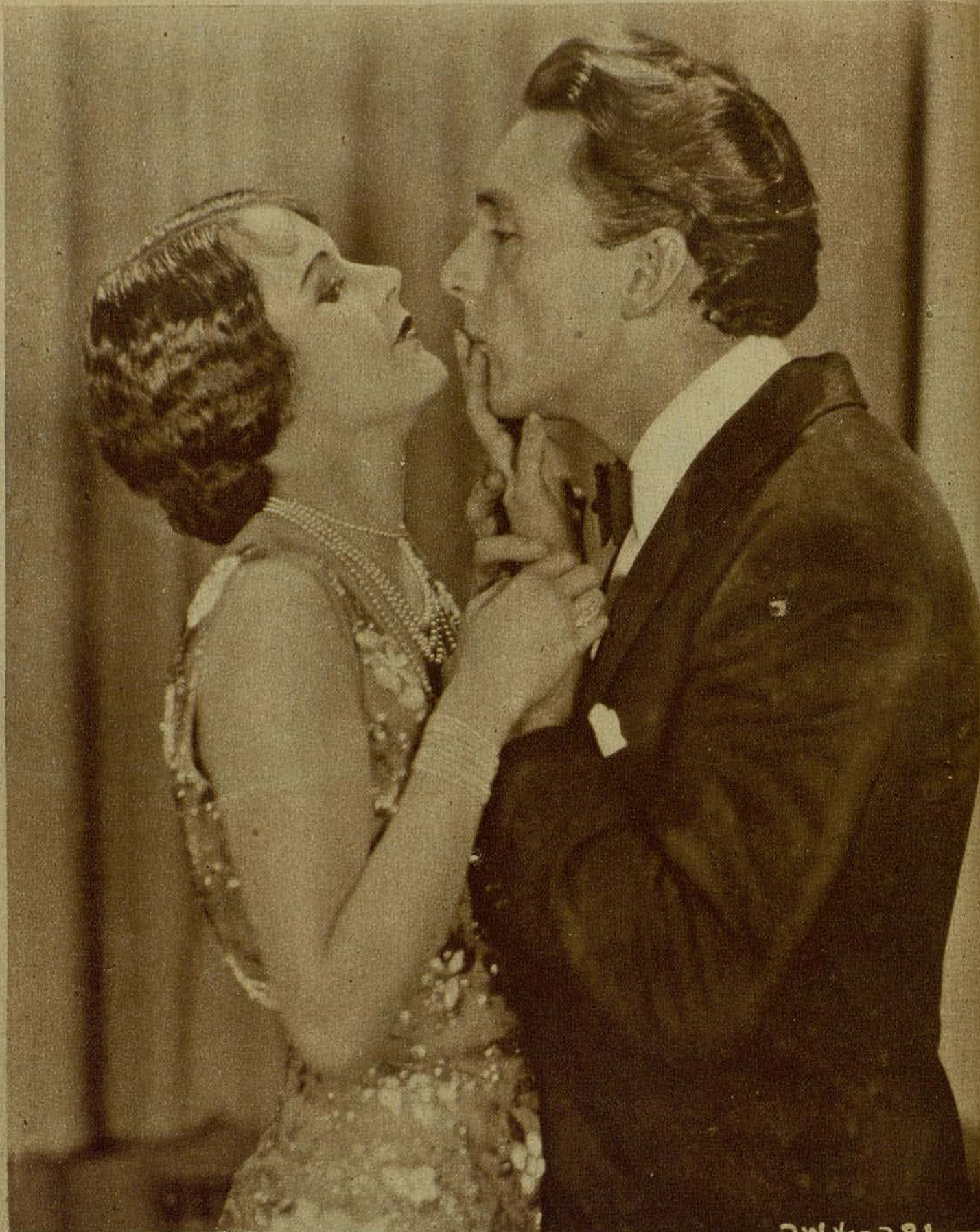
June Collier y George O'Brien, en la super- producción Fox. "Titanic."