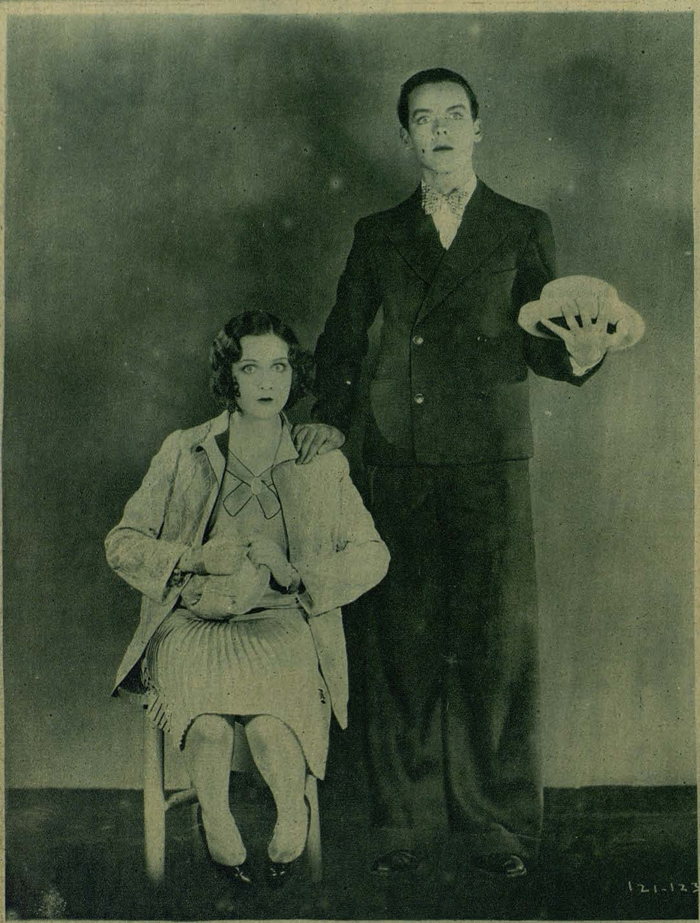
Yola de Avril y Jack Mulhall en "Lady be Good," proxima pelicula First National.