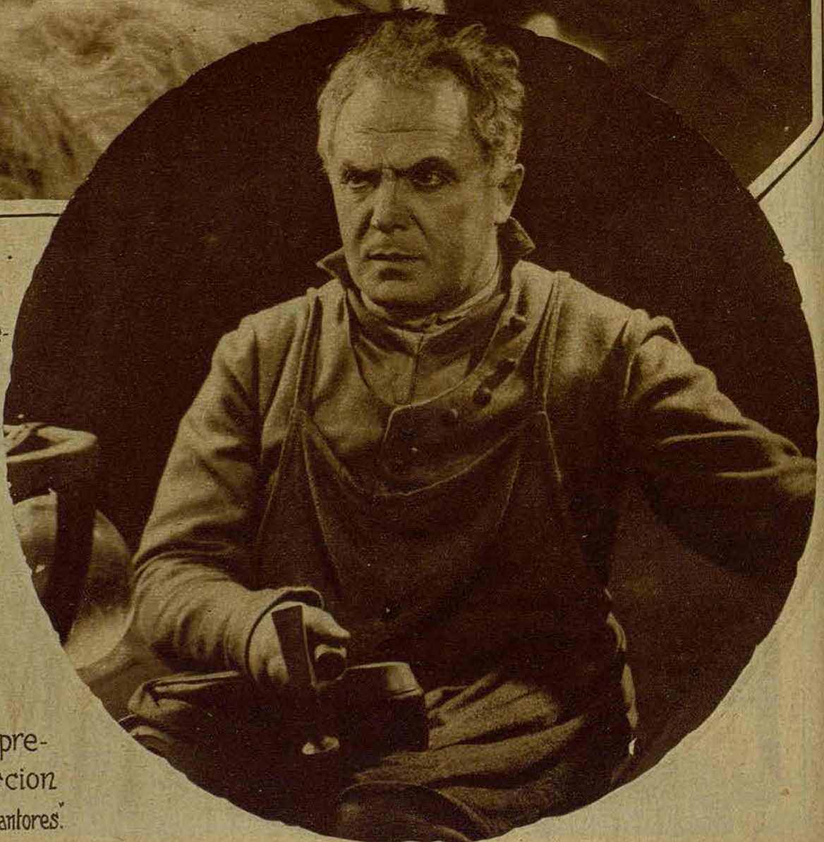
U no de los intérpretes de la selección Verdaguer "Los Maestros Cantores."