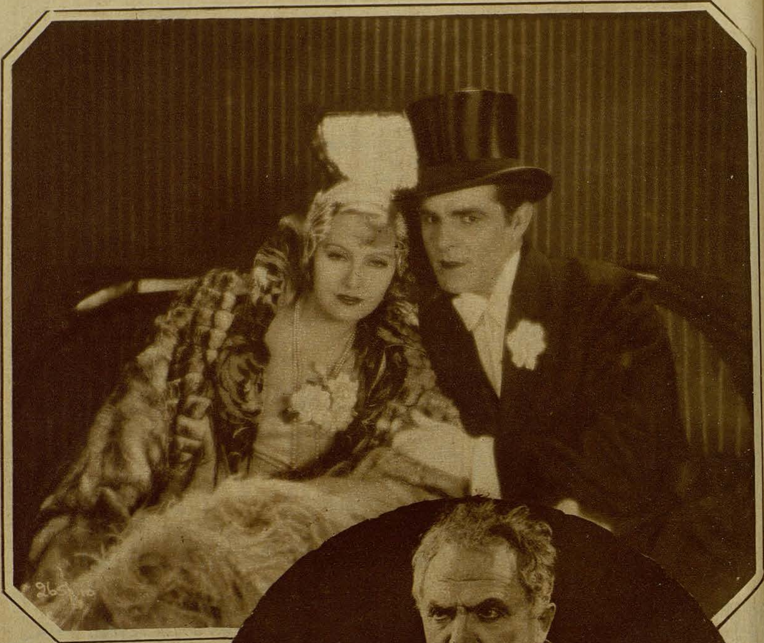
G reta Garbo y Antonio Moreno en el film M.G.M. "La tierra de todos"