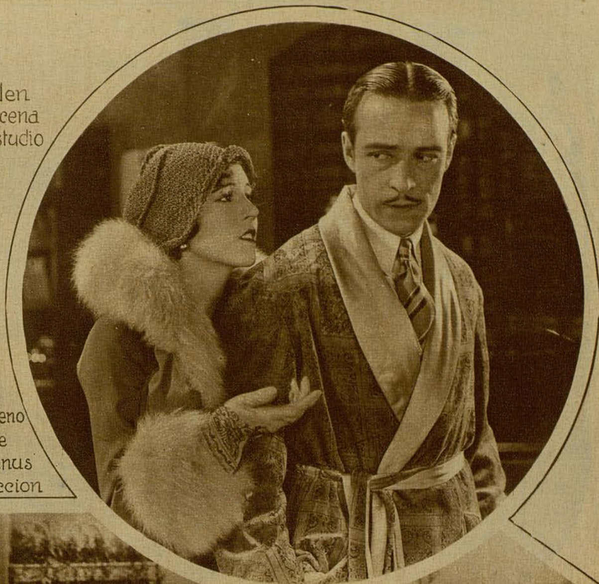
A ntonio Moreno y Constance Talmadge en "La Venus de Venecia" produccion First.