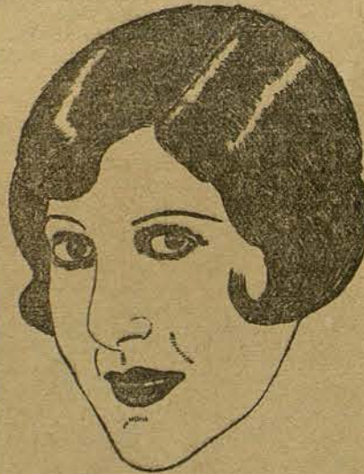
PATSY RUTH MILLER (Por Domingo Bejga Corzo, de Badalona)

wood, contratados por la BIP, con la célebre Gilda Gray.