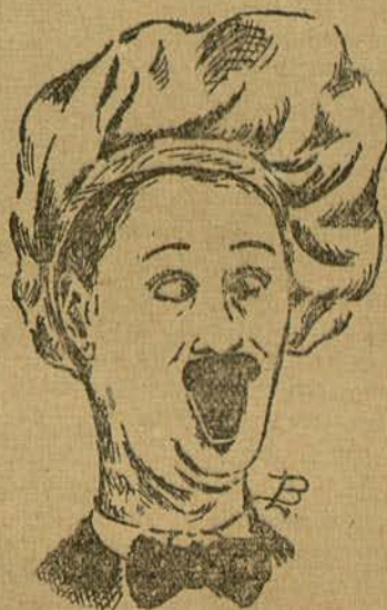
BEN TUPIN (Por Lino Blosca, de Barcelona)