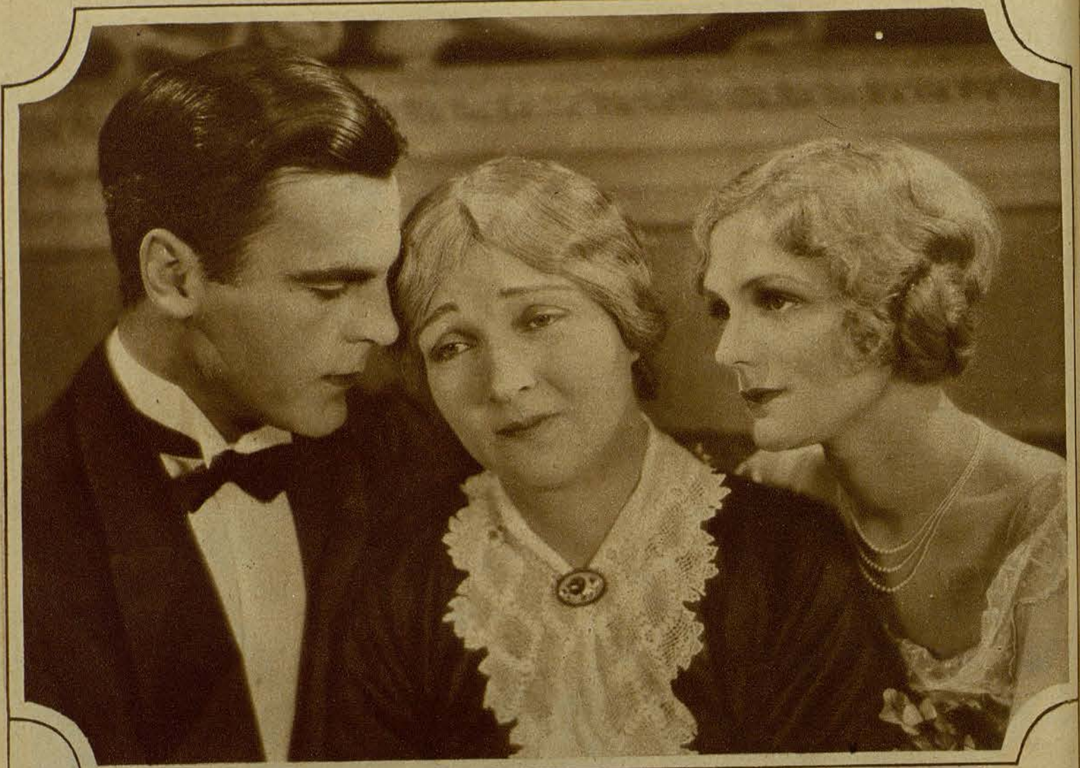
N eil Hamilton, Belle Ben- net y Constance Howard, protago- nistas de "¡Madre mia!"