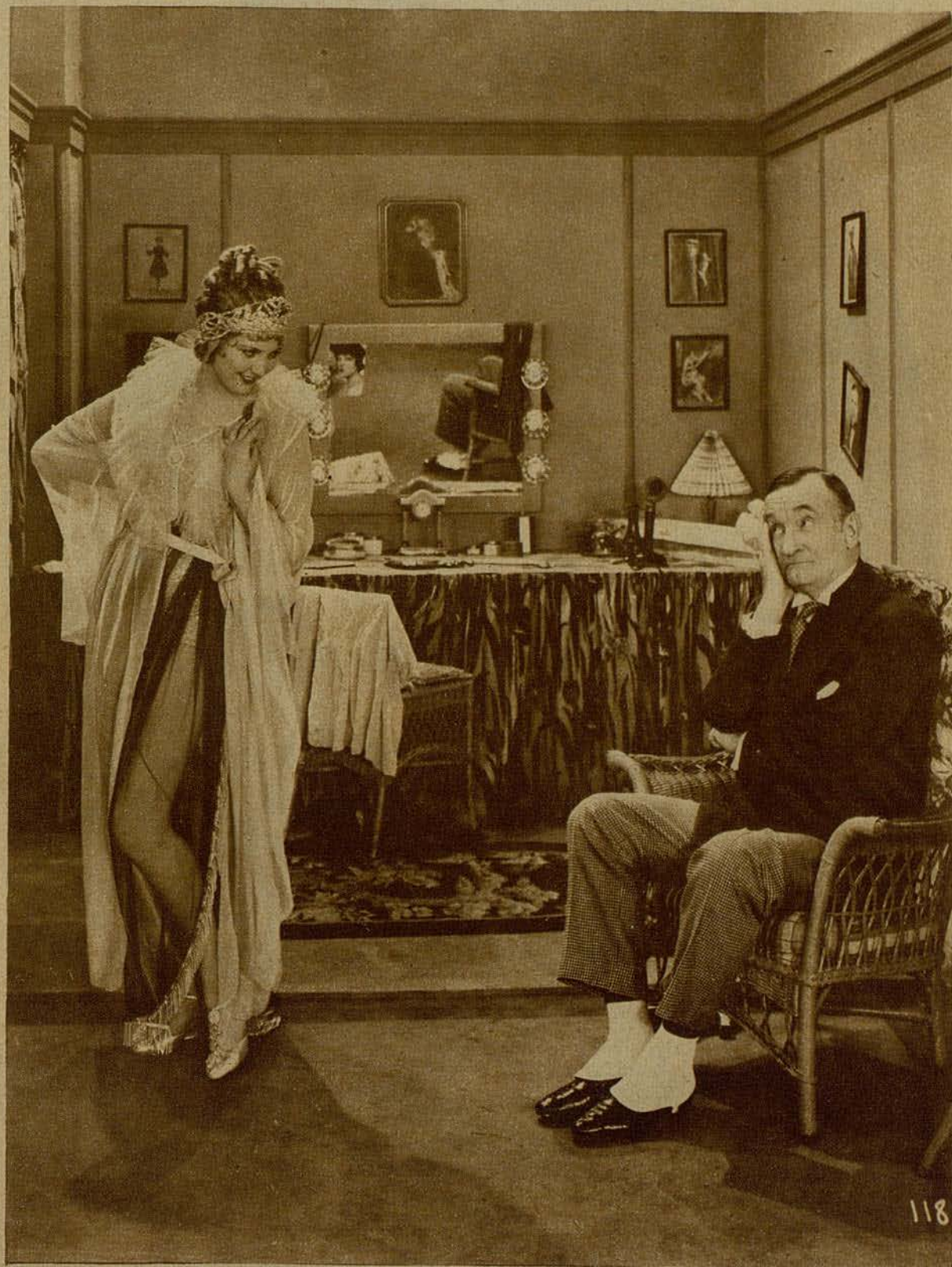
Thelma Todd y Charlie Murray en una escena del film First "It's all Greek' ts Me"