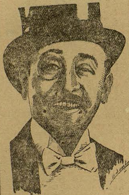
ADOLPH MENJOU (Por Manuel Duart Grau, de Barcelona)

tentrional de Noruega, desde donde se lanzó hacia el blanco misterio de los hielos polares, entre los cuales, los naufragos del «Italia», heridos, hambrientos, aterrorizados por el frío y separados los unos de los otros, llamaban ansiosamente demandando socorro con ayuda de una estación de T. S. H.