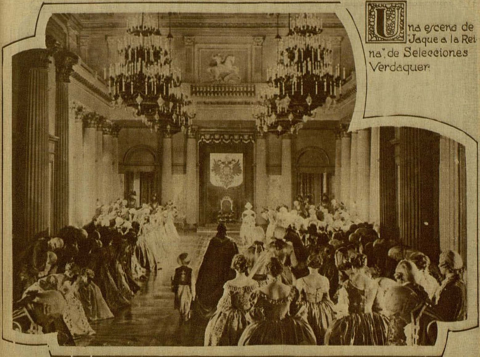
U na escena de "Jaque a la Rei- na" de Selecciones Verdaquer.