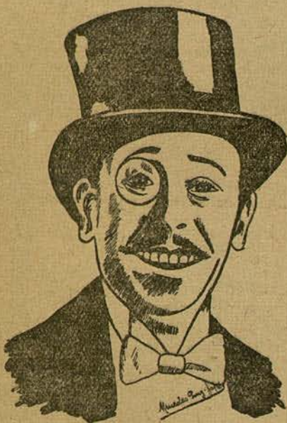
ADOLPH MENJOU (Por Mercedes Puig-Jofré y Planella, de Barcelona)