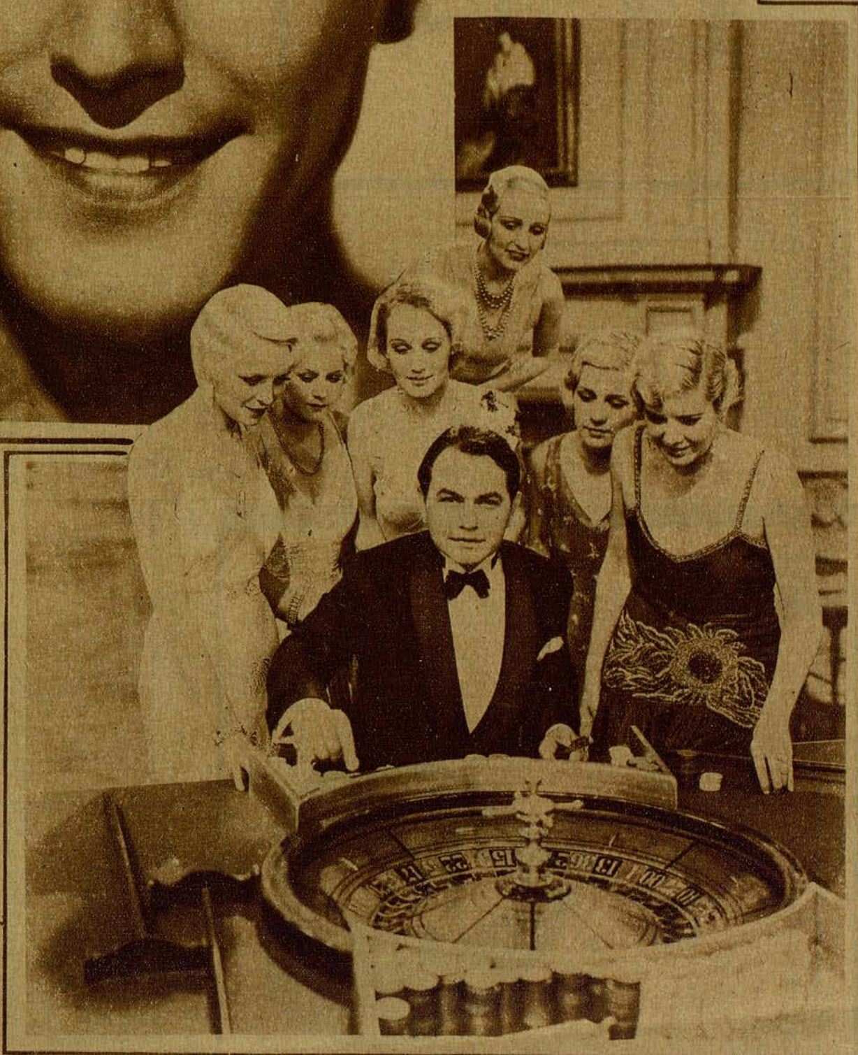
UNA ESCENA DE LA PELICULA WARNER BROS, «SMART MONEY»