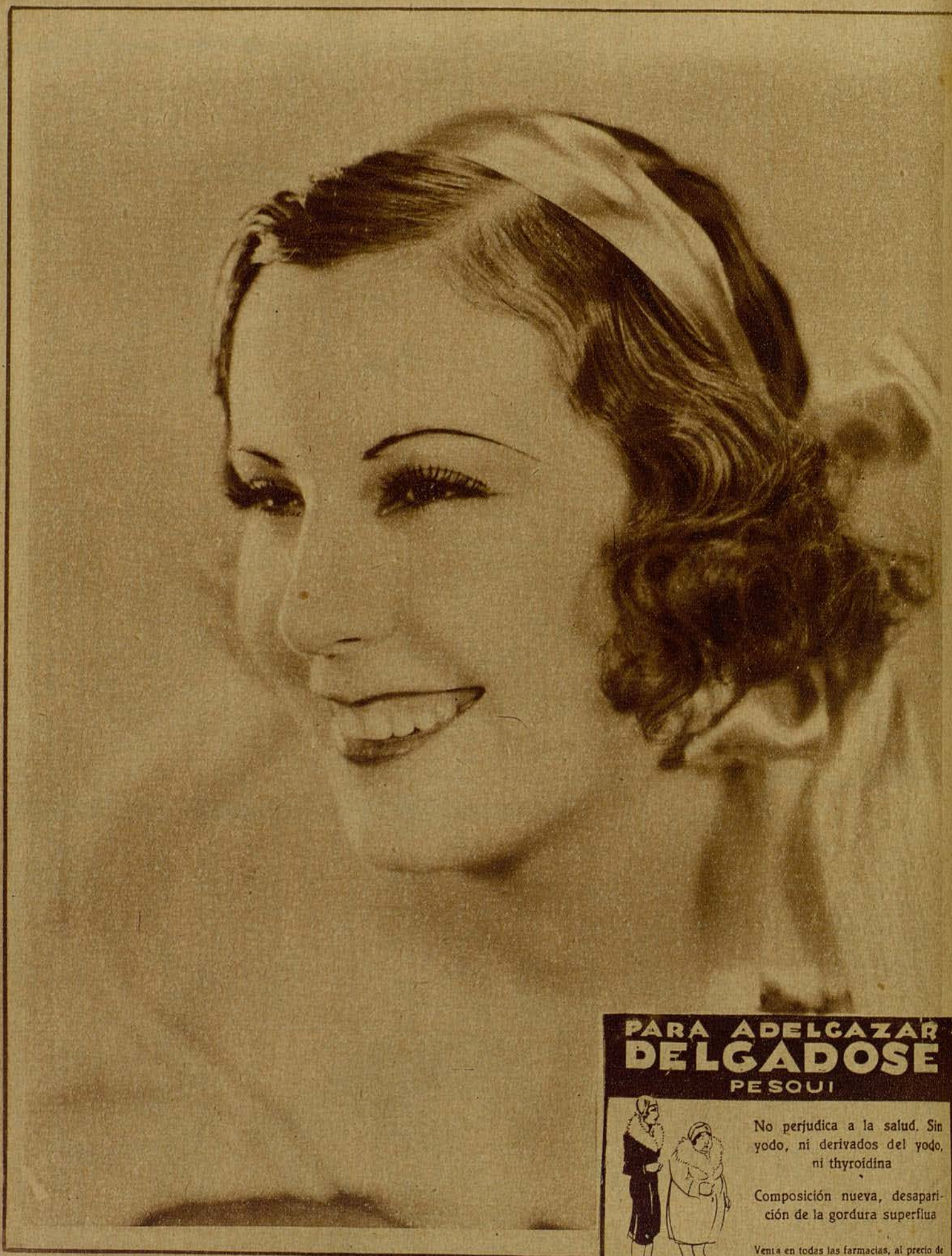
La encantadora estrella Rosita Diaz, ha renovado por largo tiempo su contrato con la Paramount, de Joinville