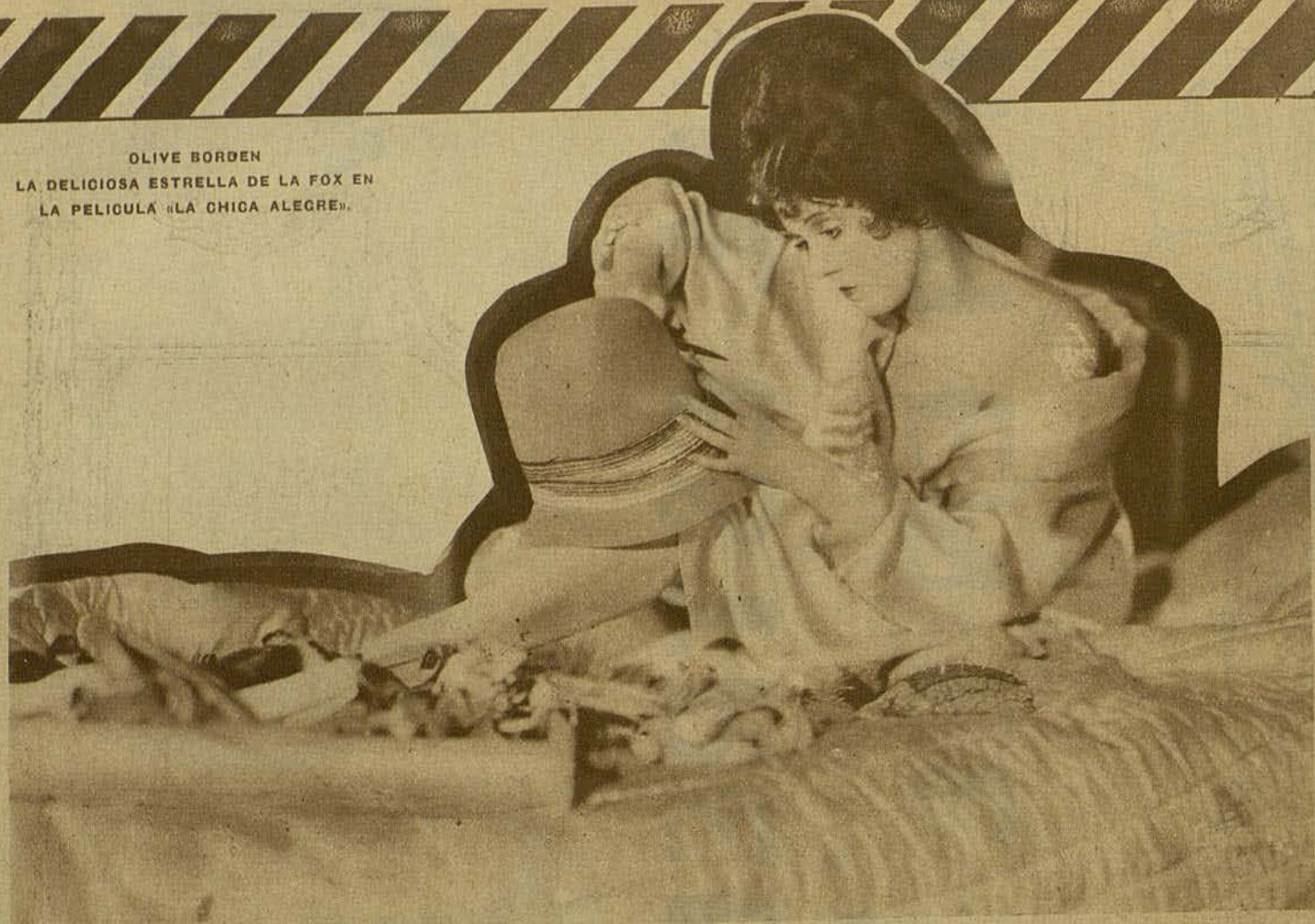
OLIVE BORDEN LA DELICIOSA ESTRELLA DE LA FOX EN LA PELICULA «LA CHICA ALEGRE».