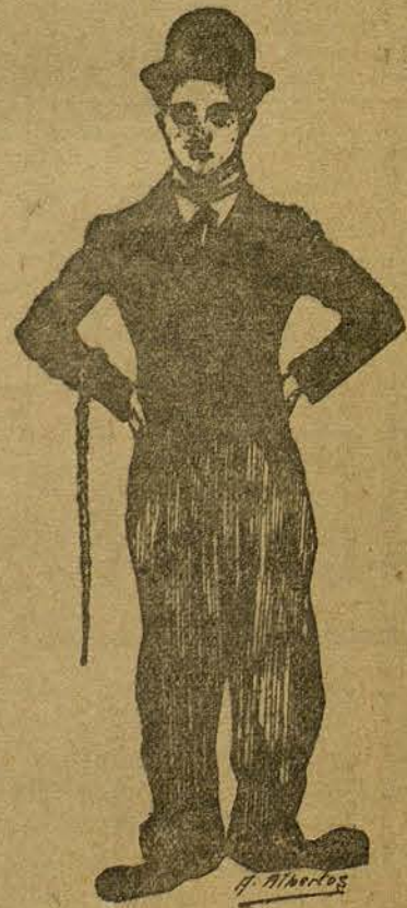
CHARLES CHAPLIN