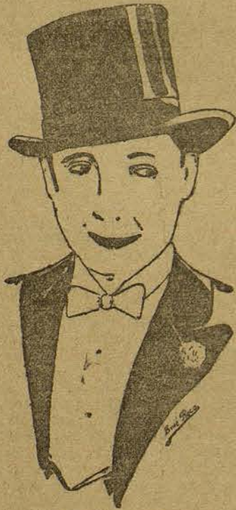
MONTE BLUE (Por Bartolomé Eca Prats, de Barcelona)