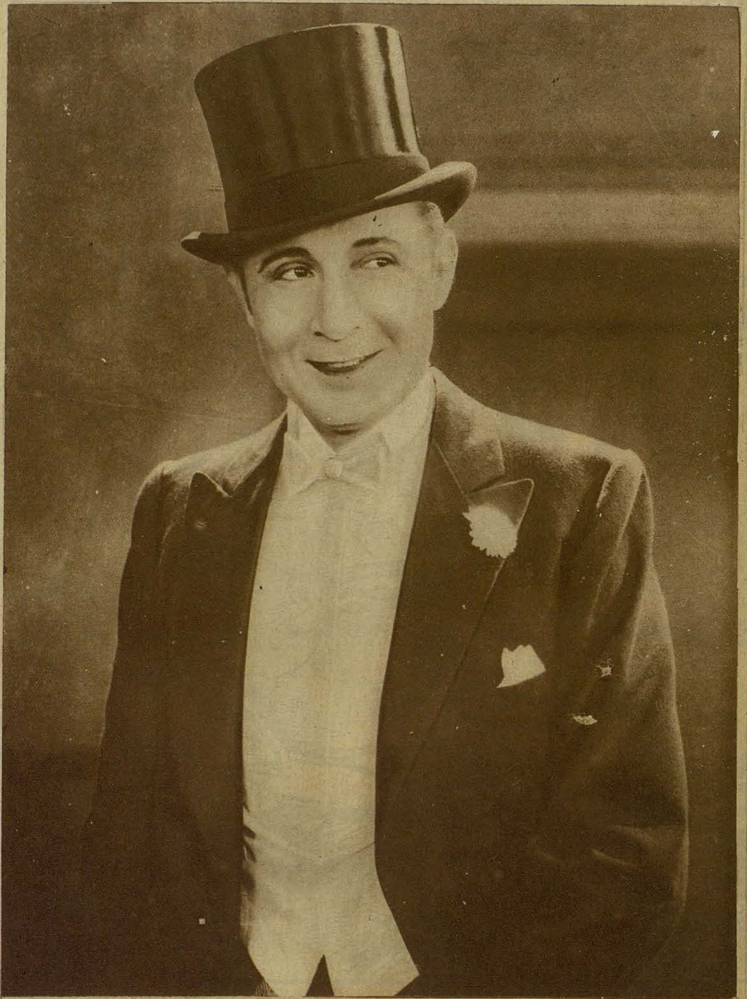
MONTE BLUE.—Un galán joven del Programa Verdaguer, que se ha elevado rápidamente al rango de estrella.