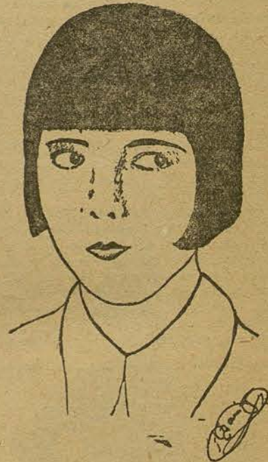
COLLEEN MOORE (Por Francisco Garriga, de Manresa)

ra fumar desde casa, en este caso concreto, para llevar el pitillo en el volante del auto y por medio de un tubo de goma que remata en una boquilla que va a parar a la boca del fumador.