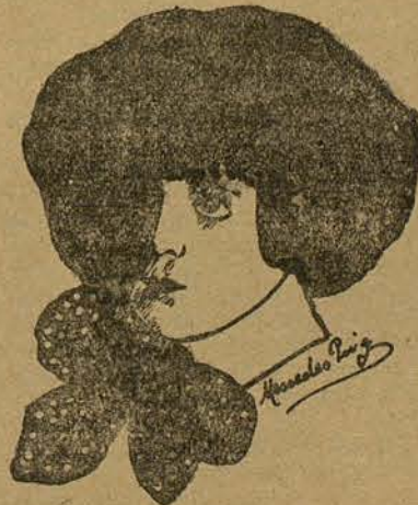
LUISITA GARGALLO (Por Mercedes Puig-Jofré, de Barcelona)