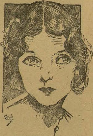
MARCELINE DAY