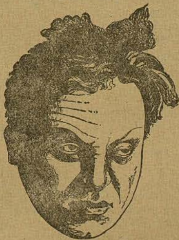
EMIL JANNINGS