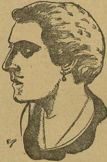
JHON BARRYMORE (Por Nicolás Cruz, de Barcelona)

bondad artística de un individuo y antes de elevarlo con la rapidez de las pompas de jabón, pónganse de acuerdo, y luego, absténganse de elevarlo tanto.