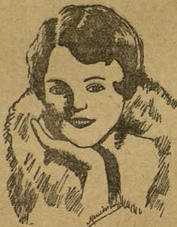
SUE CAROL (Por Mercedes Puig-Jofré, de Barcelona)

mitono más débil y moribundo. Gruesos portiers e impalpables y leves muselinas.