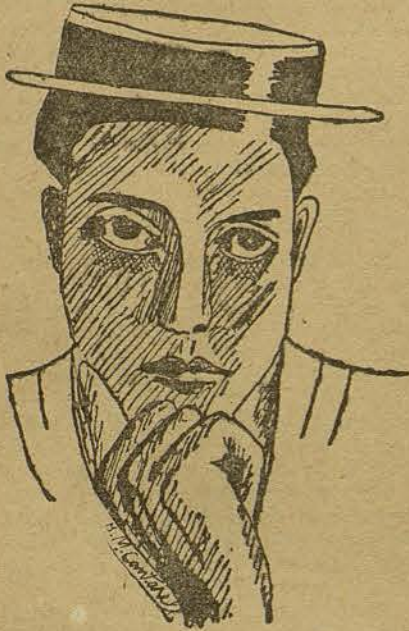
BUSTER KEATON

ce que las empresas no encuentran dónde meterlo. ¿Qué ha pasado? ¿Era arte lo desarrollado por el niño o era simplemente gracia infantil?