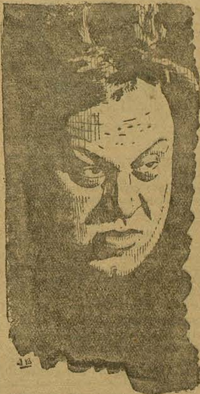
EMIL JANNINGS