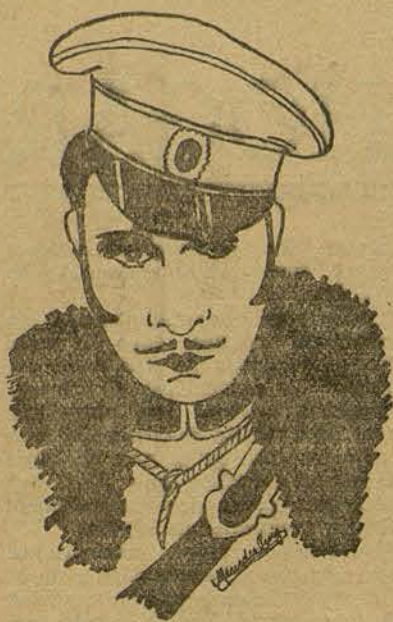
ROD LA ROCQUE (Por Mercedes Puig-Jofré, de Barcelona)

lentino. Desde entonces los stores y persianas hurtan la luz solar a las habitaciones y el casitillo de Rueil-Seraincourt antigua e imponente morada señorial francesa ha albergado los amores legítimos de la sugestiva polaca y su marido el príncipe Mdivani de Georgia.