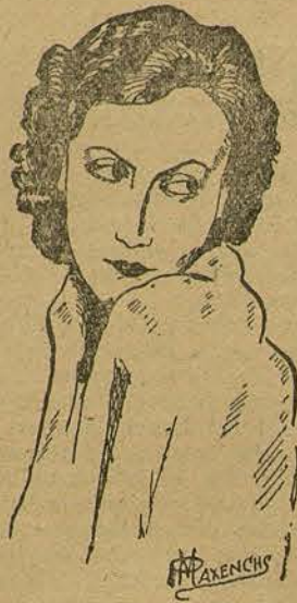
GRETA GARBO (Por Pedro Maxenchs, de Barcelona)