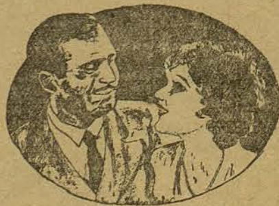
DOUGLAS FAIRBANKS Y MARY PICKFORD (Por Pedro Sala Balaguer, de La Escala)

ma, al oír lamentos, aullidos de fieras... ¡Todo un programa!