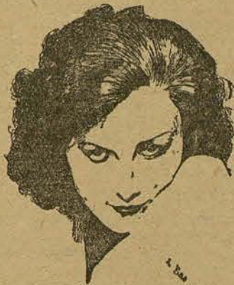
GRETA GARBO (Por Luis Bas y Ferrer, de Barcelona)

lles de organización han sido previstos. Se ha equivocado al decorador. Los dos augures proponen, la estrella dispone. La mayor parte de las veces ella sigue los esclarecidos consejos de gentes preclaras y hábiles que se las componen de manera, que hacen un cuadro en el que resalta su belleza que da felices resultados el noventa por ciento de las veces. Ello sólo tendrá que hacer una aportación de algunos objetos personales: unas tijeritas o todos los artefactos usados en la manicura cuajados de diminutos diamantes, un payaso dislocado, un amuleto fabricado con gruesas y raras perlas, etc. La estrella está siempre rodeada de soberbios detalles, grandes en su misma pequeñez.