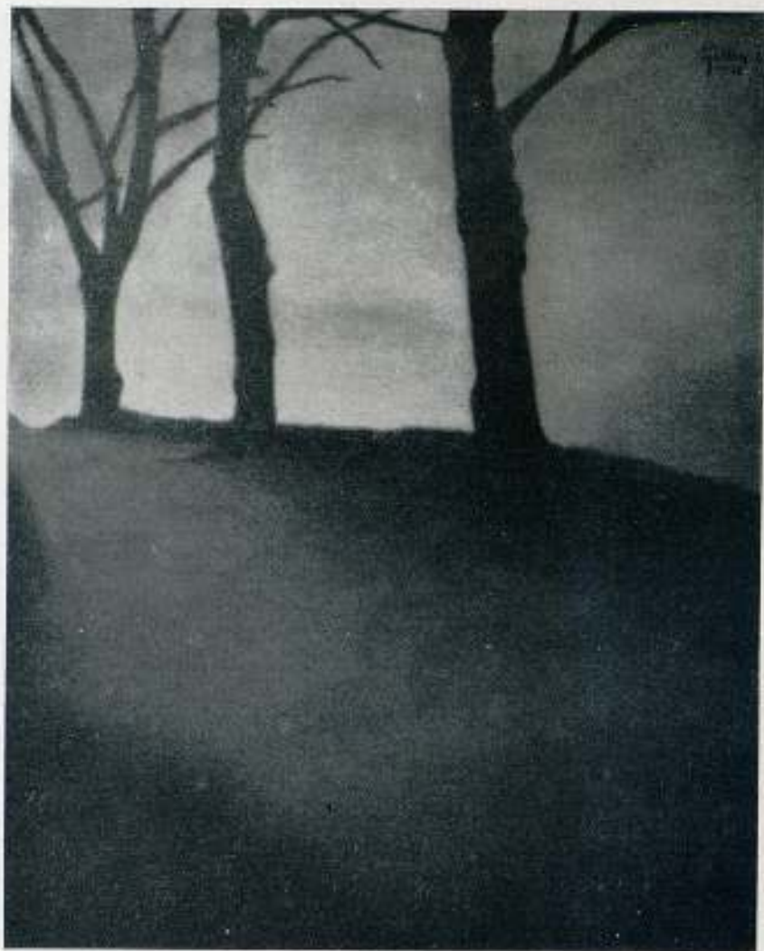
"TRE TRAD" MEDALLA DE PLATA Salón Internacional de Zaragoza