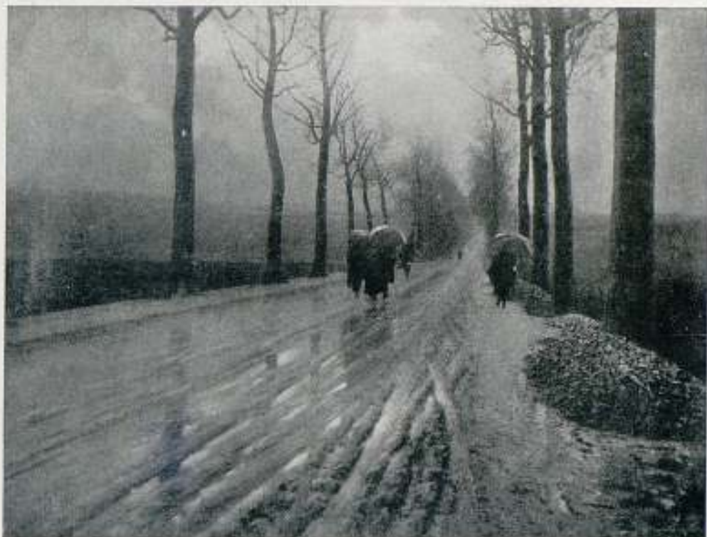
"SALE TEMPS" MEDALLA DE PLATA Salón Internacional de Zaragoza