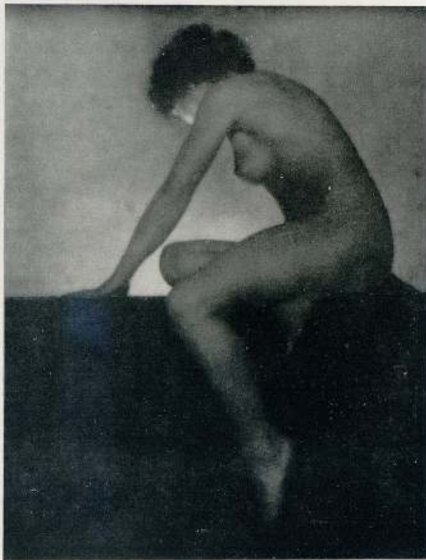
"INTO THE BEYOND" MEDALLA DE PLATA Salón Internacional de Zaragoza