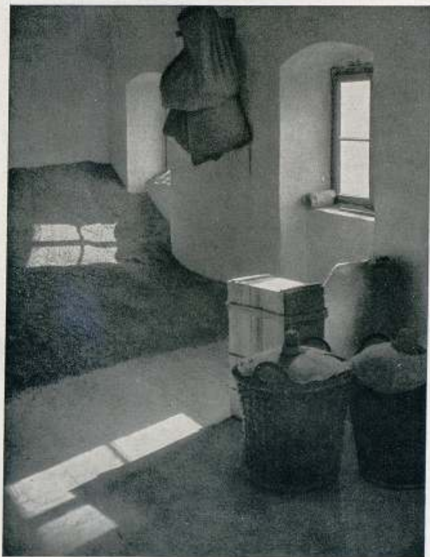
"GENTREIDEBONDEN" GRAN PREMIO DE HONOR Salón Internacional de Zaragoza