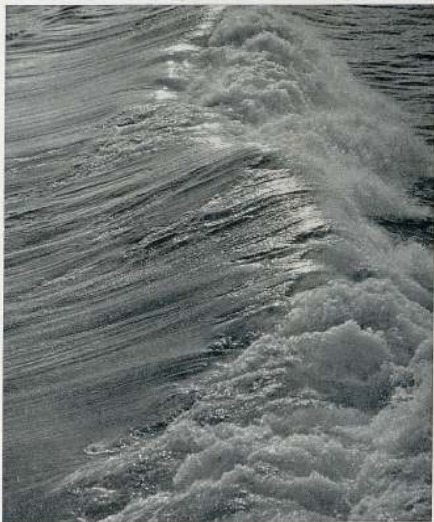
"WAVE" MEDALLA DE PLATA Salón Internacional de Zaragoza