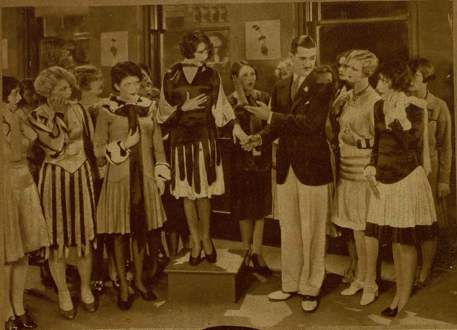
CHARLES CHASE El elegante actor cómico del programa Pathé Exchange, rodeado de un apetitoso coro de «girls».