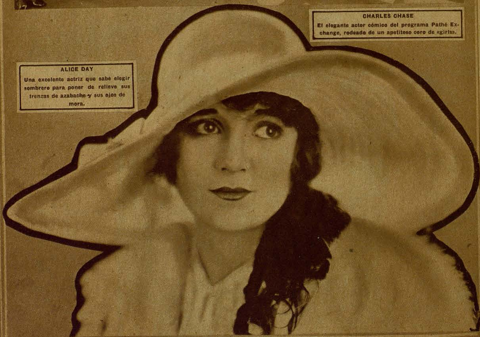
ALICE DAY Una excelente actriz que sabe elegir sombrero para poner de relieve sus trenzas de azabache y sus ojos de mora.