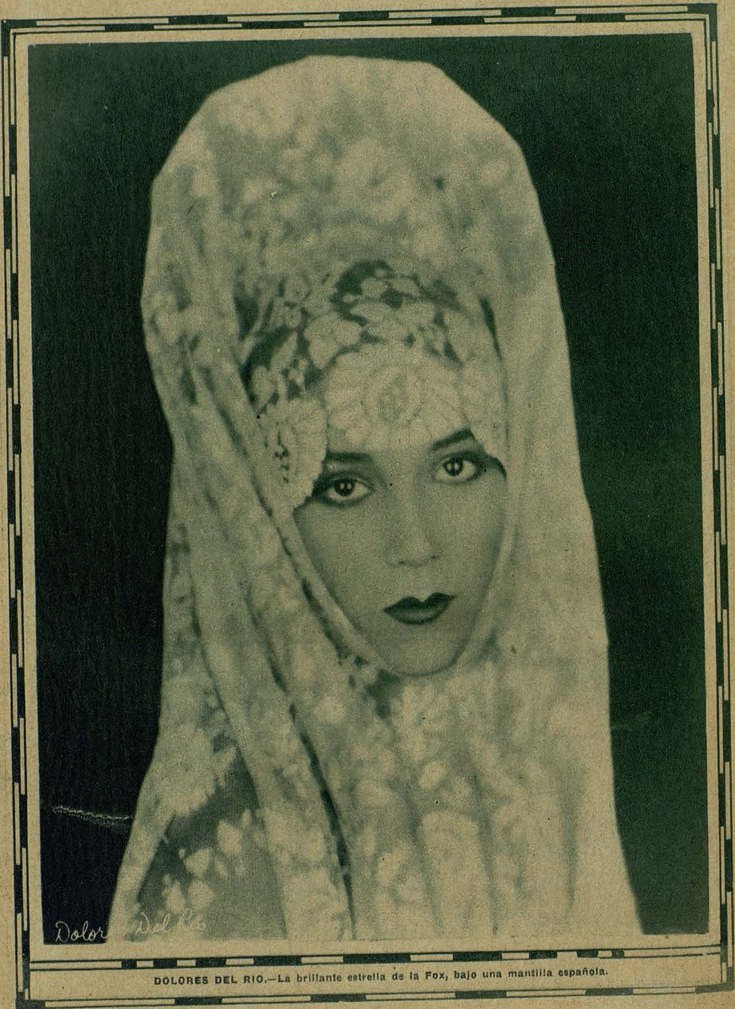
DOLORES DEL RIO.—La brillante estrella de la Fox, bajo una mantilla española.