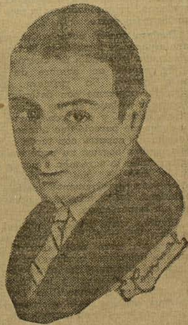
GEORGE K. ARTHUR