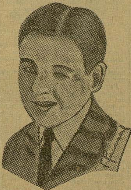
DOUGLAS FAIRBANKS, HIJO

Después que los lectores han recorrido columnas y más columnas describiendo la maravillosa indumentaria de las estrellas del cinema en las películas de la alta sociedad, tenemos aquí algo diferente. En «El juicio Bellamy», adaptación a la pantalla de la sensacional novela de este nombre, que la Metro-Goldwyn Mayer tiene actualmente en producción, Leatrice Joy aparece en las toilettes más sencillas que haya usado en toda su carrera dramática. Esta actriz tan renombrada en Broadway viste en las escenas del tribunal un simple y bien cortado traje sastre, desprovisto por completo de adornos y fantasías.