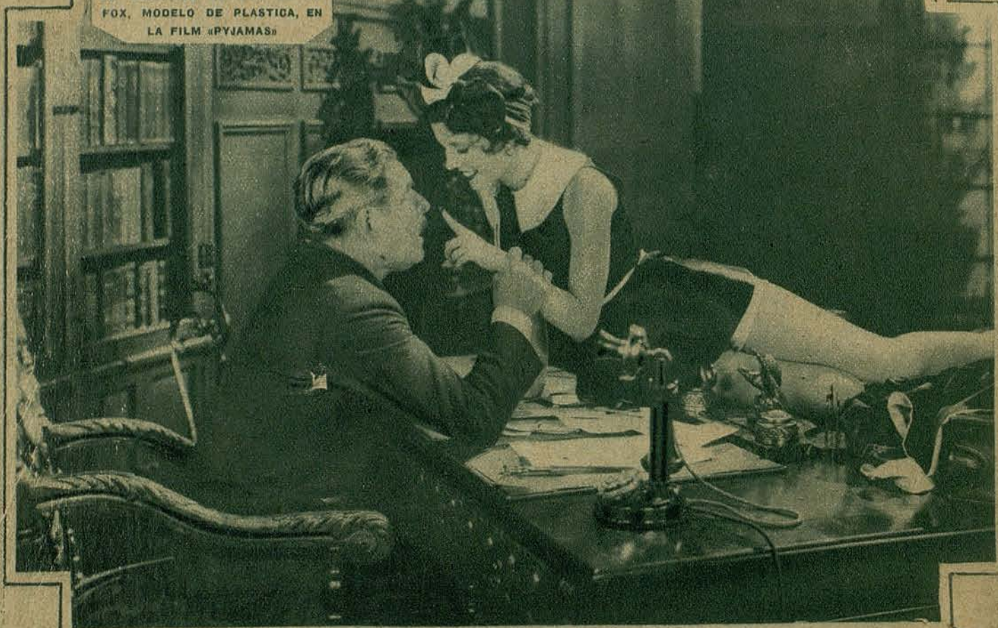
OLIVE BORDEN LA DELICIOSA ARTISTA DE LA FOX, MODELO DE PLASTICA, EN LA FILM «PYJAMAS»