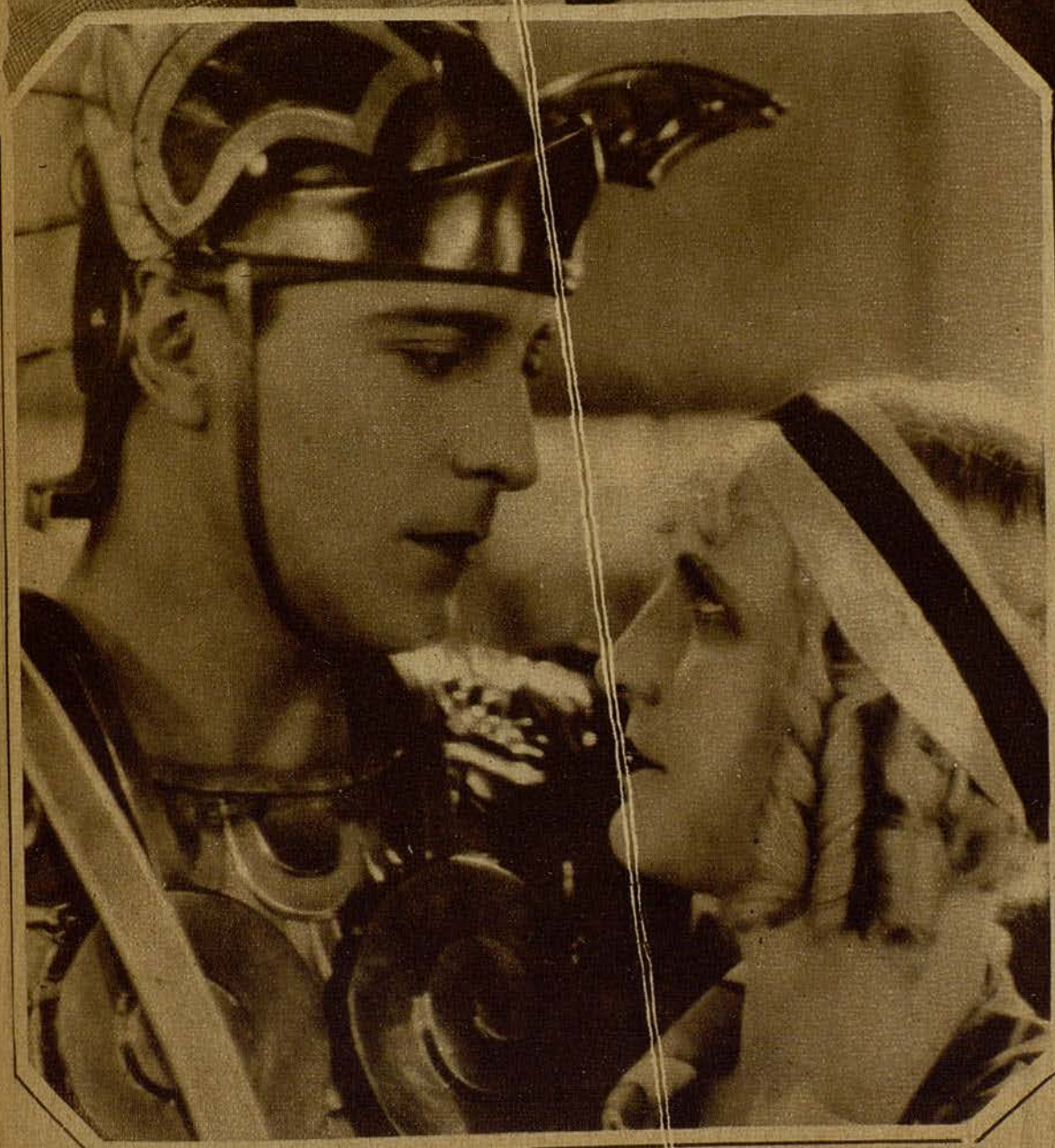
MARIA CORDA Y RICARDO CORTEZ EN LA PELICULA «LA VIDA PRIVADA DE HELENA DE TROYA».