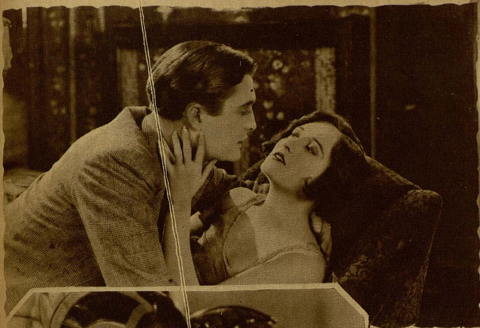
JOAN CRAWFORD Y OWEN MOORE, EN «LA BAILARINA DEL TAXI».