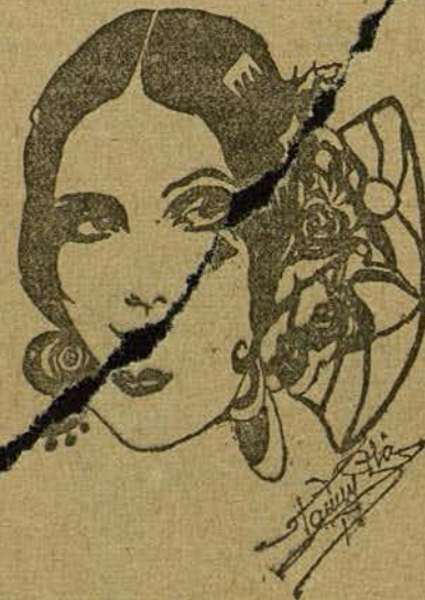
DOLORES DEL RIO (Por Fanny Plá Gilbert, de Barcelona)

cita adorable. Indolente y maliciosa, inclinase hacia la fuente, buscando en el agua el reflejo de su rostro. Es Conchita Montenegro, la gentil y novel «vedette» de film que rueda «M. de Baroncelli», adaptación de una novela de Pierre Louys.