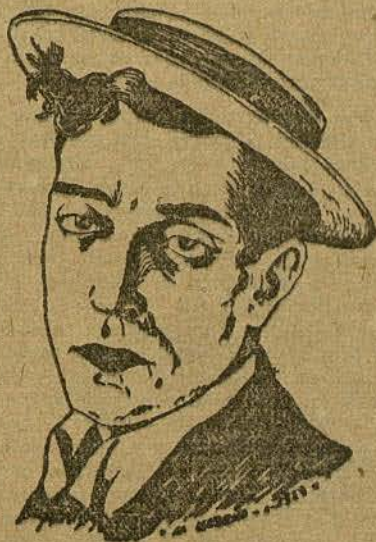
BUSTER KEATON (PAMPLINAS)