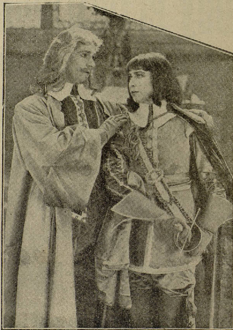
Athos y el Vizconde de Bragelonne en una de las escenas más interesantes de VEINTE AÑOS DESPUÉS

Cuyo éxito en el REAL CINEMA, de Madrid, en el PATHE-CINEMA, de Barcelona y en el CINE MODERNO, de Valencia ha superado a toda ponderación