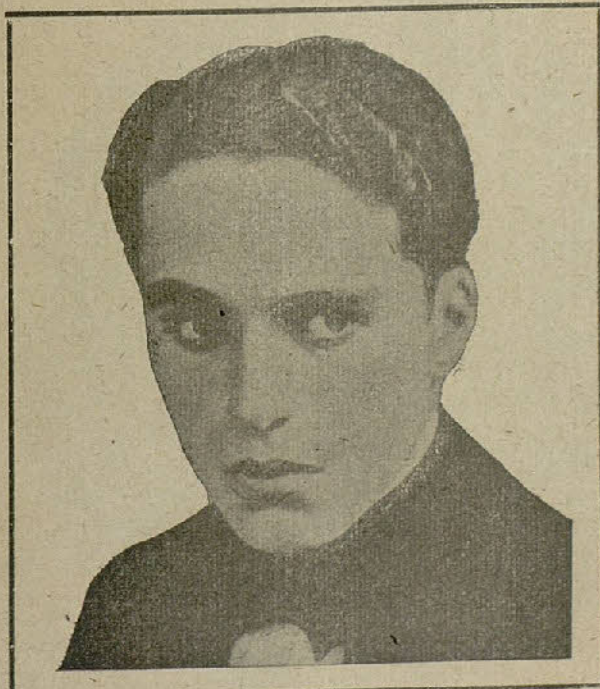
En cambio, Charlie Chaplin sin caracterizar, parece un pastor protestante