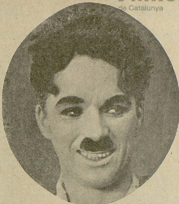
He aquí a Charlot caracterizado en la forma que tanto hace reír al mundo entero

Soy multimillonario, millares y millares de espectadores se regocijan diariamente ante las películas por mí impresionadas y que, dicho sea