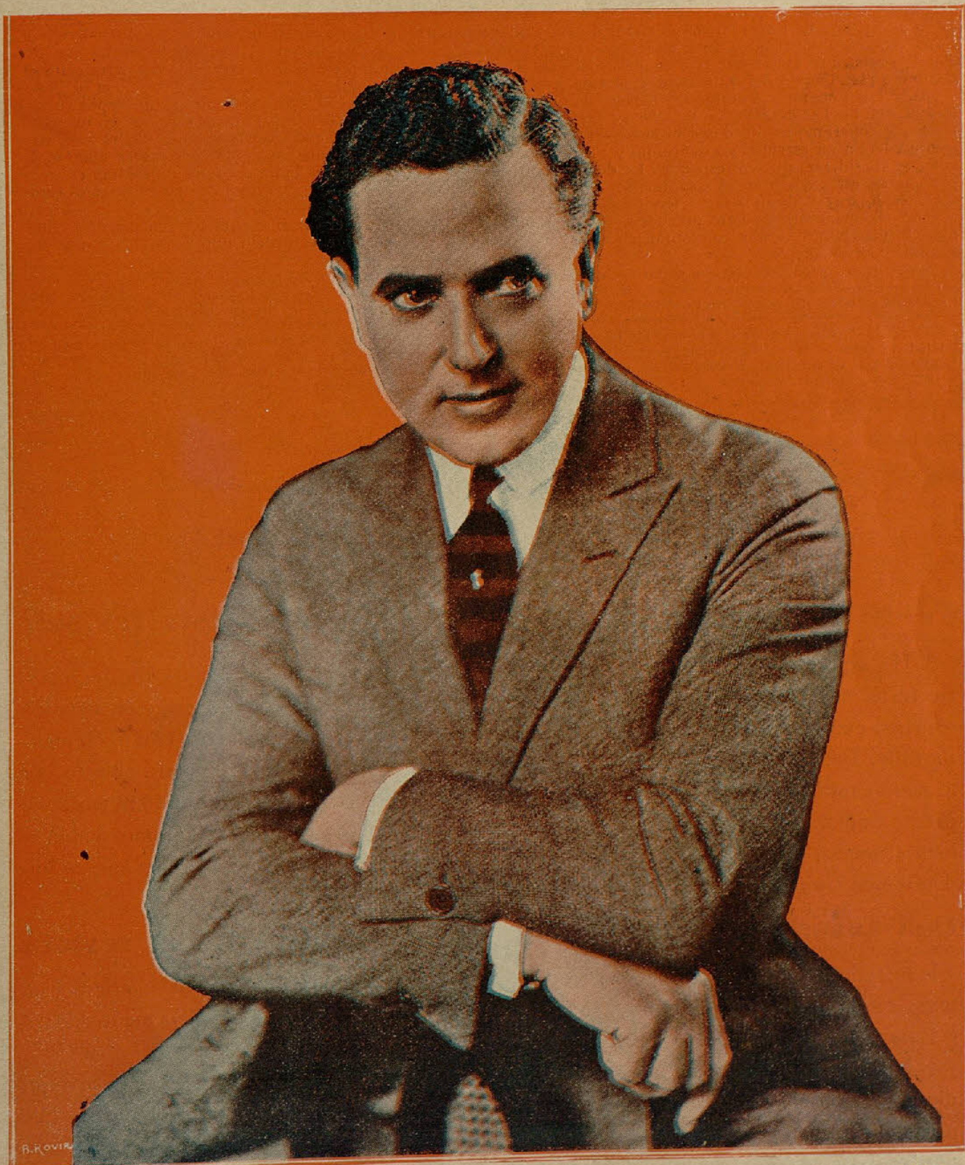
HERVERT RAWLINSON Protagonista de los grandes films, marca Universal, "El automóvil rojo" y "La gran noche" próximas a estrenarse