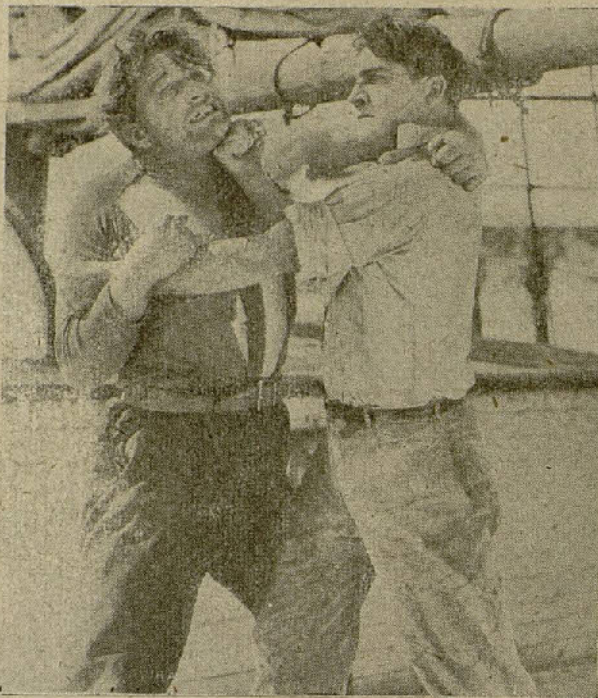
Una escena de la película «Los peligros de Yukon»

Fingiendo un ligero parentesco, Ralph Gor-