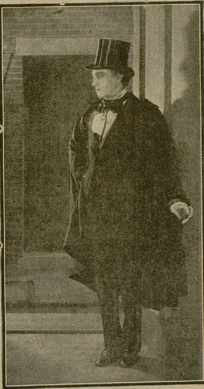
JOHN BARRYMORE en la película «El hombre y la bestia»

esfuerzo para escapar de la crueldad de Marnee, lanza un mensaje radiotelegráfico pidiendo auxilio, mensaje que recibe Bradley Lane, detective científico, quien en respuesta al mismo, pasa por una serie de aventuras que acaban por conducirlo al sitio de reunión de los radicales. Pero los extremistas le reconocen bajo su disfraz, y mediante una diabólica combinación hacen que vaya al laboratorio del brujo Marnee, donde Lane se encuentra frente a frente con su enemigo, el cual creyendo tenerle en su poder trata de electrocutarlo. El muchacho cuyo mensaje llevó al detective a encontrarse cara a cara con la muerte, derrumba a Marnee antes de que éste logre hacer la conexión. Pero el brujo tiene un conmutador en el suelo y haciendo el contacto manda a través del cuerpo de Lane un terrible voltaje.