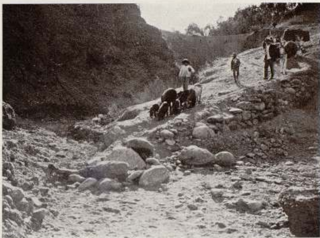
BAJANDO A BEBER A UN RÍO SECO