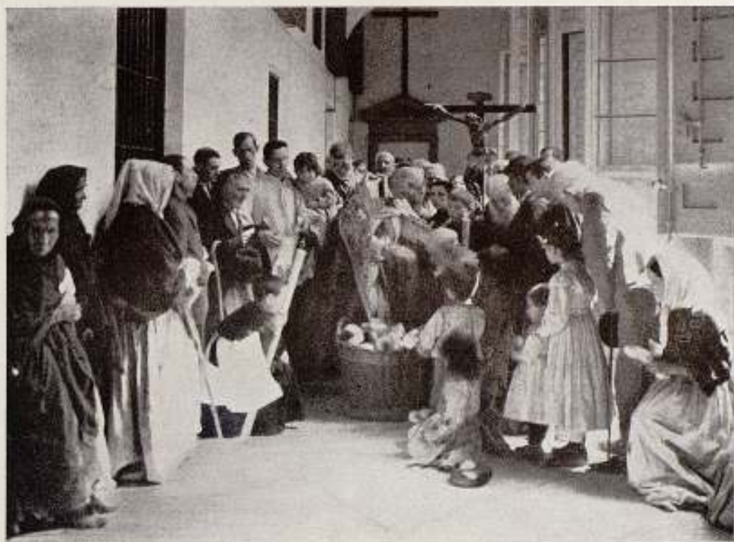
Reparto de pan en las Descalzas de Madrid, donde descubrí al Sr. Cura que podía servirme para la Dolores de Compasión. (¿Quién supiera escribir?)