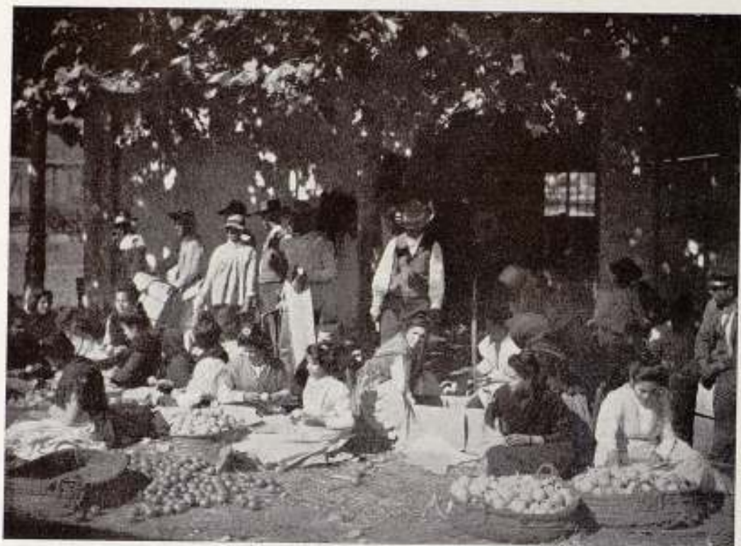
Vulgarísima instantánea obtenida en la estación de Alora (Málaga), y que produjo mucho dinero, por derechos de reproducción en Inglaterra y Norte América a causa del título que se le puso caprichosamente, Packing oranges for England . (Embarcando naranjas para Inglaterra.)