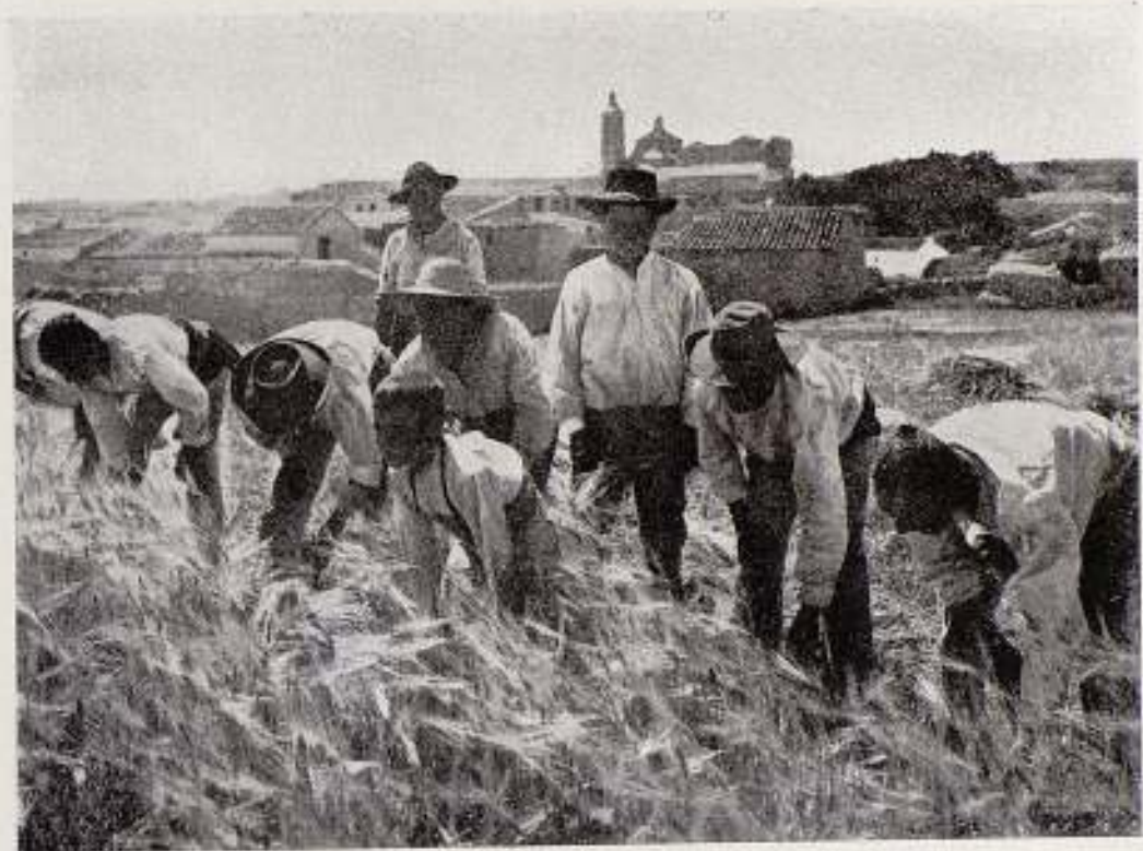
LA SIEGA EN UN PUEBLO DE CASTILLA