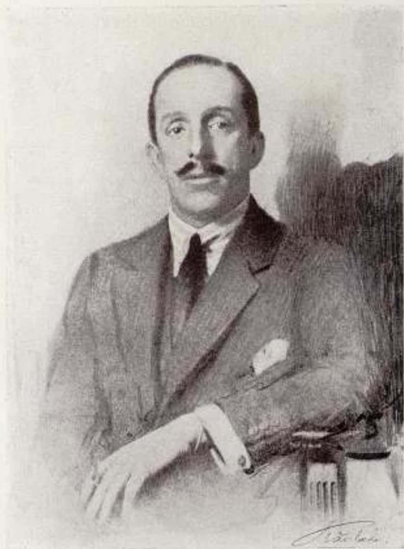
El retrato más reciente de S. M. el Rey, hecho por el procedimiento de las fin- tas grasas.