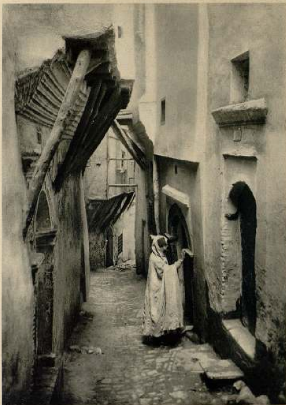
UNE RUE D'ALGER

Négatif sur plaque S. E. Orthochromatique sans écran et anti-halo LUMIÈRE