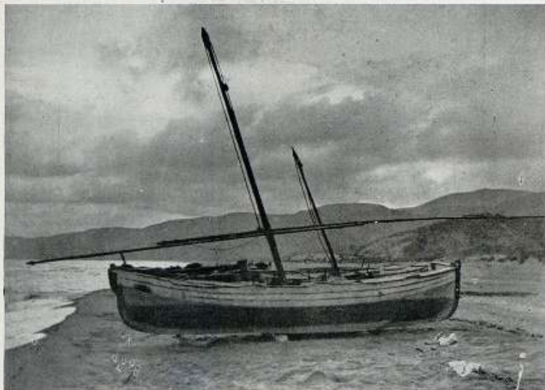
Esperando la calma