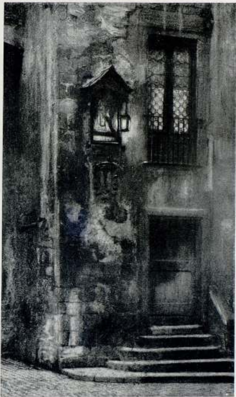
La Virgen de los Milagros