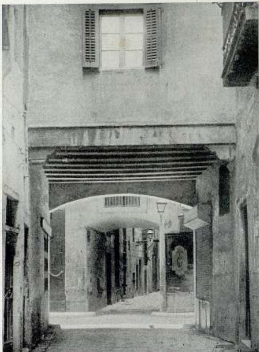
De la Barcelona antiga