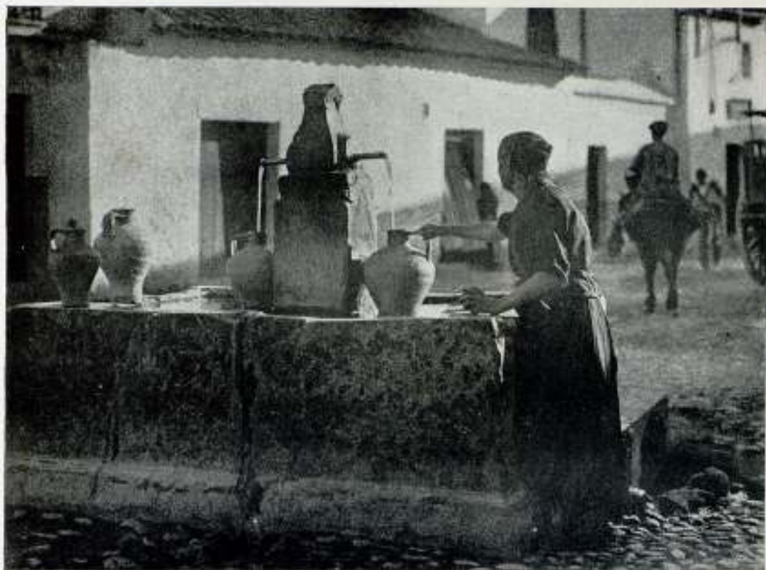
Agua y luz