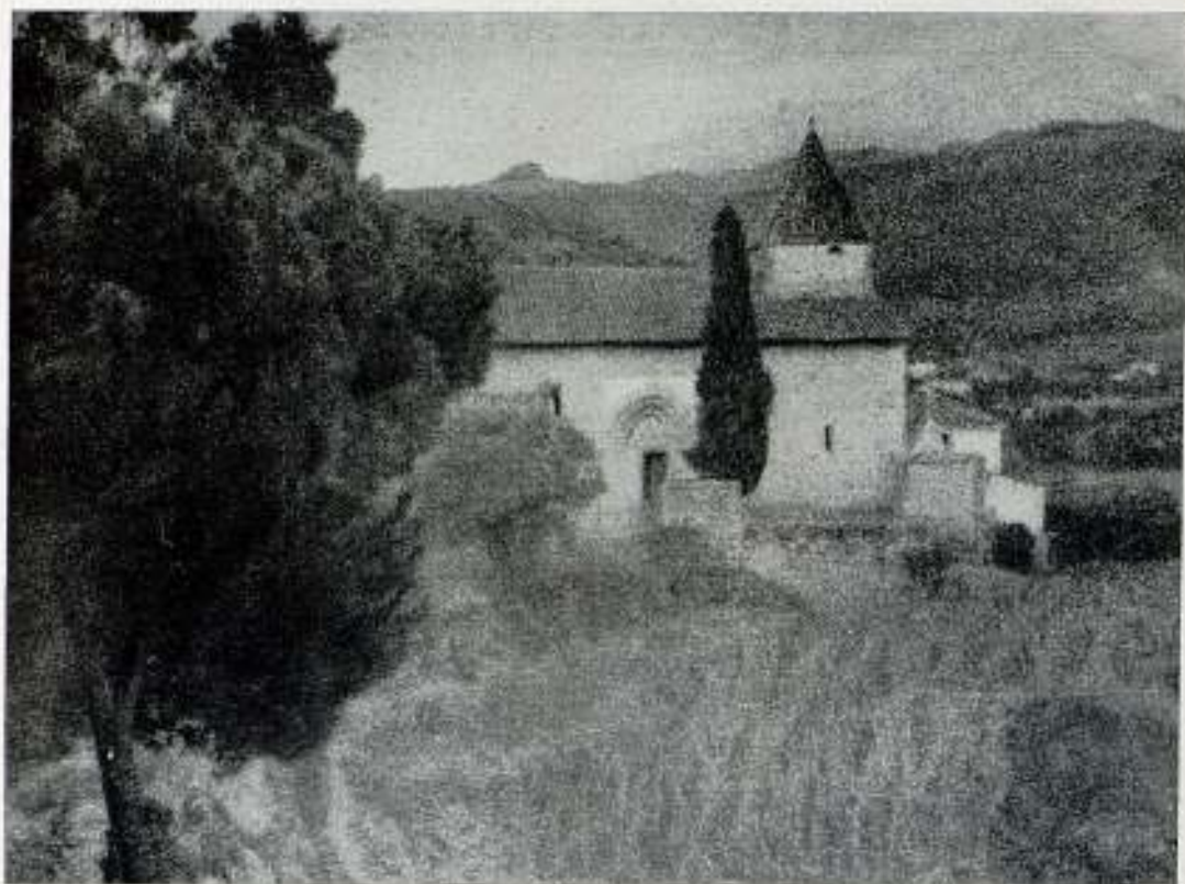
La Ermita de los recatados