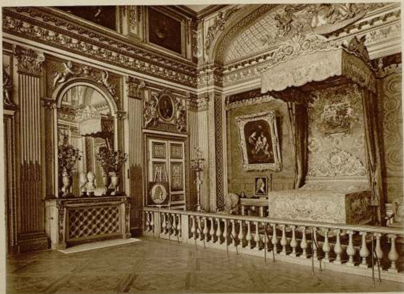
PALAIS DE VERSAILLES Chambre de Louis XIV

Négatif sur plaque S. E. Orthochromatique sans écran et anti-halo Lumière et Joule