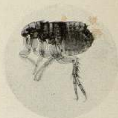
CTENOCEPHALUS CANIS, PULGA DEL PERRO